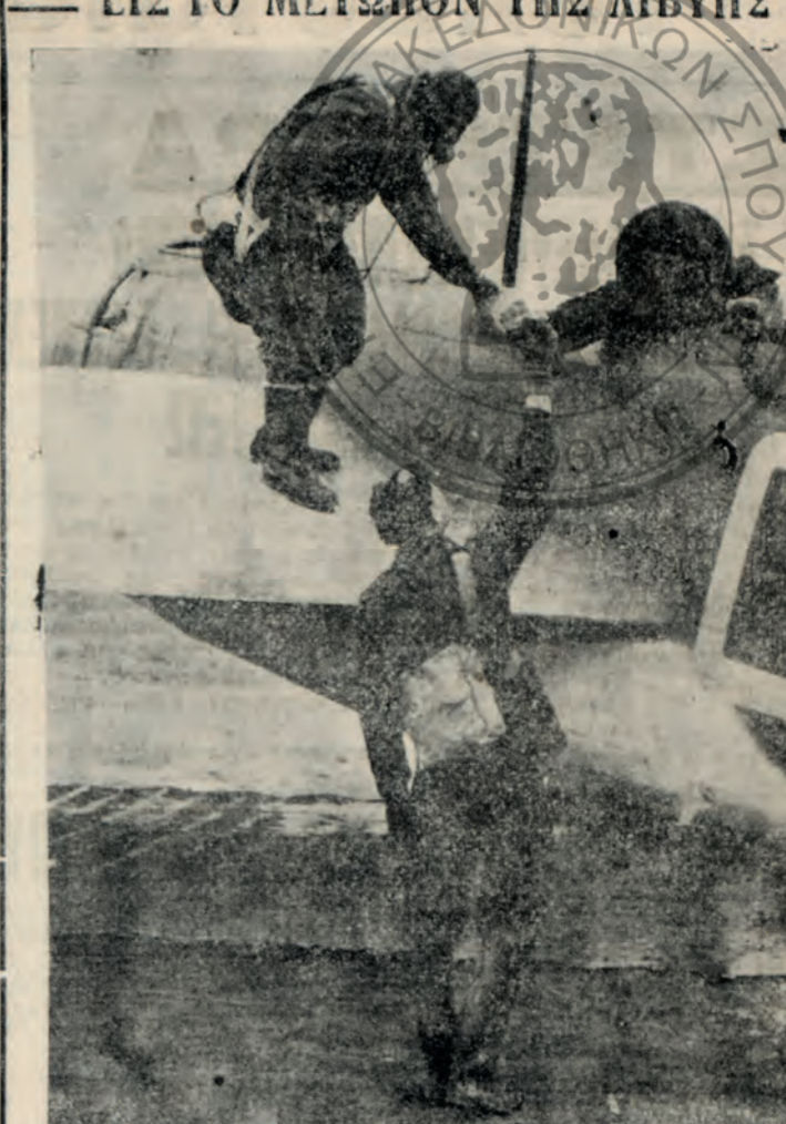
Ολίγα στιγμάς πρό τῆς ἀπογειώσεώς του ὁ ἀρχηγὸς ἐνδὸς βρετανικοῦ βομβαρδιστικοῦ στολίου...