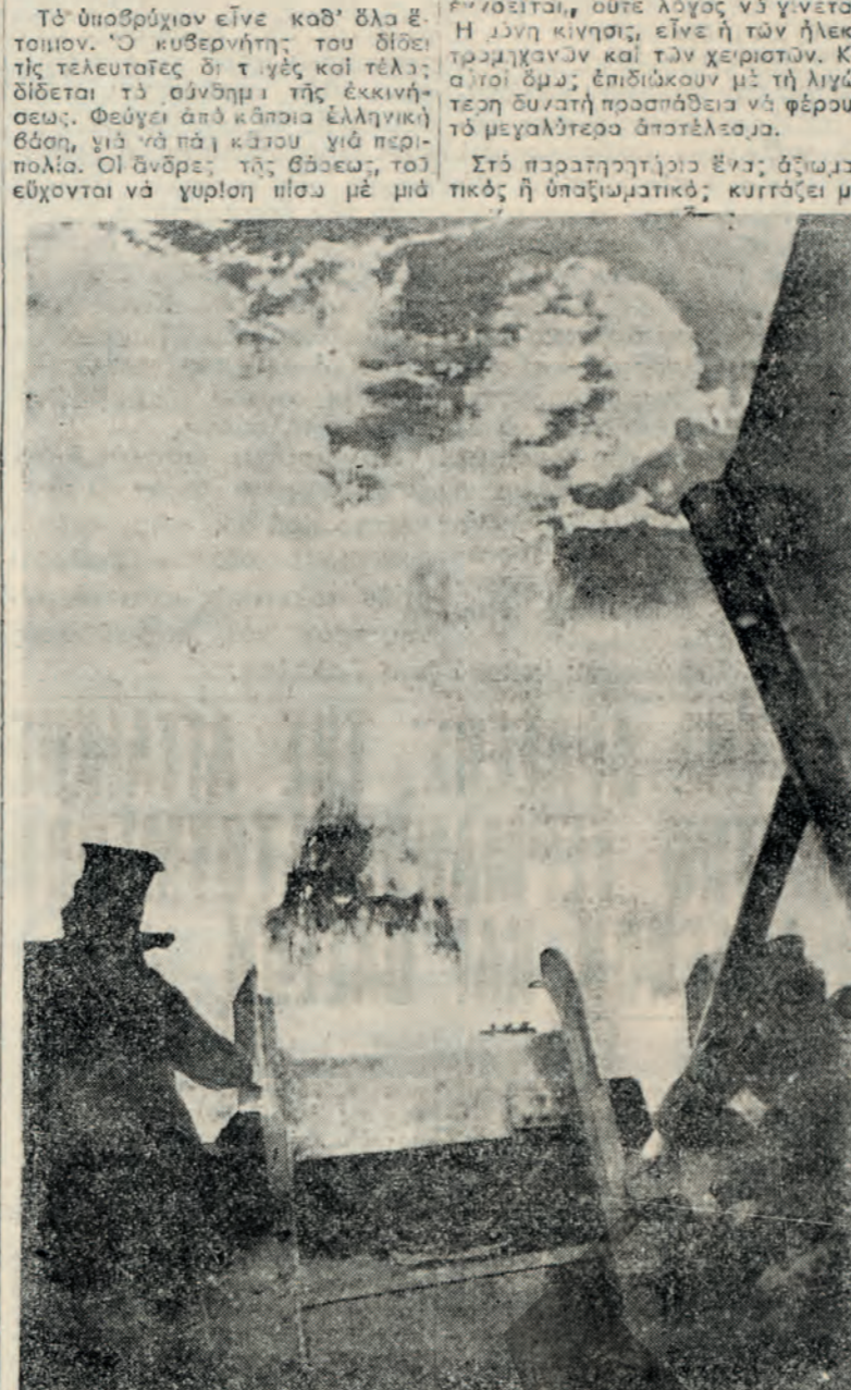
Το τακτικότερον ἔγχειρημα του ὑποβρυχίου: Ἐσπάλεισ τερπιλάς ἐν ἀναύσει.