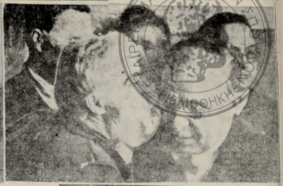
1) Ο δαίμονος Ιωάννης Μεταξάς, έπισκεπτόμενος, το 1936, τήν περίπερα τής Έκθεσης Θεσσαλονίκης, ή όποις, χάρις εις τήν πατριήν του μέριμα, απέκτησε τās σημερινās θουμασιās έγκαταστάσεις τής. 2) Είς μίαν πρώην του οσκαφίην τού Γενικού Έπιτελείου όπύ τήν προεδρείαν τής Α. Μ. τού Βασιλέως, ό έκλιπών παρωσιμένος ήνέτης αναπτύσσας τās σκέψεις του επί τής διεξαγωγής τών πολεμικών έπιχειρήσεων εις τού Άλβανικών Μετασών. 3) Είς τήν ήρωσάοκον Κρήτην κατά τήν θριαμβευτικήν περιόδου του τού 1938. Ένας γηραιός άγωνιστής τών άσπάεται έκ μέρους όλων τών βρετανών τών άγωνών τής ανεξαρτησίας τής μεγαλόημου μας.