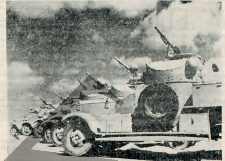
Νεωτότου τύπου άντιεραερορικά πυροβόλα σε κάποιον σμητό τής νοτιανατολικής 'Αγγλίας.

ΛΟΝΔΙΝΟΝ Μάρτιος.— 'Η άποστολή τών αμερικανικών εφοδιών εις μεγάλον κλίμακα πρός τήν 'Αγγλίαν ήρχισεν 400 φορτηγά πλήρη εφοδιών ήδη έπεί τον πρώτον εκκοσιτετράωρον εις τόν ποροσισμόν των. Ερωτάται Ποιοί είνε οι γενικοί πόροι, έκ τών ό-