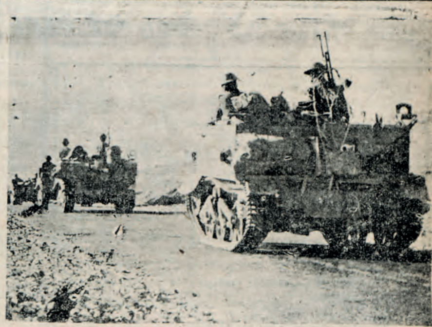
Νεοζηλανδοί μιας μηχανοκινήτου φάλαγγος έν πορεία προς τήν Τριπολιτία