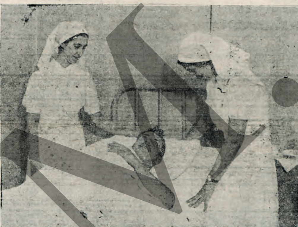
Με καταφανή τήν ικανοποίησιν Γαγγερισμενός εις τό πρόσκόν του Ένας Γραικός τραυματίας λαμβάνει πληροφορίες από τό μέτωπον