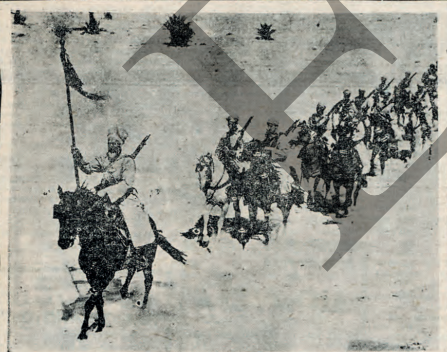
Λογχοφόροι τής Βεγγάλης διασχίζοντες τήν Λιβυκήν έρημον