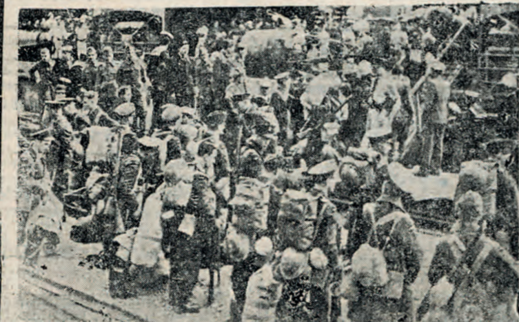
Δυνάμεις τής Βασιλικής άγγλικής αεροπορίας, κατά την στιγμήν τής αποδιάθεσός των