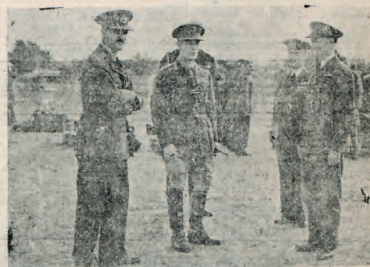
Ή Α.Μ. ο Βασιλεύς συνομιλόν μετά αξιόνων τής αεροπορίας κατά τινος πρόσφατον επίσκεψίν του εις έν αεροδρόμιον μας