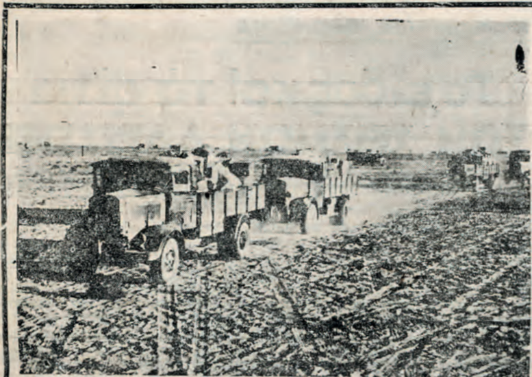
Ίταλικά αυτοκίνητα λάφρα τού στρατού μας χρησιμοποιούμενα τώρα υπό των μεταγωγικών υπηρεσιών μας