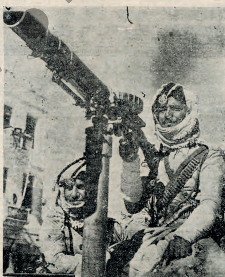
Άραβες πολυβοληταί χειριζόμενοι άντιαεροπορικόν πολυβόλον