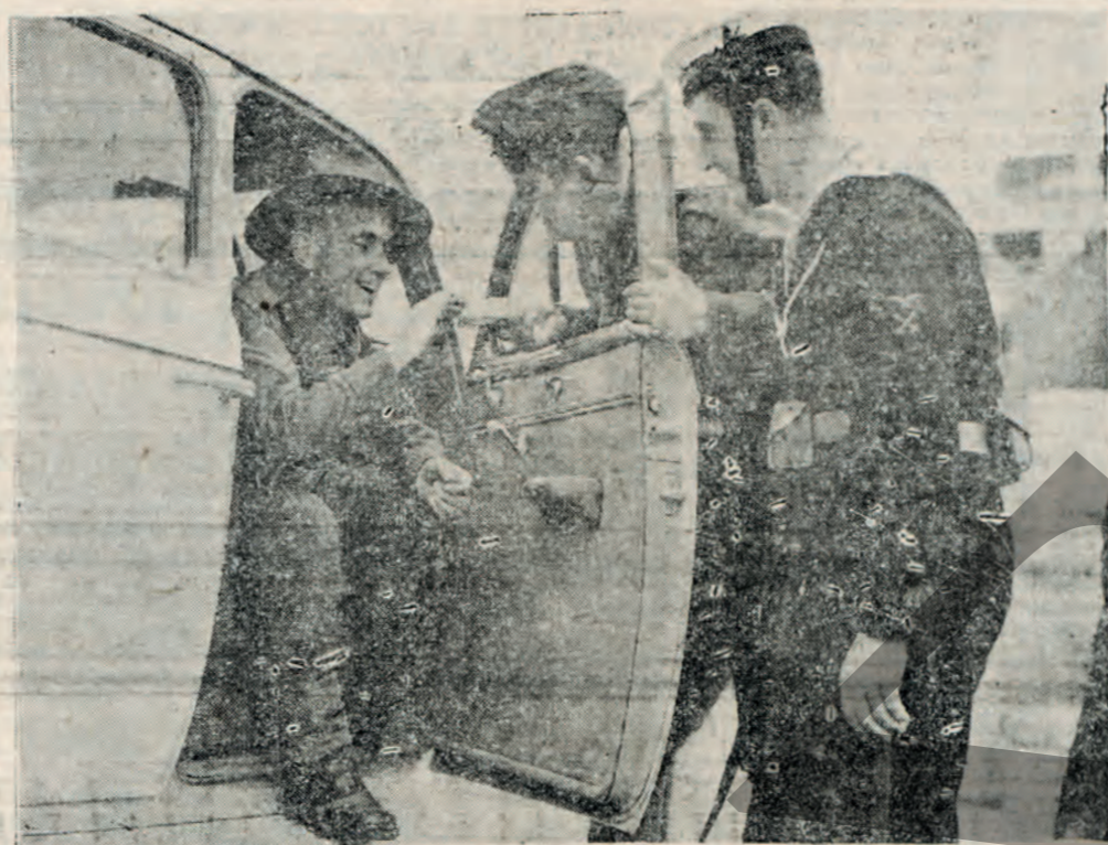
Έλλην στρατιώτης προσφέρειν τσιγάρα εις Ένα Νεοζηλανδόν αεροπόρον εις κάποιο σημείο του μετώπου.