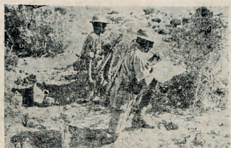
Ροδεσιανοί ευναγοί τής φυλής των Σουλού πρό τής επιθέσεως