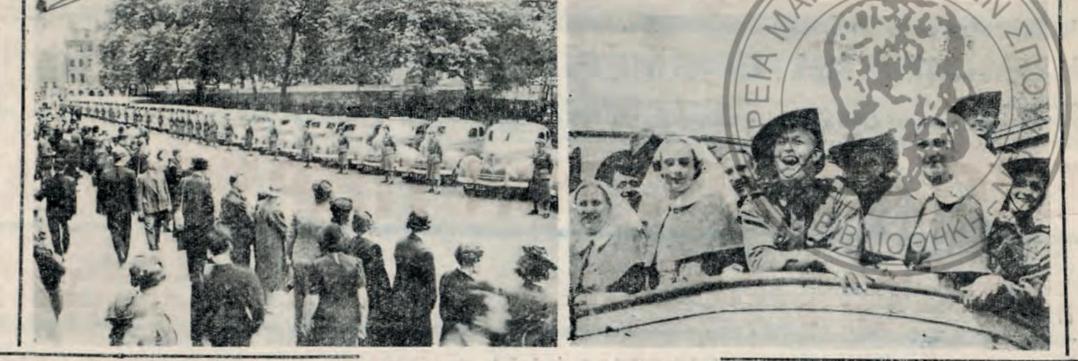
Α σελιά: Κορίτσια τής άριστοκρατίας τού Καναδά, καταταγέντα ως εθελοντίδες αδελφάι εϊς τόν 'Αγγλικόν 'Ερυθρόν Ιστού...