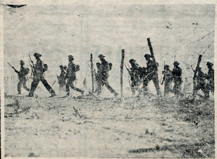
Γιγαντώσωμοι Αύστραλοι κατά μίαν θεαλλόζη έξόρμησιν των εις τό Μέτωπον τής Λιβύης