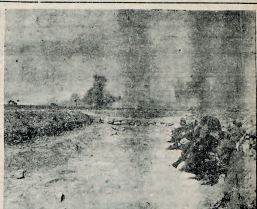
Έγχρωμοι στρατιώται τής Νιγηρίας εις τά πρόθυρα του Κερέν