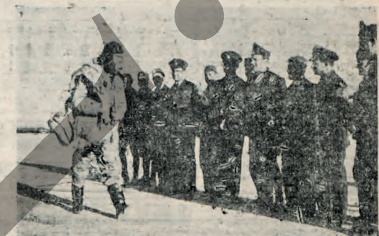
Τεμάτος ένθουσιασμού Ένας αεροπόρος μας επιστρέφει από μίαν επιτυχή επίχειρσιν. Οί συνάδελφοί τουτόν χειροκροτούν