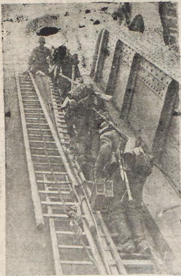
Γερμανοί στρατιώτες ενός τμήματος κρούσεως αναρριχώμενοι διά προχείρων κλιμάκων από μίαν γέφυραν την οποίαν κατέστρεψαν οι Μπολσεβίκοι...