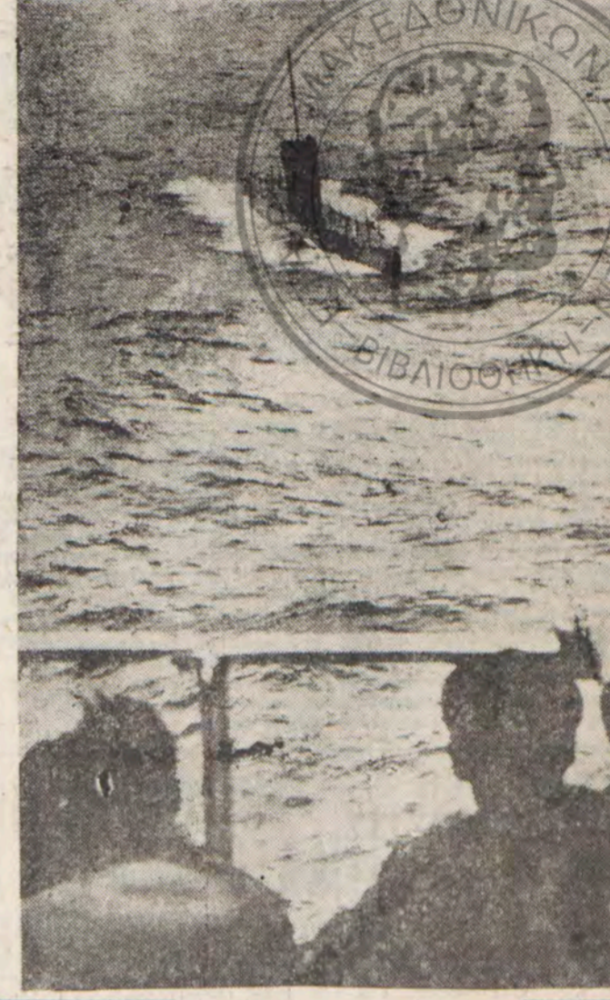
Ἀπὸ τὴν καταβύθισιν τοῦ ἐξοπλισμένου βοηθητικοῦ τοῦ ἀγγλικοῦ στόλου «Γιόρκαϊρ».