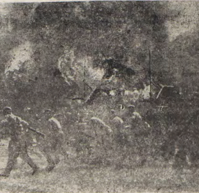
Γερμανικὰ στρατεύματα ὑποστηριζόμενα ἀπὸ τάνκς εἰσέρχονται εἰς ἐν πρώτοιαν ἀπὸ τὰ ὅποια ἡ βρετανική προ...