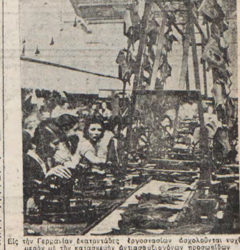
Εἰς τὴν Γερμανίαν ἐκατοντάδες ἐργοστασίων ἀποκαλοῦνται νυχθημερῶν μετὰ τὴν κατασκευὴν ἀντιασφειδῶν προσωπίων.