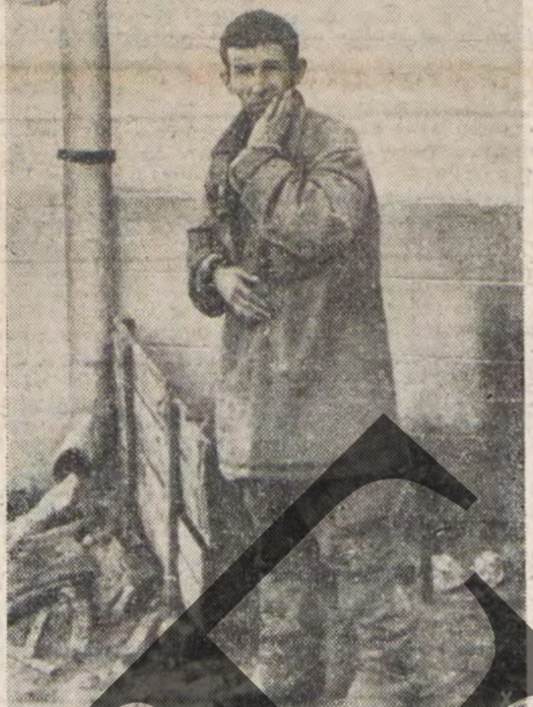
Ρώσσοι αἰχμάλωτοι. Δὲν εἶναι καὶ πολλοὶ πολεμιστὰς τῆς ἁγίας.

Ἐπισημαίνεται ὅτι τὸ ἄσκησιον τῶν Ἀνατολικῶν Γερμανικῶν Ἀρχηγείων συμπληροῦται συχνάκις με συνηθισμένης εἰδήσεως, αἱ ὁποῖαι παρέχουν ἐνδείξεις διὰ τὴν ἰσοτιμίαν καὶ τῆς δυσχερείας, ἀλλὰ καὶ διὰ τὰς μεγάλας ἐπισημὰς ἐπιτυχίας, αἱ ὁποῖαι πραγματοποιοῦνται ἀεὶ κατὰ τὴν ἐξελίξιν τῶν ἐπιχειρήσεων εἰς τὸ ἀνατολικὸν μέτωπον.