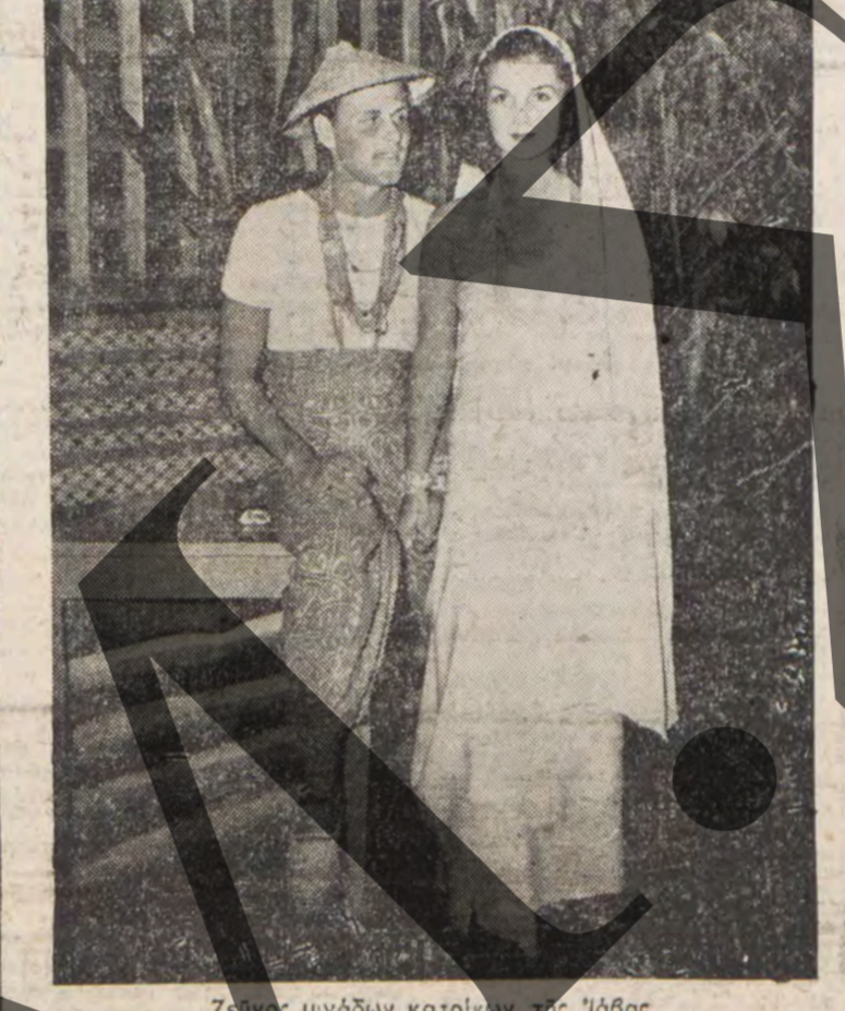
Ζεῦγος μιγδῶν κατοικῶν τῆς Ἰάβας

καλλιέργειαν τῶν καφεενδρῶν καὶ τῶν περσιῶν. Τὸ 199 τὸ μολυβδῶδες τῆς Ἑταιρείας περιήλθεν ἀπὸ τὸν ὀλλανδὸν καὶ τὸν κυβερνητικὸν τῶν Ἰνδιῶν Ἐπιχειρηματιῶν. Ἐχοῦν διοικήσει τὸν ὀλλανδὸν καὶ τὸν κυβερνητικὸν τῶν Ἰνδιῶν Ἐπιχειρηματιῶν. Ἐχοῦν διοικήσει τὸν ὀλλανδὸν καὶ τὸν κυβερνητικὸν τῶν Ἰνδιῶν Ἐπιχειρηματιῶν.