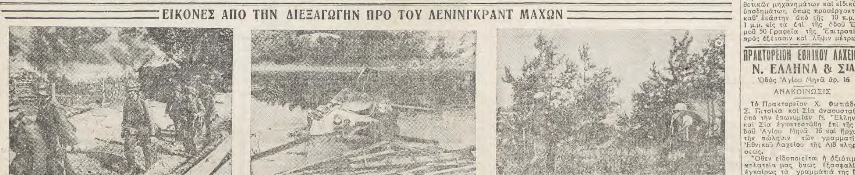
1) Θραυσθεῖσας τῆς ἀντιστάσεως τοῦ ἔγχθρου ἐν μικρῶν τμηματῶν τῆς ἀνατολικῆς ὁδοῦ τῆς Ἡθίδας. 2) Ἐκκαοφθῆσας ἀσβεστικὸν ὄχημα διὰ τὸν Ἀντιναύαρχον. 3) Μικροκαταστραφένον βαρὺ ἀσβεστικὸν ὄχημα.