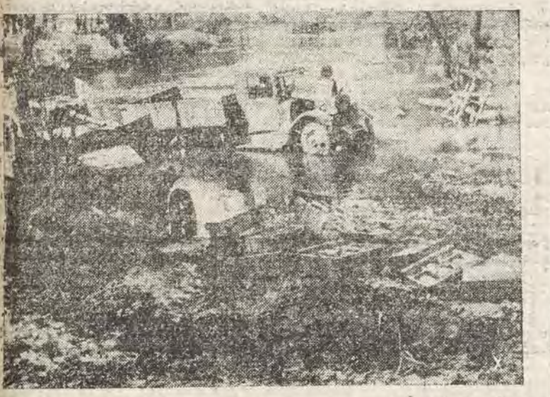
Άρματα μάχης και μεταφορικά αεροκίνητα έγκαταλειμένα εις ένα σημείον τών οδών της λίμνης "Ιλιμεν"

Παντοθεν όμοι: τούσιν τίθεσται τού έρώτημα: Εις τί έλπίει ή Άγγλία μετά την καταρροσιν της αταστάσεως τού ύπολοιπου ρωσικού πλήθυστος; Τίν άπάντησιν παρέχει κληρονομία ή ίδια άγγλική προπαγάνδα. Ο Τσορτάλι έλπίει εις τών σοσπιάν τούσιν τών Ηνωμένων Πολιτειών. Όλόκληρον ή Άγγλία έλπίει, ότι αι Ηνωμένα Πολιτεία εντε εις θέσιν να άποσπασθόν τας σημερινάς μεγάλας φροντίδας της Μεγ. Βρετανίας. Και ή κύρια φροντίς της Άγγλιας άποκατελείται ελλείψει χωρητικότητος σκαφών, ή όποια καθιστάται, από ήμάρας εις ήμάρας, λόγω της άποσυνθετικής μάχης τού Άτλαντικού, σοβαρότατος. Όταν μελετήσιν κανείς τού ήμπερολόν της άμερικανικής έμπορικης ναυτιλίας, θ' άγέρθη ότι ό στόλος της άνέρχεται εις 12 εκατομμύρια τόνων και εις φουσκόν τών άντιλήπτιν, ότι δια τούσιν τρωαίον αούτθ άποθήκων, δύναται να άκμπληρωθόν αι άγγλικαί έλπίδες. Έν τούτοις, ή προσοχή της έκτάσεως τού προβλήματος, θα φέρη εις φώς, ότι εκ τών 12 τούτων εκατομμυρίων τόνων, μόλις τα 7 εκατομμύρια διατίθενται διά τών ύπερατλαντικήν ναυτιλιών. Τα όπόλοιπα 5 εκατομμύρια συνιστάται, εν μέρει, εκ παλαιών σκαφών, παλιών τών ήδη από της άρχής τού πολέμου προς τίν