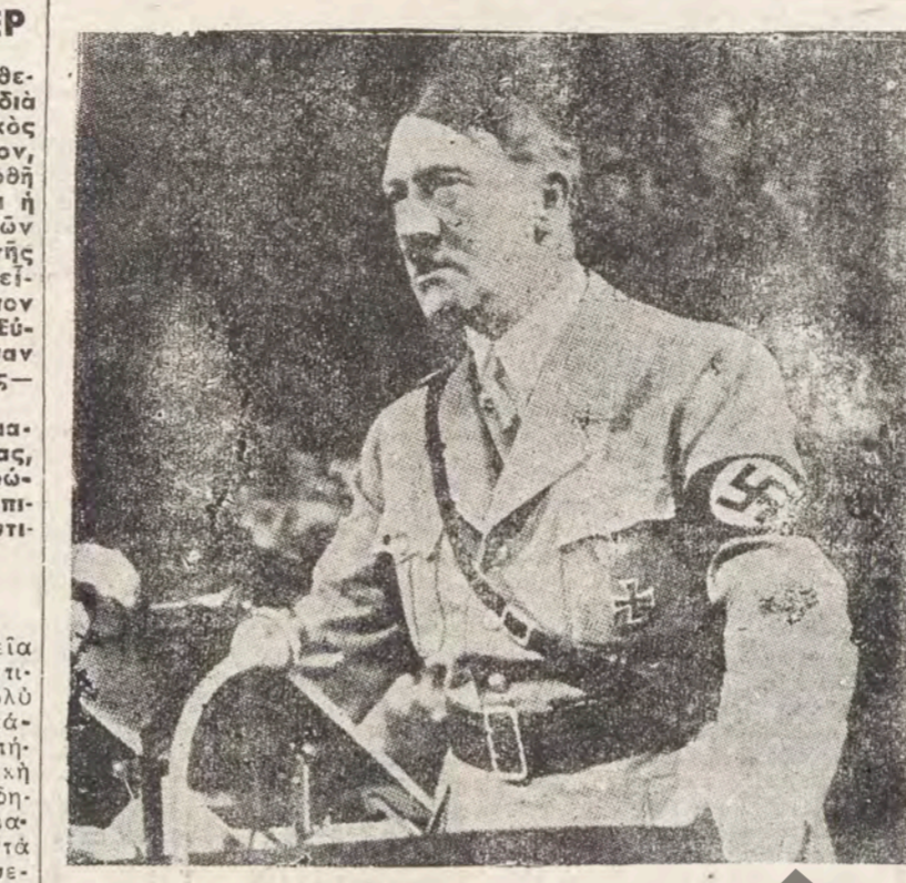
Ο ΦΥΡΕΡ ό νέος λόγος του όλοιο κατέδειξεν ελπίαν την έπισημαστικότητα του γερμανικού λαού...