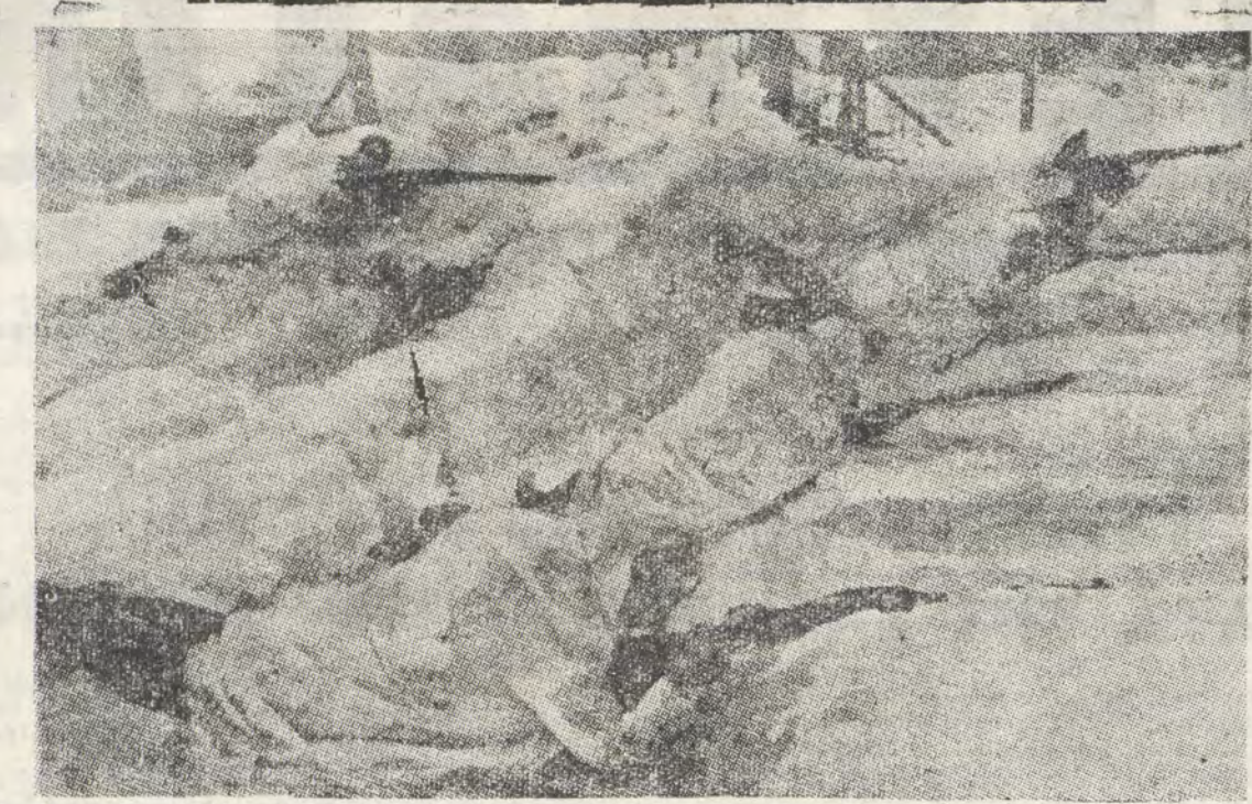
Χημένοι μέσα στα χιόνια οι ήρωικοί Φιλλανδοί στρατιώται άποκρούουν επίθεσιν των Μπλοσεδίκων