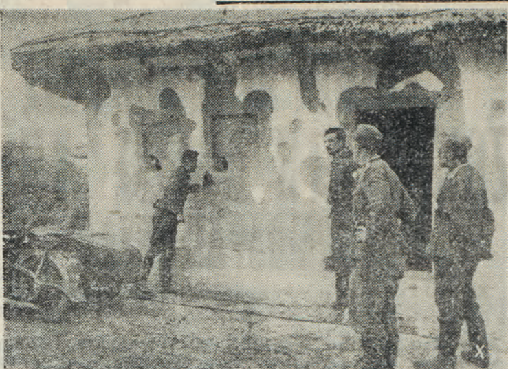
Τὸ σοβιετικὸν αὐτὸ δούρον ἦτο καμουφλαρισμένον εἰς ἀγροίκαν. Τώρα ἔχει αἰγίση, εὐρισκόμενον εἰς γερμανικὰς χεῖρας. Αἱ ἐδαφικὰ δυσχερείαι εἰς τὸ μέγιστον εἶναι ἐνίοτε πολὺ μεγάλαι. Ἐπιβάλλουν ἰδιαιτέρως κόπον εἰς τοὺς ἀκαμάτους Γερμανοὺς πεζοὺς.

Καὶ σήμερον ἡ γερμανικὴ προσπάθεια καὶ ἡ θέλησις, ἡ μὴ ἀναγνώριση οὐδὲν ἐμπόδιον, ἀπεκτέθησε καὶ πάλιν ἰσχυρὰ γεωργικὴν τάξιν εἰς τὴν καταστραφέναν καὶ ἐρείπειωθεσαν ὑπὸ τῶν μολοσεβικῶν ρωσικῆν γεωργίαν, καταδεικνύουσα εἰς δόξα κληρον τὸν κόπον, ποῖα θαύματα δύναται νὰ ἐπιτελέσῃ καὶ τὴν διαφορὰν αὐτῆς ἀπὸ τῆς μολοσεβικῆς.