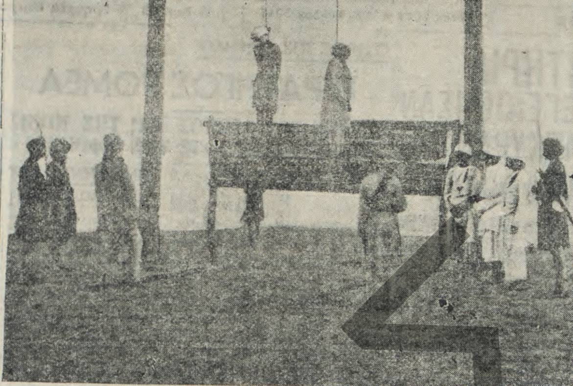
Η άπαισία σκηνή του άπαγχονισμού δύο έθνικοφρόνων 'ινδών εις την περιοχήν της Βομβάης.

Οι όπισθεν ήμών καθήμενοι γάλλοι εργάται ζητούν την γνώμη του Πρεζάν διά την έορτήν των αυτήν και ό συμπάθη; γάλλοι καλλιτέχνης όπανιτ' ός έξής: «Όταν μου έπρότειναν να έπισκεφθώ τούς συμπατριώτας μας τού εργοστασίου αυτού, δεν ήμπορούσα να πιστεύσω ότι ήσαν δυνατόν τέτοιου πράγμα. Η έκπληξις μου είνε ακόμη μεγαλύτερα, καθ' όσον διαπιστώνα, ότι ή ώραία αυτή αίθουσα χρησιμοποιεί ως τραπέζαρια των εργατών.