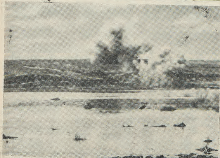
Ένα σοβιετικόν όχηρόν πρό της Σεβαστουπόλεως άνατινίσσεται εις τόν άέρα