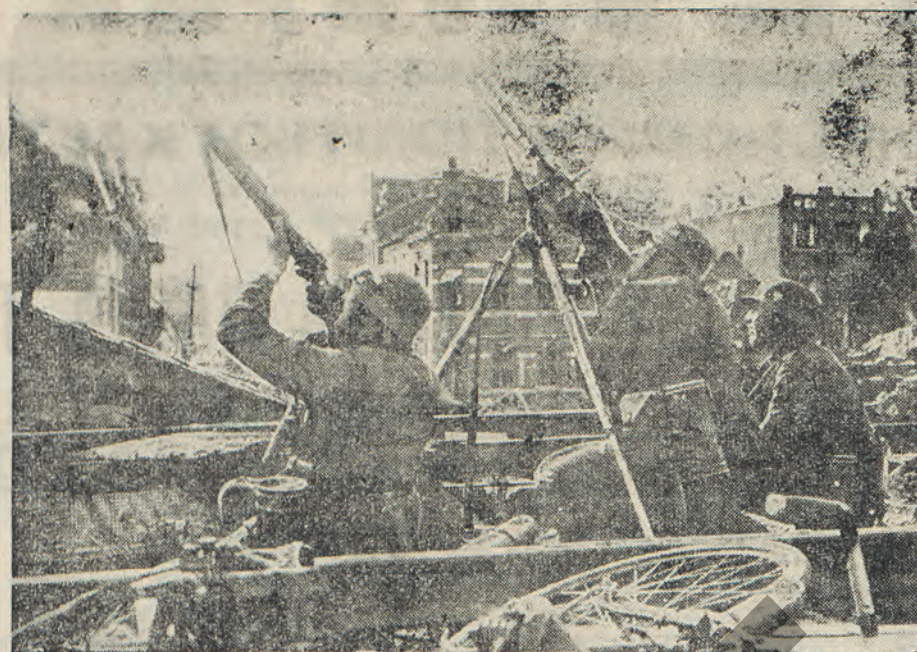
1) Γερμανική πυροβολαρχία επιβιβαζομένη επί μιας σχεδίας εκ καουτσούκ. 2) Γερμανικά αντιαεροπορικά πολυβόλα εν δράσει