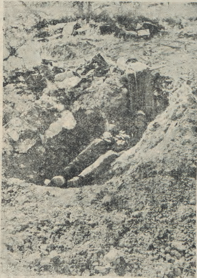
Είς μίαν ανάπαυαν τής μάχης, Γερμανοί στρατιώται ανάπαυοντα μέσα στός σκαμμένους θράχους του οχυρού τής Σεβαστουπόλεως.