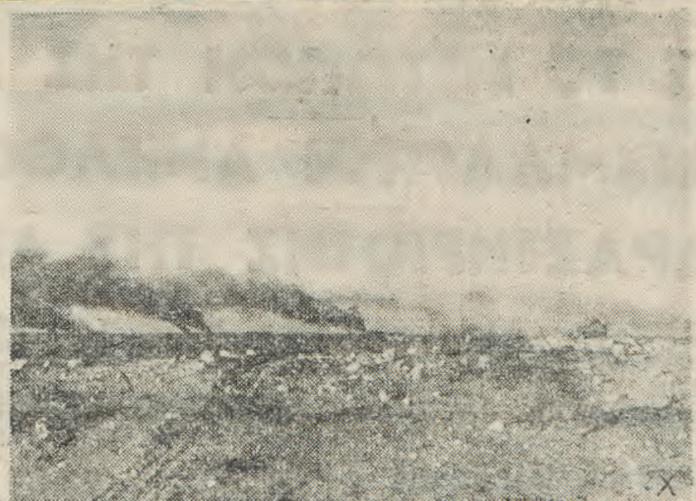
'Ενώ προωδονται προς την θάλασσαν τα γερμανοϊταλικά τμήματα: 'Ενα πεδίων μάχης εις την Β. 'Αφρικήν.