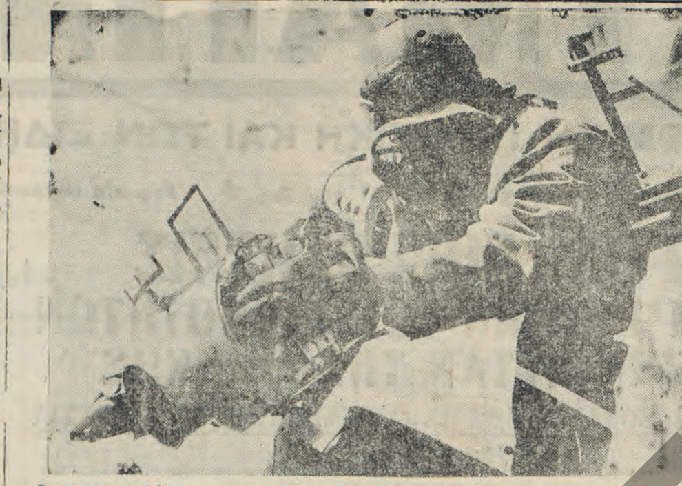
Γερμανός πιλότος παρατηρητής λαμβάνων φωτογραφίαν τών κινήσεων του εχθρού...