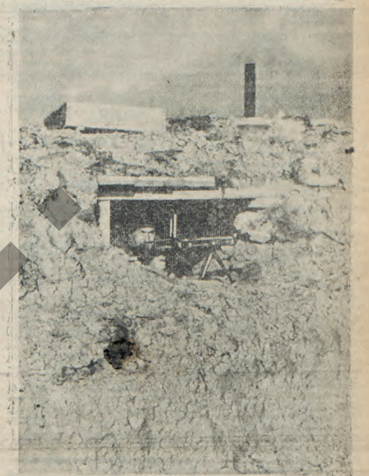
Ἐνα παράκτιον γερμανικὸν οχυρὸν, εἰς τὴν Κριμαίαν. Οἱ μπολεσβικοὶ δὲν δύνανται πλέον νὰ πλησιάσουν τὰς ἀκτὰς αὐτὰς.

ΒΙΣΥ, (Α.Π.)— Ἐν ἀσέσει πρὸς τὴν ἐπικειμένην δευτέραν ἐπέτειον τῆς γερμανο-γαλλικῆς ἀνακοχῆς, τὰ γαλλικὸν ὑπουργεῖον πληροφοριῶν ἐδημοσίευσεν ἀνακοίνωσιν εἰς τὴν ὅποιαν μεταξὺ ἄλλων ἀναφέρονται τὰ ἑξῆς: «Τὸν Ἰούνιον τοῦ 1940, οὐδένα λόγον εἶχομεν νὰ συνεχίσωμεν τὸν πόλεμον. Σήμερον, ἔχομεν ἀκόμη ὀλιγωτέρους λόγους πρὸς τοῦτο, καθόσον ὁ πόλεμος, ἀπὸ εὐρωπαϊκῆς ἀπόψεως, δὲν διεξάγεται πλέον μεταξὺ ἄγγλων καὶ Γερμανίας, ἀλλὰ κατὰ πρῶτον λόγον μεταξὺ τοῦ μπολεσβικισμοῦ καὶ τῆς Ἑυρώπης. Ἐπομένως; σήμερον θὰ ἐμαχόμεθα ἐναντίον τῶν ἰδίων ἡμῶν ζυτικῶν συμφερόντων καὶ ὑπὲρ τοῦ ἔχθρου τοῦ πολιτισμοῦ μας. Ἀγγλο-σαβιετικὴ νίκη θὰ ἐσημειωνε αὐτοκρατορία εἰς τοὺς ἄγγλους καὶ ἡ Γαλλία εἰς τὰ Σοβιέτ.»