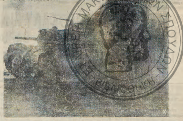
Οι 'Αγγλοι υπέστησαν αήθη ήθεθρον: Βρετανικόν τάγμα περιπολήδεν υπό του γερμανικού αντιταγματικού πυροβολικού.