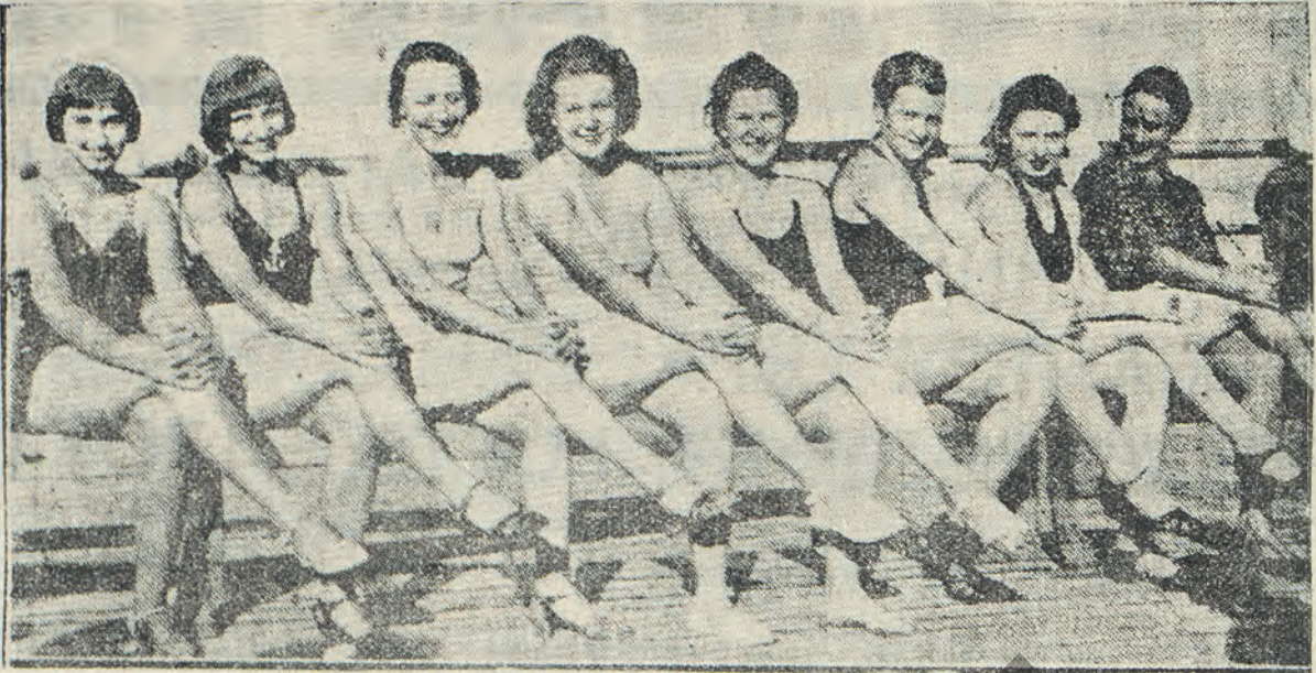
Ἐνα γκρουπ ὠραίων λουζιμένων σὲ μιὰ πλάζ.