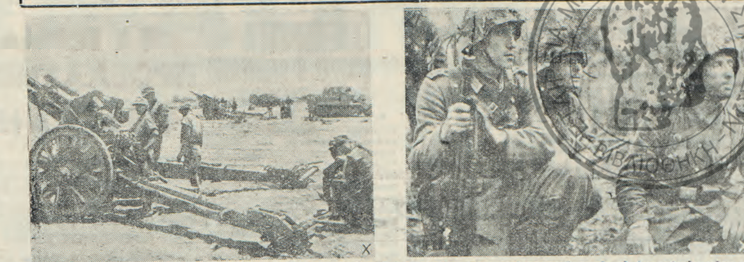
Γερμανικὸν πυροβολικὸν ἐν δρᾶσει εἰς τὴν ἔρημον τῆς Βορείου Ἀφρικῆς.—Γερμανοὶ στρατιῶται εἰς τὸ ἀνατολικὸν μέτωπον ἀναμένον τὴν διαταγὴν τῆς ἐξορμήσεως