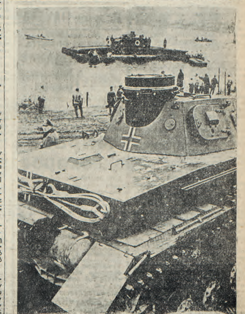
Γερμανικά τάνκς μεταφερόμενα επί σχεδίας