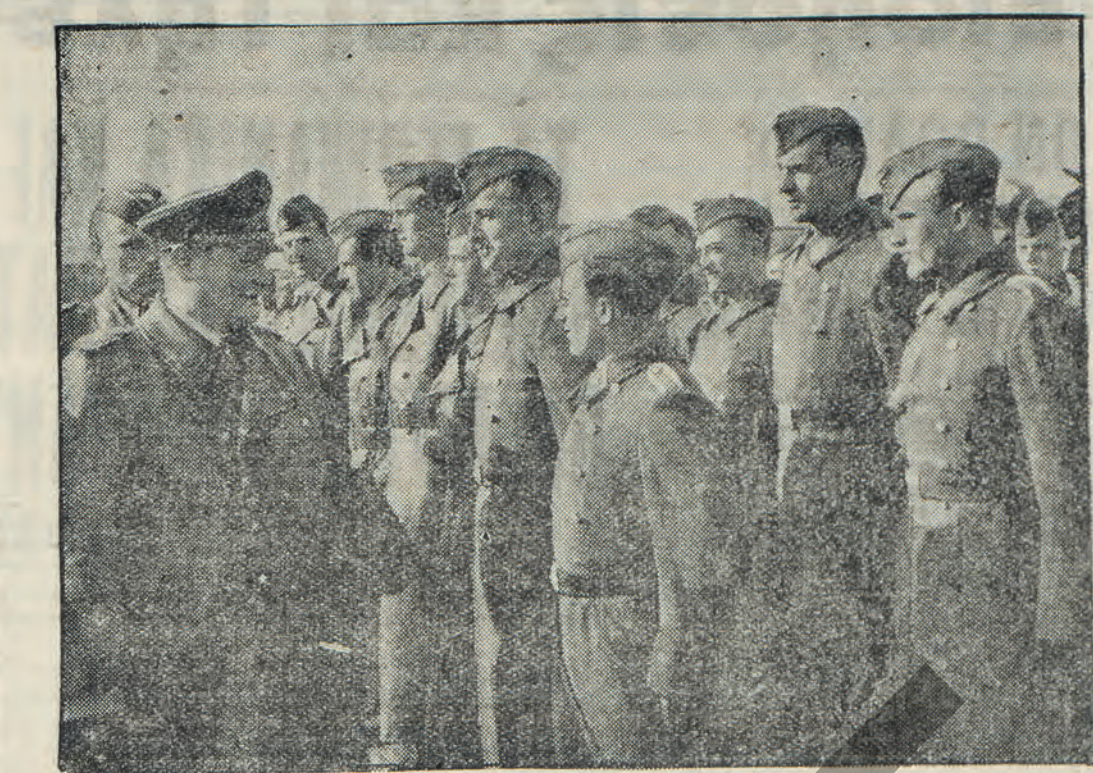
Ὁ στρατάρχης Γκαϊνριγκ ἐπιθεωρῶν ἀεροπόρους.