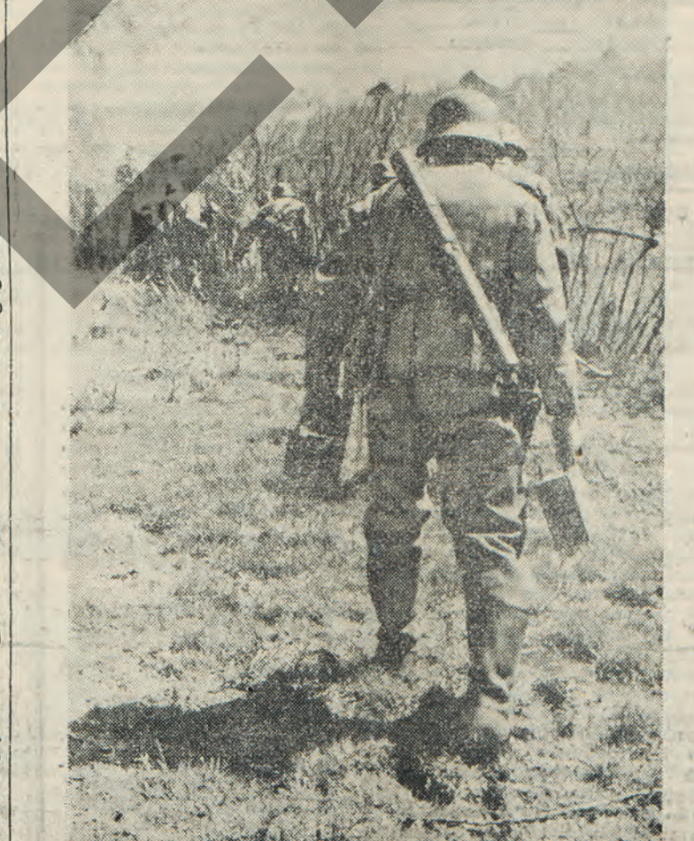
Γερμανοί στρατιώται, εις την πρώτην γραμμήν του πυρός.