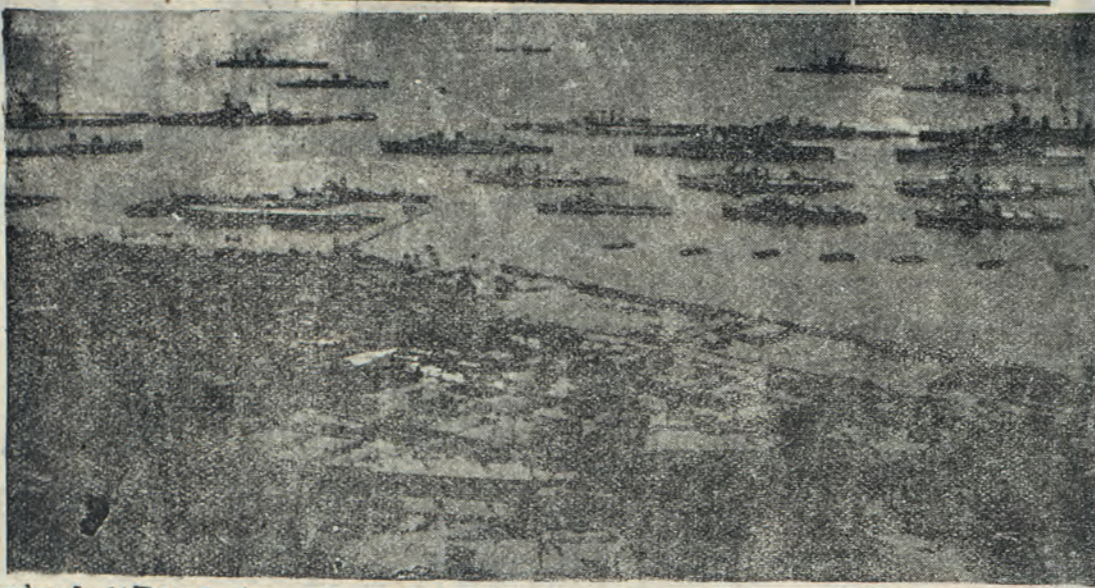
“Ό λιμὴν τῆς Ἀλεξανδρείας, τὸ μοναδικὸν ὀρμητήριον τοῦ ἀγγλικῆς στόλου...