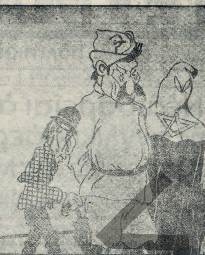
Ο μαρσωνισμός και ο έθραϊσμός προσπαθούν να παρηγορήσουν τον νικητήν της ιστορικής μάχης: σύντροφόν των Ιταλίων.