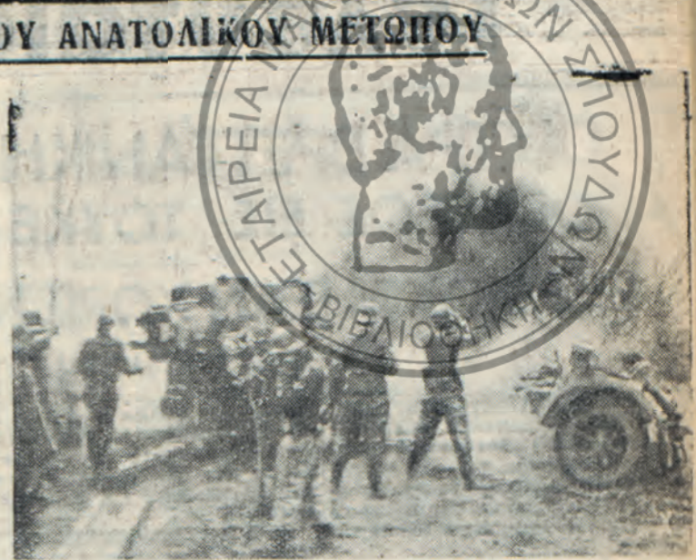
Καταστροφικά πυρά εναντίον τών σοβιετικών τάνκς