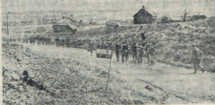
ερμανικών πεζικών εν πορεία εις την περιοχήν του Χαρκόβου