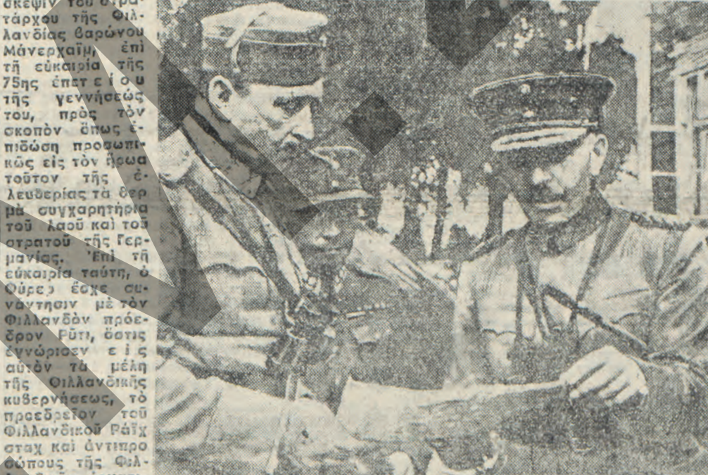
‘Ο στρατάρχης Μανερχάιμ μετά των επιτελών του εις τό μέτωπον

Η ΠΡΟΣΦΩΝΗΣΙΣ ΤΟΥ ΦΥΡΕΡ ΚΑΙ Η ΑΠΑΝΤΗΣΙΣ ΤΟΥ ΘΡΑΙΟΥ ΣΤΡΑΤΑΡΧΟΥ