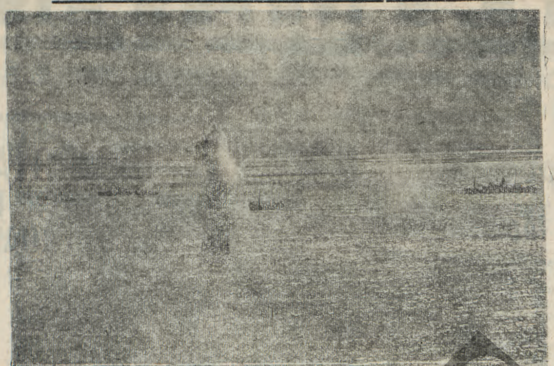
Επίθεσις τής γερμανικής δεροπορίας έναντιον άγγλικής νηοπομής; εις τό δυτικά παράλια τής Αγγλίας. Έν πλοϊον άνεφοδισσού εληθέν υπό γερμανικής ύμβας; άντινύσεται εις τόν άέρα.

ΑΠΟΦΑΣΙΣ "Εχόντες ύπ' όφιν τόν Ν. 4393 και τό όπό 27/11/29 Ν. Δ. «περί καθ. άρμ. Γεν. Διτών» ώς και τό γεγονός; ότι ή παρατηρουμένη συσώρευσις και διασπορά σκουπιδιών εις τό καταστήματα, οικίας και ελευθέριους χώρους αποτελούν κίνδυνον έκρήξεως επιδημικών νόσων: Αποφασίζομεν: "Όπως τούς μη συμμορφούμενους πρός τας ισχυούσας "Υγειονομικές και Αστυνομικές διατάξεις τας συναφείς με τήν καθαριότητα, εγκλείομεν εις τό Στρατόπεδον Συγκεντρώσεως τής όπλης προτάσι των οικιών Αστυνομικών και Υγειονομικών. (Έκ τής Γεν. Διοικήσεως Μακεδονίας)