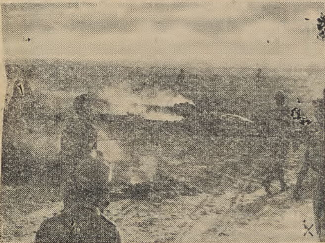
1) Ένα αγγλικόν καταδιωκτικόν, από τα αμέτρητα που καταρρίπτονται καί πυρπολούνται εις τὸ ἔδαφος.