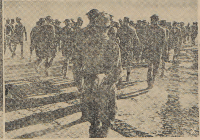
3) Κατὰ λόγους παραδίδονται οἱ Βρεττανοὶ ἀπὸ τοὺς ὁποίους εἶχεν ἀφαιρεθῆ κάθε δυνατότης ὑποχωρήσεως.