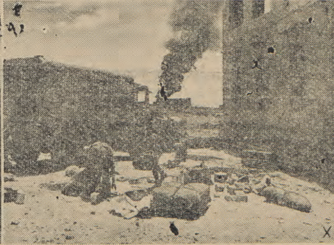
2) Με μεγάλα φορτηγά αυτοκίνητα μεταφέρεται τὸ ἔγκταλεφεθὲν ἀπὸ τοὺς Ἀγγλους ὄλικόν.