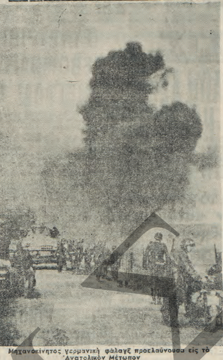
Μηχανοκίνητος γερμανική φάλαγγ προελαύνουσα εις τὸ Ἀνατολικὸν Μέτωπον