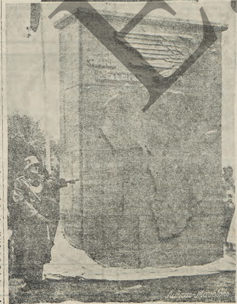
Τὸ Μνημεῖον των 'Αποικίων εις τὸ Βερολίνον