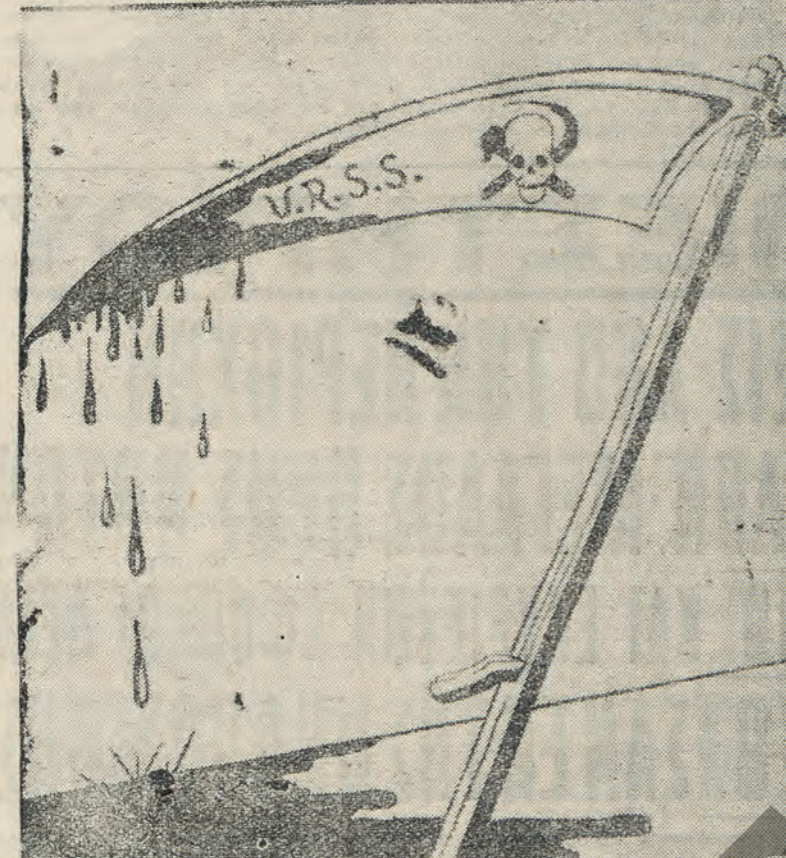
Τὸ «λάβαρον» ὑπὸ τὸ ὁποῖον διενεργήσαν νὰ ὑπαγάγουν τὴν ἡρῶνην καὶ τὸν πολιτισμόν τῆς αἰ νοσηροὶ ἐγκράφοι τοῦ Γαῶρτσιλ καὶ τοῦ Ρουσσέιλ.

Ἡ οὐγκομὴ τῆς Ρουμανίας π. χ. ἀνήλθεν εἰς 2,45 ἐκ. τ. ἀπὸ 1,08, ἐνὸς τῆς Ἰσπανίας εἰς 2,95 ἀπὸ 0,8 ἐκατ. τ. Ἄλλὰ πρωταρχικόν καὶ ἀπαραίτητον τυχεῖται νὰ ἀποκατασταθῶν αἱ ἐκ τῶν πολέμου ἐπελθούσα ζημίαι καὶ βλάβαι, αἱ ὁποιαί μεγίστην ἐπιβάρυνσιν ἐπέκεινται ἐπὶ τῶν Μπο-