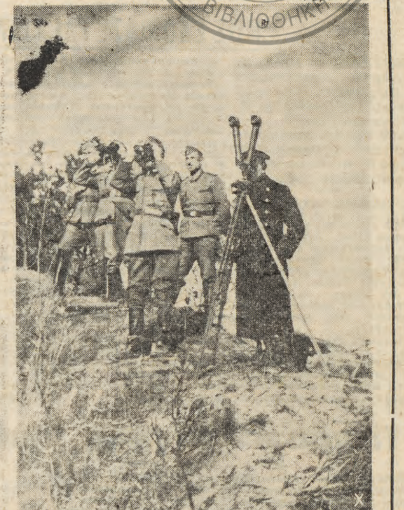
1) Τά «αοτικά» επιτίθενται: Βόμβαι μεγίστου βάρους πλήττου τας θέσεις τών μολοσεβίκων. 2) Η άκοίμητος γερονακή φρουρά εϊς τας άκτάς Γερμανού άξιωματικού εϊς τήν παρατηρητήριον τών, παρακολουθού τήν άποτελεσματικότητα τής βολής πυροβολικού.