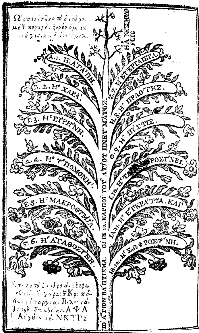
Ευλογαφία ἀπὸ τὴν ἴδια ἔκδοσι.