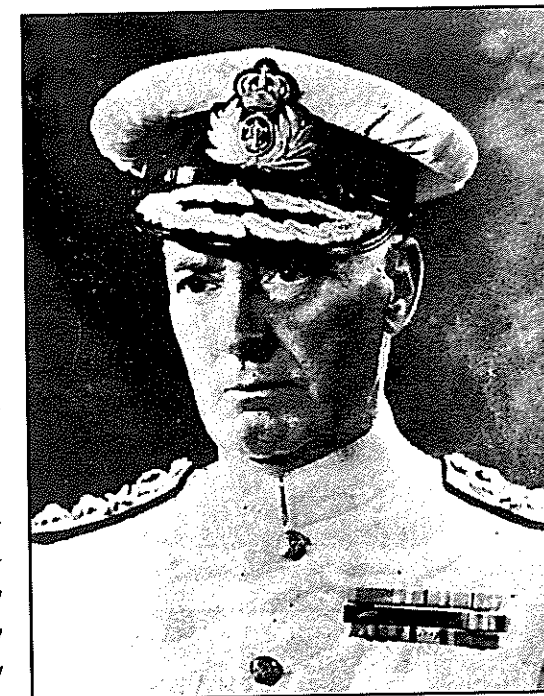
Ο Ναύαρχος Ιωάννης Δεμέστιχας (Νικηφόρος)

Εκεί (στο προξενείο) ήτο ο Δεμέστιχας. Εδώ θα ομιλήσει ένας Δεμέστιχας, σ' αυτόν τον κύκλο. Ήταν τότε σημαιοφόρος, του ναυτικού. Όταν το 1919 με την συνθήκη των Σεβρών η Ελλάς έφρασε έξω από την Κωνσταντινούπολη, το θωρηκτό Αβέρωφ είχε διοικητήν τον τότε σημαιοφόρον Δεμέστιχαν. Εναυλώχησε εις τον Κεράτιον κόλπον και στη δεξίωση που έδωσε η Γενική Αρμοστιά προς τιμήν των συμμάχων, έβλεπε ότι ένας Γάλλος ναύαρχος, τον κοίταζε επιμόνως. Κάποια στιγμή τον πλησιάζει και του λέγει ότι πολύ με κοιτάτε.