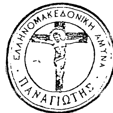
Σφραγίδα Παναγιώτη Παπατζανατέα

Τον Ιανουάριο του 1906 αποφασίστηκε από το Κέντρο της Θεσσαλονίκης να καταταγεί ο Παπατζανατέας με οκτώ άνδρες στην Λίμνη των Γιαννιτσών, ως υπαρχηγός του σώματος του ανθυπολοχαγού Μιχαήλ Αναγνωστάκου (Καπετάν Ματαπά). Αφού έγιναν οι προετοιμασίες και έλαβε οδηγίες από τον Λάμπρο Κορομηλά, ο οποίος βρισκόταν τότε στην Αθήνα, αναχώρησε με ένοπλο σώμα οκτώ ανδρών στις 29 Φεβρουαρίου για την Λάρισα, με προορισμό το