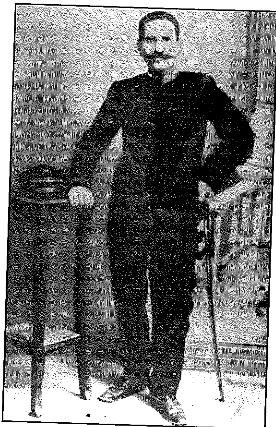
Παναγιώτης Παπατζανατέας (Καπετάν Παναγιώτης)

Ένας μεγάλος εθνικός ήρωας υπήρξε και ο Μακεδονομάχος Καπετάν Παναγιώτης Παπατζανατέας, από την Καρδαμύλη της Μάνης. Ως άνθρωπος ήταν έντιμος, ανιδιοτελής και σεμνός, και ως αγωνιστής θαρραλέος, αποφασιστικός και οξυδερκής πολεμιστής, του οποίου η δράση έκρινε την έκβαση του αγώνα στην Λίμνη των Γιαννιτσών. Ο Παναγιώτης Παπατζανατέας ήταν επιλοχίας Υλικού του Ελληνικού Στρατού. Τον Μάρτιο του 1905 ενημερώθηκε από τον