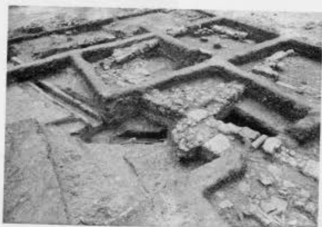
Αιγές. 1. Άποψη της ανασκαφής από τα βόρεια. Διακρίνεται ο πώρινος αγωγός Α1, το κτίριο ΚΙ και το ΚΙΙΙ με το τριπύλιον. 2. Αγωγός Α1 και κτίρια ΚΙ και ΚΙΙΙ από τα βόρεια. 3. Αγωγός Α1, αγωγός Α2 και κτίριο ΚΙΙ από τα βορειοδυτικά.