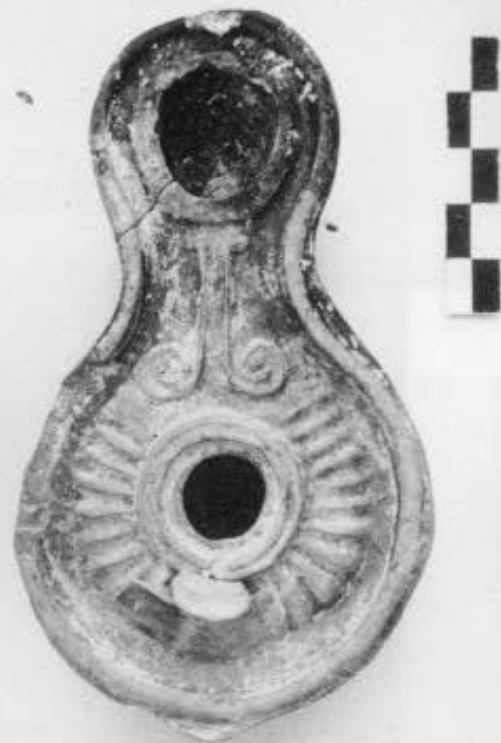
9. Κτίριο ΚΙΙΙ, Αtrium, ανασκαφή 1986. 10. Δύο λυχνάρια που βρέθηκαν στο στρώμα καταστροφής του ΚΙΙΙ. 11. «Στυλοβάτης» της στοάς ΚΙΥ και αγωγός Α2.