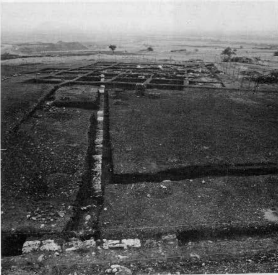
7. Τα κτίρια KIV και KII από τα δυτικά. 8. Το κτίριο KIV από τα νότια.