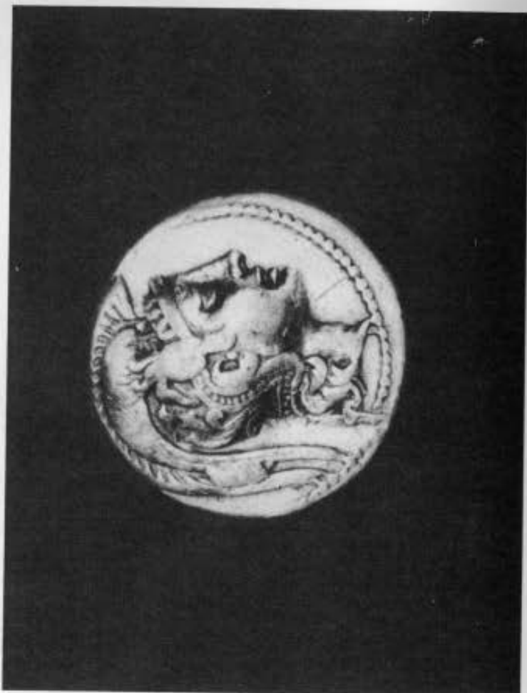
3. Αργυρό αθηναϊκό τετράδραχμο των ΜΕΝΕΔ-ΕΠΙΓΕΝΟ. α. Εμπροσθότυπος. β. Οπισθότυπος. 4. Αργυρό αθηναϊκό