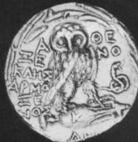
5. Αργυρό αθηναϊκό τετράδραχμο των ΑΡΟΠΟΣ-ΜΝΑΣΑΓΟ. α. Εμπροσθότυπος. β. Οπισθότυπος. 6. Αργυρό αθηναϊκό τετράδραχμο των ΞΕΝΟΚΛΗΣ-ΑΡΜΟΞΕΕΝΟΣ. α. Εμπροσθότυπος. β. Οπισθότυπος.