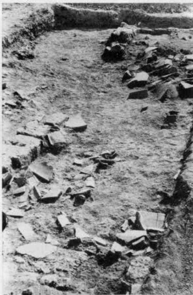
1. Αγορά Πέλλας. Δυτική στοά. Τομή θησαυρού αθηναϊκών τετραδράχμων. 2. Στρώμα καταστροφής του χώρου όπου βρέθηκε ο θησαυρός.