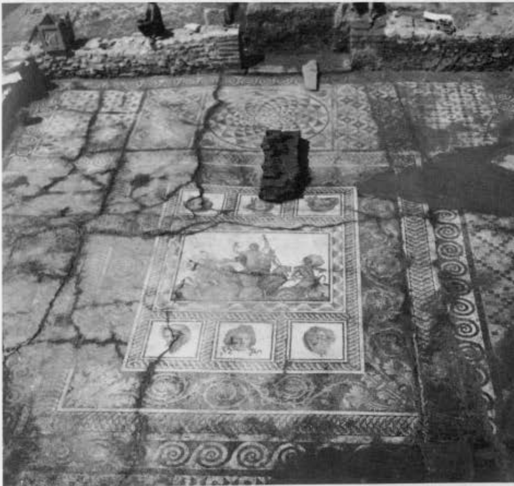
1. Δίον. Ανατολικός Τομέας. Το μεγάλο αίθριο, το λουτρό και τα εργαστήρια. 2. Η αίθουσα των συμποσίων.