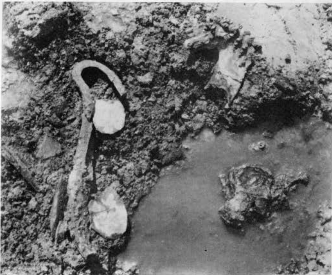
4. Δίον. Αίθουσα συμποσίων. Μάσκα Σατύρου από το ψηφιδωτό δάπεδο. 5. Χάλκινα εξαρτήματα της κλίνης.