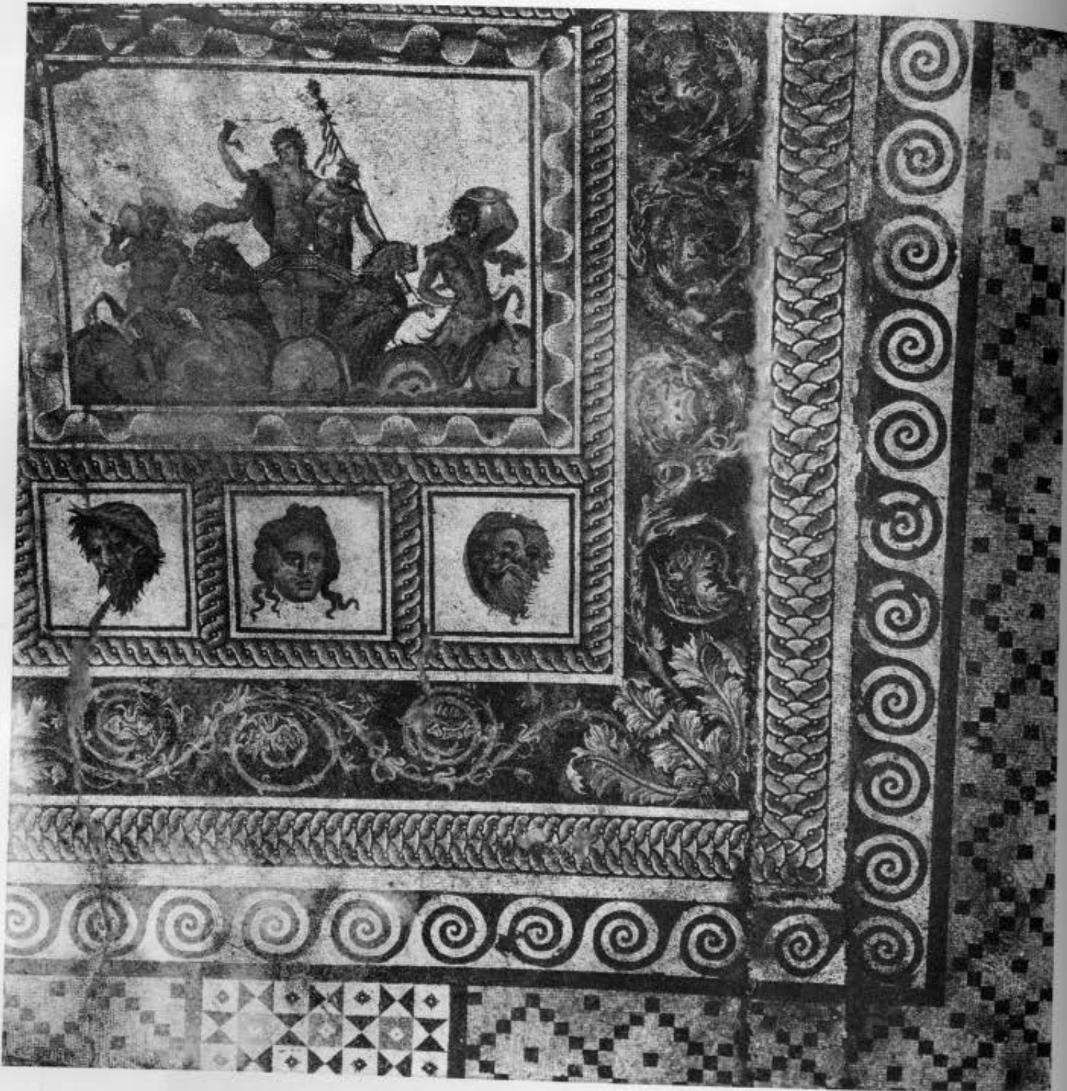
3. Δίον. Αίθουσα συμποσίων. Τμήμα του ψηφιδωτού δαπέδου.