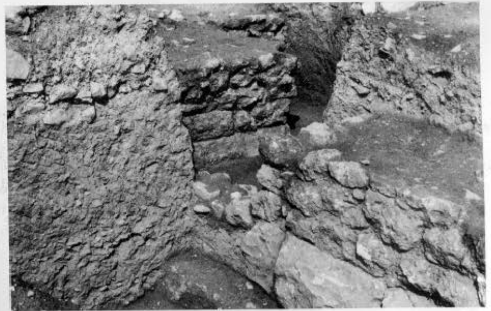
1. Δείον. Εξωτερική όψη του βόρειου τείχους (πρώτος δόμος της πρώιμης ελληνιστικής φάσης, ακανόνιστοι λίθοι και υψηλότερα γωνιασμένοι λίθοι της υστερορωμαϊκής περιόδου). 2. Λεπτομέρεια του βόρειου τείχους (τοιχοβάτης, δόμος της πρώιμης ελληνιστικής φάσης, ακανόνιστοι λίθοι). 3. Εσωτερική όψη πύργου του βόρειου τείχους (τοιχοβάτης, πρώτος δόμος, ακανόνιστοι λίθοι). 4. Η είσοδος του πύργου της εικ. 3, που κλείστηκε στην εποχή του Φιλίππου Ε'.