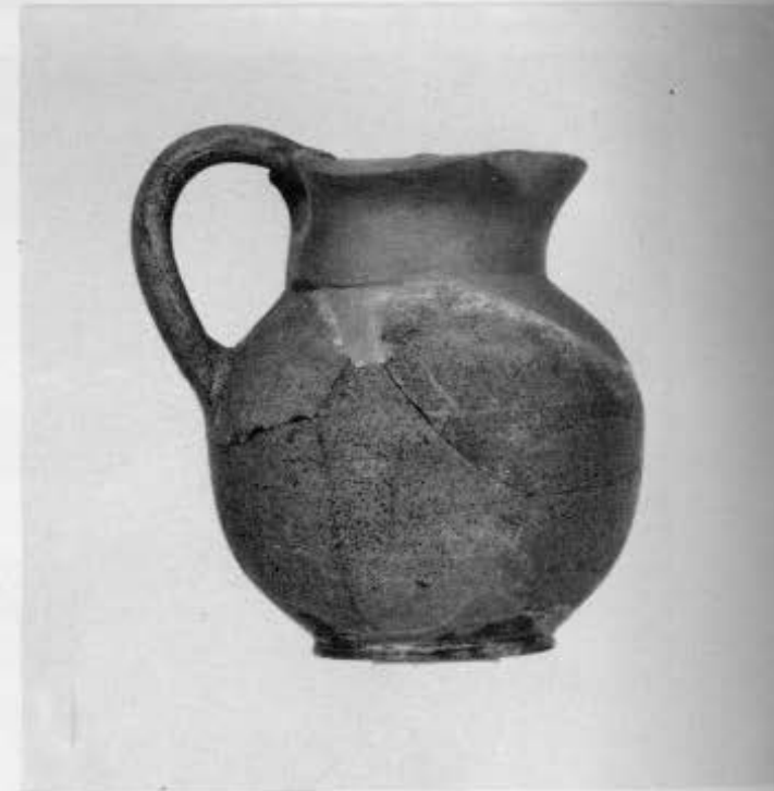
3-6. Τομή Α. Αγγεία από τους «αποθέτες» Α και Γ.