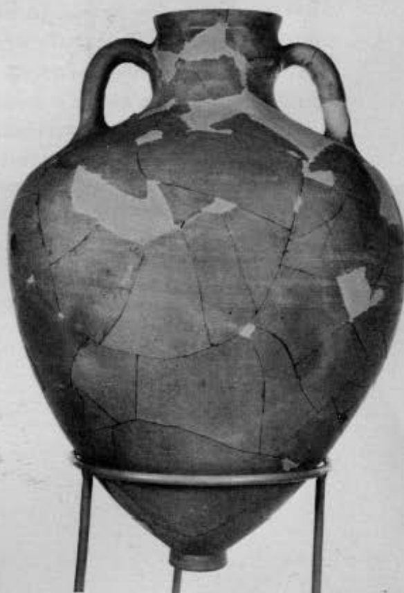
7. Τομή Α. Υδρία από τον «αποθέτη» Γ. 8. Τομή Β. Ο λέβης από τον «αποθέτη» Α. 9, 10. Τομή Β. Οξυπύθμενοι αμφορείς από τον «αποθέτη» Α.