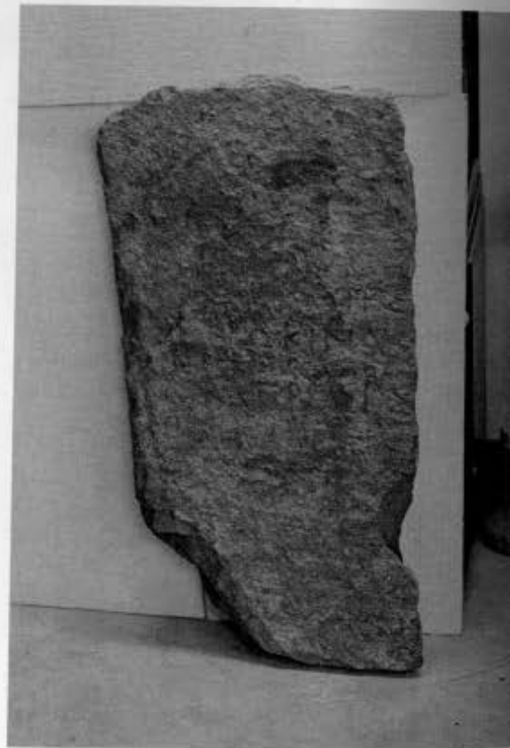
11, 12. Τομή Β. Οξυπύθμενοι αμφορείς από τον «αποθέτη» Α. 13. Τμήμα αγγείου με εγχάρακτη επιγραφή. 14. Η επιτύμβια στήλη του Σωσικράτη από το Φάγγητα.