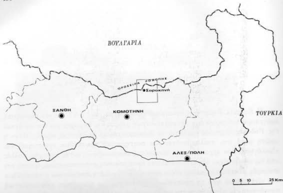
Σχ. 1. Γενικός χάρτης της Θράκης όπου σημειώνεται η περιοχή της έρευνας.

σκεύη, ξύλινα εργαλεία— και με παραγωγικές διαδικασίες —εκμετάλλευση του χώρου, χρήση της γης— είτε αποτέλούσαν παρατηρήσεις πάνω σε θέματα κοινωνικής οργάνωσης και παραγωγής. Ειδικότερα συγκεντρώθηκαν στοιχεία α) για την οικονομία της τυπικής αυτής ορεινής κοινότητας σε σχέση με τη κοινωνική της οργάνωση. Διαπιστώθηκε ότι πρόκειται για μια αυτάρκη κλειστή οικονομία που βασίζεται σε προκαπιταλιστικές μορφές οργάνωσης και διαμορφώνει μια ισοκατανομημένη κοινωνική μονάδα (egalitarian society) (Ευστρατίου 1986), β) για την οργάνωση της οικογένειας (Τσιμπιρίδου 1987), το ρόλο της γυναίκας στην παραγωγή, τον καταμερισμό της εργασίας, τις γαμήλιες συνήθειες οι οποίες πάντα συνδέονται με ζητήματα χρήσης της γης (Ευστρατίου 1987), και τέλος στοιχεία που σχετίζονται με την παραγωγή και τη διάδοση συγκεκριμένων κεραμικών ειδών.