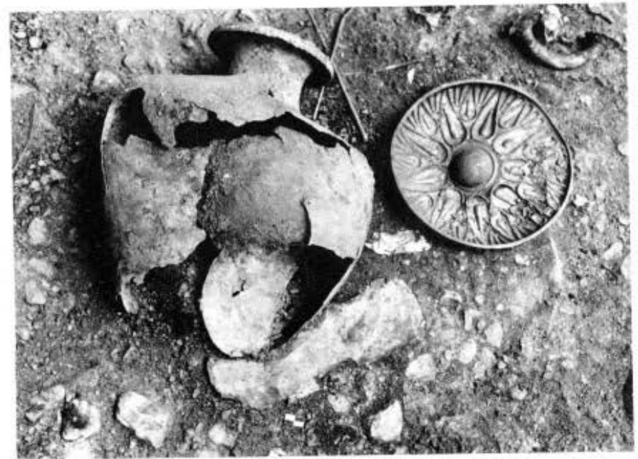
1. Βεργίνα. Λακκοειδής τάφος υστεροαρχαϊκών χρόνων. 2. Λεπτομέρεια. Κτερίσματα που κοσμούσαν το κεφάλι και το σώμα της νεκρής. 3. Λεπτομέρεια. Μπρούντζινη υδρία, επίχρυση ομφαλωτή φιάλη και ασημένια ελάσματα από τα υποδήματα της νεκρής.