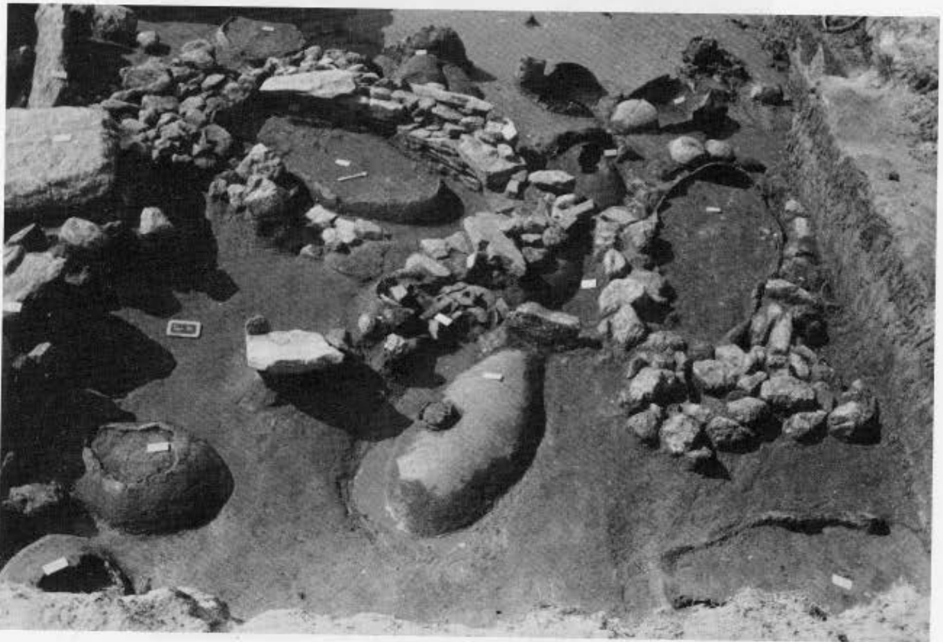
4. Ενταφιασμός σε πιθάρι. Ταφή 15. 5. Πιθάρια σε περιβόλους-θήκες (τομή 16).