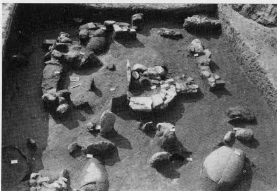
1. Νικήτη, Αη-Γιάννης. Τμήμα της θεμελίωσης κτιρίου κλασικών χρόνων. 2. Άποψη του νεκροταφείου της Εποχής Σιδήρου (τομή 16). 3. Αψιδωτή λίθινη κατασκευή πλαισιωμένη από καύσεις σε άβαφα αγγεία τοποθετημένα ανάμεσα σε πέτρες.