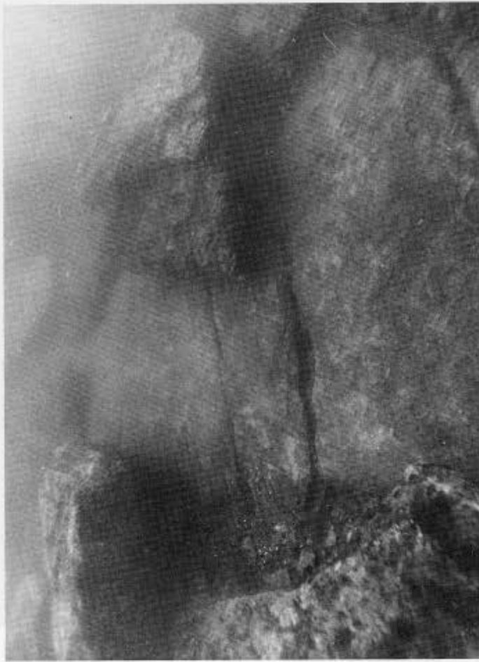
1, 2. Λιμάνι της Θάσου. Δόμοι του αρχαϊκού μώλου. 3. Μαρμαρίνος λίθος με γόμφους του αρχαϊκού μώλου. 4. Σχιστόλιθος του αρχαϊκού μώλου.