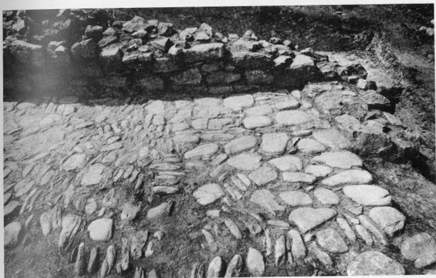
7, 8. Δεξαμενή ή άνδρηρο στρωμένο με βότσαλα.