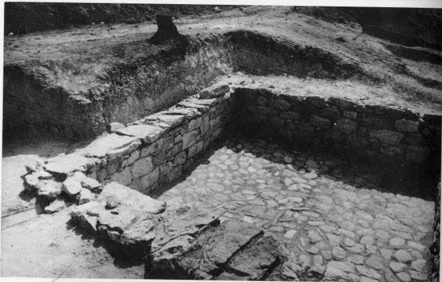
5. Εργαστήριο κεραμικής στο Φαρί: κλίβανος. 6. Η δεύτερη δεξαμενή.