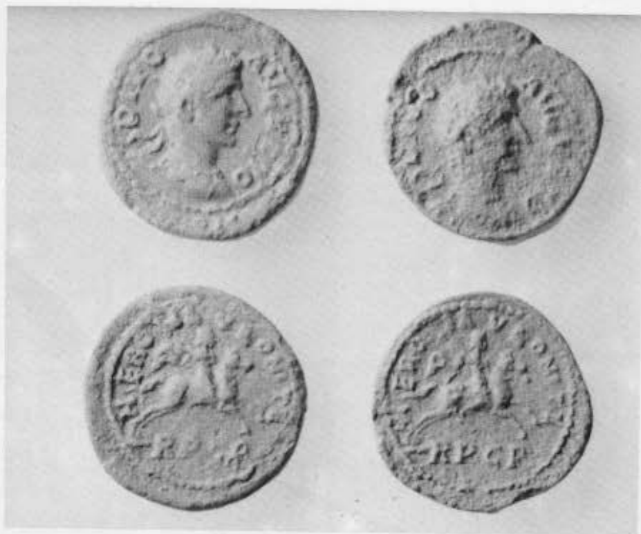
9. Εργαστήριο στο Φαρί: τάφος. 10. Νόμισμα των Φιλίππων: ο Ήρωας Αυλωνίτης.