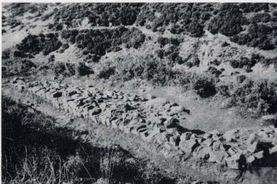
1. Ληνός Ροδόπης. Το ΝΔ τμήμα του κτιρίου στην κορυφή του λόφου. 2. Μολύβδινα βλήματα σφενδόνης από το κτίριο στην κορυφή του λόφου. 3. Τμήμα περιβόλου στην ανατολική πλαγιά.