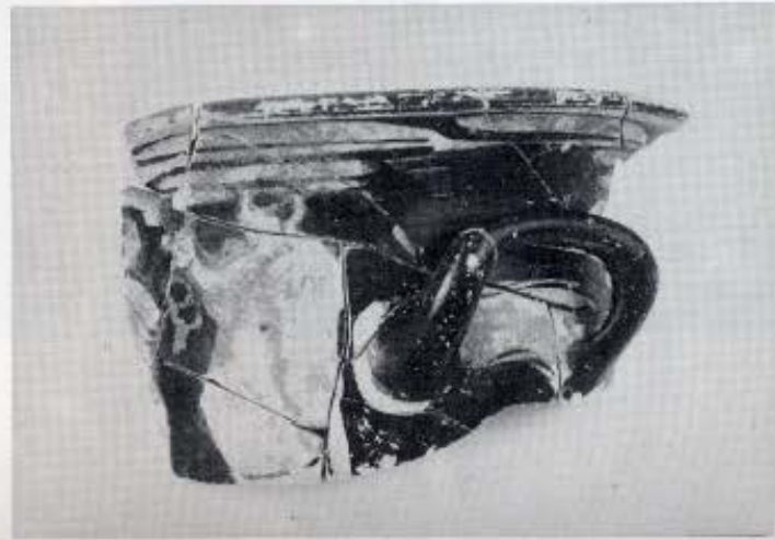
4. Κτίσμα στη νότια πλαγιά. 5. Ορθογώνιο κτίσμα στη νότια πλαγιά. 6. Τμήματα αγγείων από τα κτίσματα της νότιας πλαγιάς. 7. Τμήμα ερυθρόμορφου κρατήρα από το κτίριο στην κορυφή του λόφου.