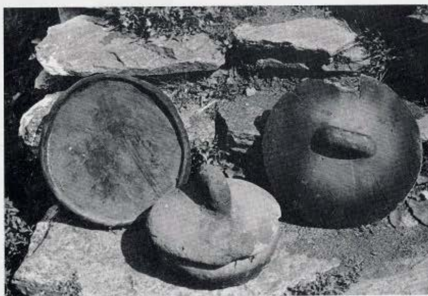
4. Η αρχή της αποκάλυψης του εσωτερικού τοίχου. Διακρίνεται η μικρή επίχωση της θέσης. 5. Ανασκαφή της σύγχρονης κατασκευής στα ανατολικά του λόφου Τσούκα. Διακρίνεται η χρησιμοποίηση του επικλινούς φυσικού βράχου για τη θεμελίωση του κτίσματος. 6. Η πομάκινη πόνιτσε.