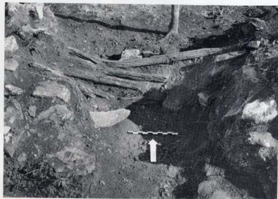
1. Τμήμα του εξωτερικού περιβόλου της θέσης Τσούκα. 2. Κατασκευές εφαιπτόμενες στον εξωτερικό περίβολο κατά μήκος της βόρειας πλευράς του λόφου. 3. Λείψανα ξύλινης κατασκευής η οποία έκλεινε μία από τις εισόδους που εντοπίστηκαν κατά μήκος του περιβόλου.