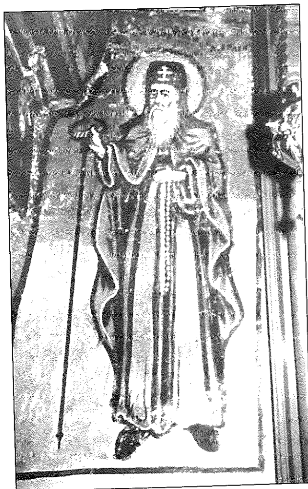
Εικ. 5. Αρχάγγελος. Ιερά μονή Αρχαγγέλου Μιχαήλ. Ο όσιος Ιλαρίων επίσκοπος Μογλενών (1888).

αφιερωματική μικρογράμματη επιγραφή: η δεησις του δούλου του θεου: ρήστο. Στουκ [... Τα ίδια γνωρίσματα χαρακτηρίζουν και την εικόνα του αγίου Γεωργίου δρακοντοκτόνου.