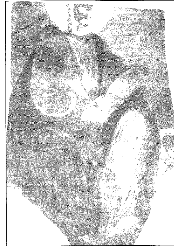
Εικ. 8. Λιπαρό. Ιερός ναός Αγίου Ιωάννη Προδρόμου. Ο ευαγγελιστής Μάρκος (β' μισό 19ου αι.)

Στην πεδιάδα των Γιαννιτσών ο ναός του Αγίου Ιωάννη του Προδρόμου στο Λιπαρό κάτω από τις νεώτερες επεμβάσεις διαφύλαξε δύο φάσεις διακόσμησης. Τα υπάρχοντα στοιχεία του τον ανάγουν στο πέρασμα από τον 18ο στον 19ο αι. 26 , αλλά οι μνήμες και στοιχεία από γραπτές πηγές μάς πηγαίνουν μέχρι και την παλαιολόγεια περίοδο. Το Λιπαρό αναφέρεται σε έγγραφο με το όνομα Λιπαρίνο στα 1357, οπότε ο Στέφανος Ούρσεις (τσάρος 1355-1371) 27 το επικυρώνει στη χήρα και τον γιο του Πρελιούμπου, σύμφωνα με το βυζαντινό σύστημα της κληροδοτούμενης πατρικής γης 28 . Δεύτερη αναφορά του τουρκοκρατούμενου πλέον Λιπαρού υπάρχει σε έγγραφο του 1481, οπότε ήταν ένας αξιόλογος οικισμός με 210 οικίες. Ανάμνηση του παλιού ονόματος είναι η νεώτερη ονομασία Λιπαρίνο-βο έως το 1926 που μετατρέπεται σε Λιπαρό . Δεν γνωρίζουμε εάν ο οικισμός συστήνεται για πρώτη φορά στην παλαιολόγεια περίοδο ή εάν προϋπήρχε από τα μεσοβυζαντινά χρόνια. Ας αναφέρουμε ότι μέσα στον ναό φυλάγο-