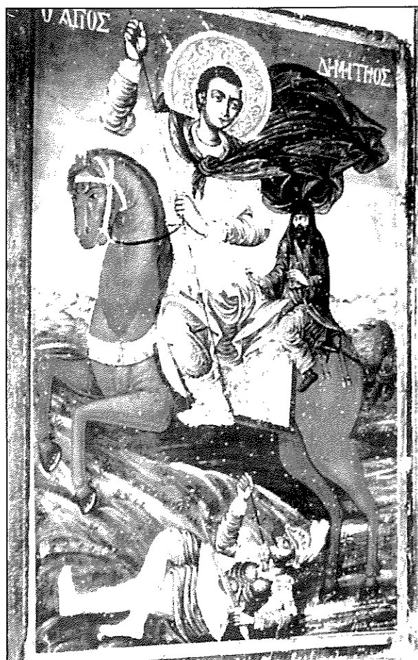
Εικ. 9. Δροσερό. Ιερός ναός Αγίου Γεωργίου. Ο άγιος Δημήτριος έφιππος (1864).