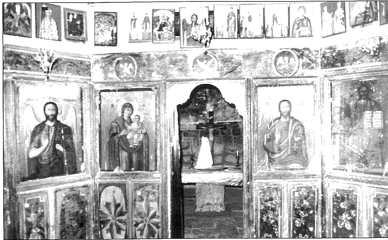
Εικ. 7. Λιπαρό. Ιερός ναός Αγίου Ιωάννη Προδρόμου. Άποψη του γραπτού τέμπλου (18ος-19ος αι.)

με φυσιοκρατικά νεοκλασικιστικά στοιχεία, ενώ β) οι υπόλοιπες συνιστούν την αρχαιότερη και πολυάριθμη ομάδα των εικόνων του Παντοκράτορα, της Οδηγήτριας (εικ. 6), του Προδρόμου, του αγίου Γεωργίου δρακοντοκτόνου, του αγίου Δημητρίου κ.ά. Ξεχωρίζουν για τις αντικλασικές τάσεις που φθάνουν ως την ασχήμια, στοιχεία που απαντούν σε έργα του τέλους του 18ου αι. 25 Ο αγιογράφος δεν έχει ξεφύγει από τη μεταβυζαντινή παράδοση και υιοθετεί ακόμη δυτικούς τρόπους. Λαμβάνοντας υπόψη και τις πληροφορίες για την ανέγερση του ναού, οδηγούμαστε μέσα στην πρώτη δεκαετία του 19ου αι.