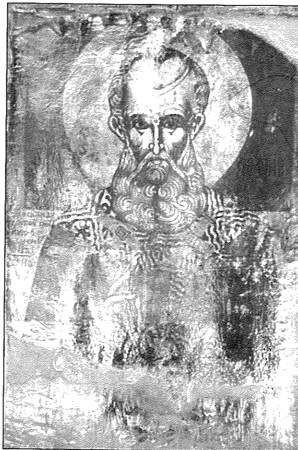
Εικ. 2. Άγρας. Ιερός ναός Αγίου Δημητρίου. Ο άγιος Αθανάσιος (1646).

Πρόκειται για έργα του 17ου με παλαιότερη την εικόνα των αγίων Παρασκευής και Κυριακής, δύο αγίων που τιμώνται ιδιαίτερα στη Μακεδονία και εικονογραφούνται συχνά, καταλαμβάνοντας τιμητική θέση ανάμεσα στις δεσποτικές εικόνες των τέμπλων (εικ. 1). Οι μορφές έχουν χαρακτηριστικά που προσιδιάζουν στη μακεδονική εικονογραφική παράδοση 12 . Η τεχνοτροπία μαρτυρεί υψηλής ποιότητας μακεδονικό εργαστήριο, εφάμιλλο με τα επάνωμα συνεργεία των λινοτοπιτών αγιογράφων. Η εικόνα εντάσσεται στο δεύτερο τέταρτο του 17ου αι. και δείχνει να είναι χέρι προικισμένου αγιογράφου από τη δυτική Μακεδο-