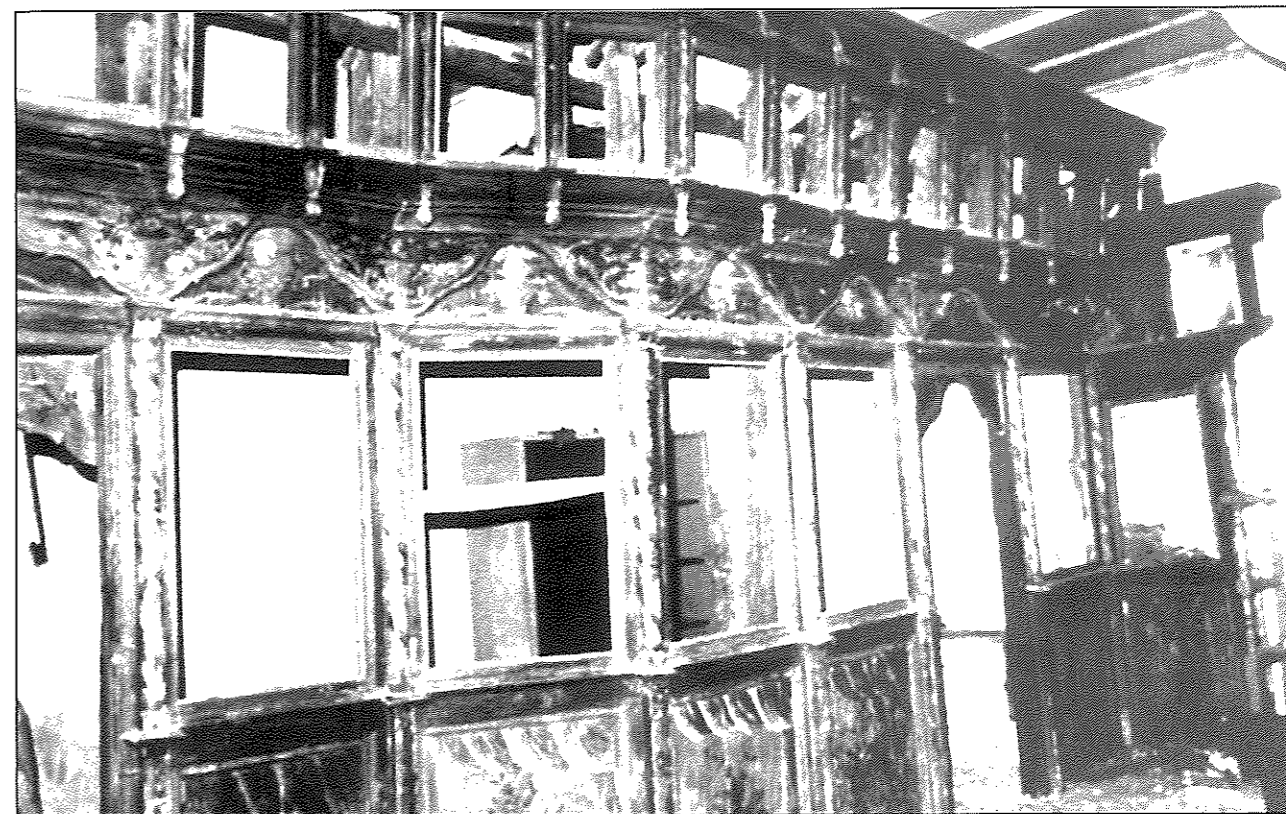
Εικ. 11. Αγροσυκιά. Ιερός ναός Αγίου Αθανασίου. Άποψη του τέμπλου (περ. 1804).

Ο άμβωνας του ναού ανήκει στα λίγα γνωστά μας παραδείγματα του είδους με έγχρωμες ανθρωπόμορφες παραστάσεις, καθώς διακοσμείται με αγγέλους και με χερουβείμ σε