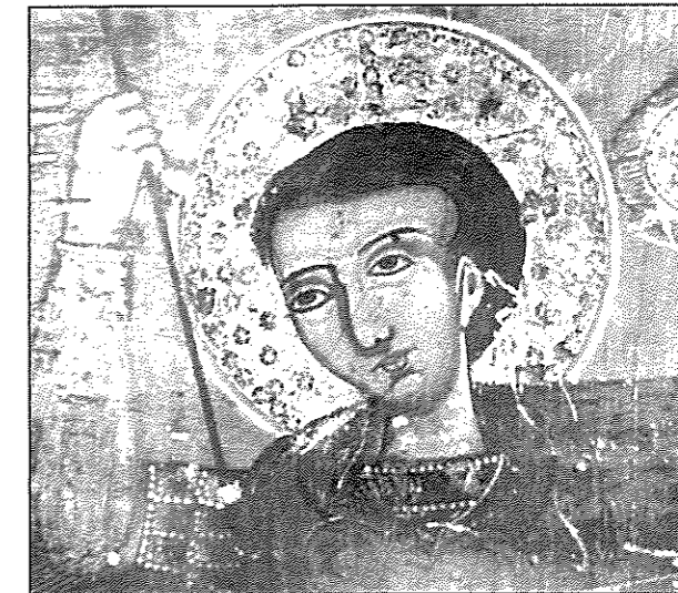
Εικ. 4. Άγρας. Ιερός ναός Αγίου Δημητρίου. Ο άγιος Δημήτριος έφιππος (λεπτομέρεια) (τελευταίο τέταρτο 18ου αι.).

Οι παραπάνω τέσσερις φροητές εικόνες αποτελούν το παλαιότερο σωζόμενο σύνολο μεταβυζαντινών εικόνων της περιοχής, χρονολογούν το τέμπλο που θα κοσμούσαν και