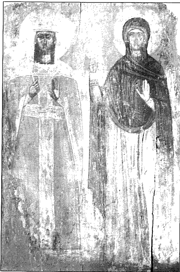
Εικ. 1. Άγρας. Ιερός ναός Αγίου Δημητρίου. Οι αγίες Κυριακή και Παρασκευή (β' τέταρτο 17ου αι.).

οι κάτοικοι επέστρεψαν στο Βλάδοβο σταδιακά από το 1800 έως το 1910 μεταφέροντας τα κειμήλιά τους, τα οποία εναπέθεσαν στον ενοριακό ναό του Αγίου Δημητρίου, ο οποίος κτίστηκε στα 1818 11 .