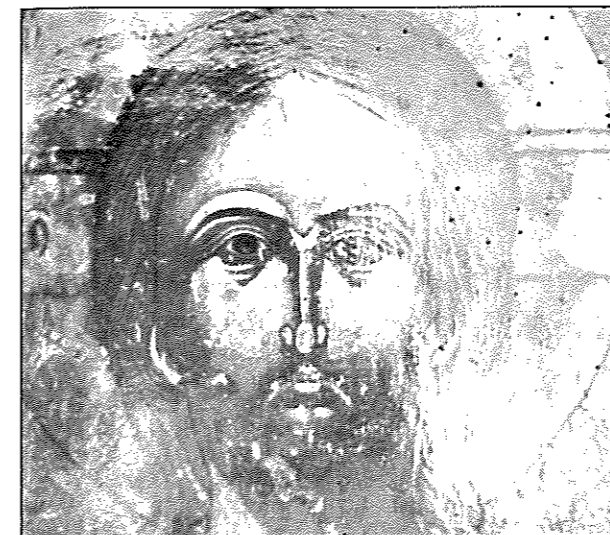
Εικ. 3. Άγρας. Ιερός ναός Αγίου Δημητρίου. Ο Χριστός Παντοκράτωρ (λεπτομέρεια) (1649).

τρία χρόνια μετά την αγιογράφηση της ένας άλλος ζωγράφος θα κοσμήσει και την άλλη όψη της πάλι με τη μορφή του Παντοκράτορα. Οι καλλιτεχνικές δυνατότητές του είναι πιο περιορισμένες, οι μορφές είναι άκαμπτες, τα πρόσωπα έχουν έντονες σκιές στον ανοιχτό προπλάσμο. Στο ύψος των ώμων του Χριστού διαβάζουμε την επιγραφή: Δέσις του δού(λου) σου Δούκα ζρο (=1662) .