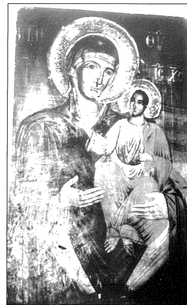
Εικ. 6. Άνω Γαρέφι. Ιερός ναός Κοιμήσεως της Θεοτόκου. Η Οδηγήτρια (πρώτες δεκαετίες 19ου αι.).

εξής) αναφέρεται με το αρχικό του όνομα Τσερνίσοβο ήδη σε πηγές του 1481 και εξής, οπότε ήταν ένας μικρός ημιορεινός οικισμός με 46 οικίες 22 . Στα 1811 κτίζεται η εκκλησία του από 16 οικογένειες του οικισμού με τη συγκατάθεση του μπέη της Καρατζόβας και αφιερώνεται στην Κοίμηση της Θεοτόκου 23 . Πρόκειται για μια μικρή τρίκλιτη βασιλική με νάρθηκα. Στα δυτικά της λειτούργησε περίπου στα τέλη του 19ου αι. ελληνικό σχολείο παρά τη σκληρή βουλγαρική προπαγάνδα στην περιοχή 24 . Το τέμπλο του ναού κοσμείται με εικοσιοκτώ φορητές εικόνες δεσποτικές και επιτυλιού.