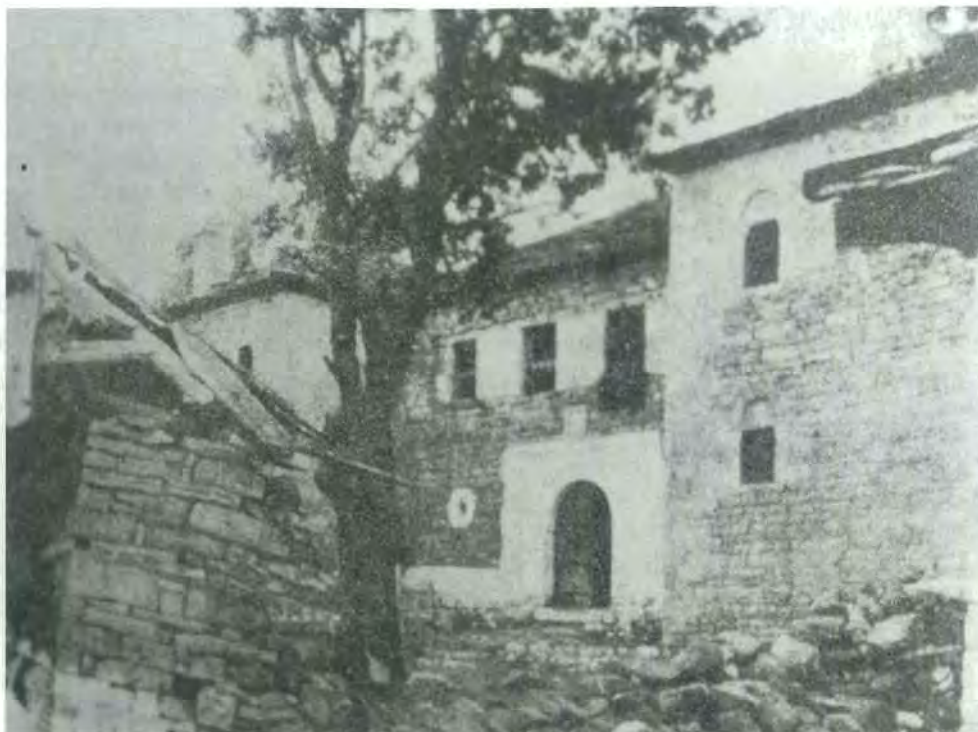
Εικ. 1. Τύπος Α. Κτηνοτροφικό σπίτι με εσοχή: το σπίτι του Παγίτσα στη Σαμαρίνα σε φωτογραφία των Α. Wace - Μ. Thompson (1910), Οι νομάδες των Βαλκανίων , Θεσσαλονίκη 1989, σ. 30.