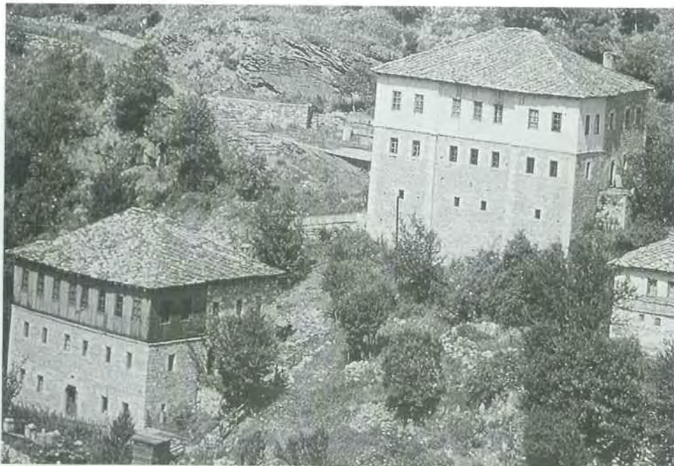
Εικ. 9. Τύπος Δ. Τριώροφα πυργόσπιτα στο Γκαλίσινα (D. St. Ρανιονίς «Γιουγκοσλαβία», Βαλκανική Παραδοσιακή Αρχιτεκτονική, Αθήνα 1993, σ. 202).