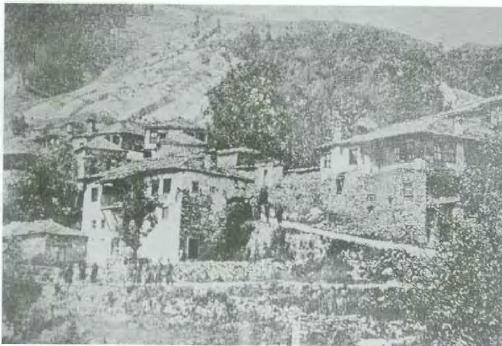
Εικ. 10. Τύπος Ε. Σπίτια στο Μεγάροβο από καρτ-ποστάλ του 1911 (Θ. Καρζή, Οι χαμένες πατρίδες των Ελλήνων, Αθήνα 1979, σ. 209).