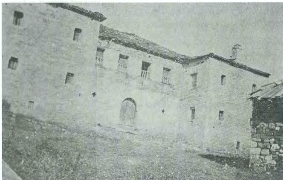
Εικ. 2. Τύπος Α. Το σπίτι του Παγίτσα στη Σαμαρίνα σε φωτογραφία του Απ. Βακαλόπουλου (1936), « Ιστορικά έρευνα εν Σαμαρίνη της Δυτικής Μακεδονίας », Παγκραπία Μακεδονικής Γης , Θεσσαλονίκη 1980, σ. 468.