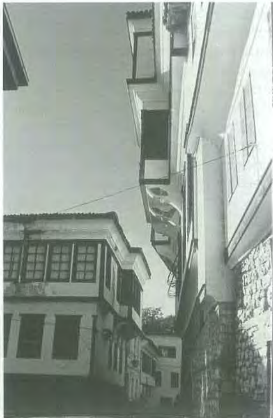
Εικ. 12. Τύπος Ζ. Μακεδονικά αρχοντικά με προεξοχές στην Αχρίδα. Δεξιά το αρχοντικό Ρόμψη. Φωτογραφία του συγγραφέα (1986).