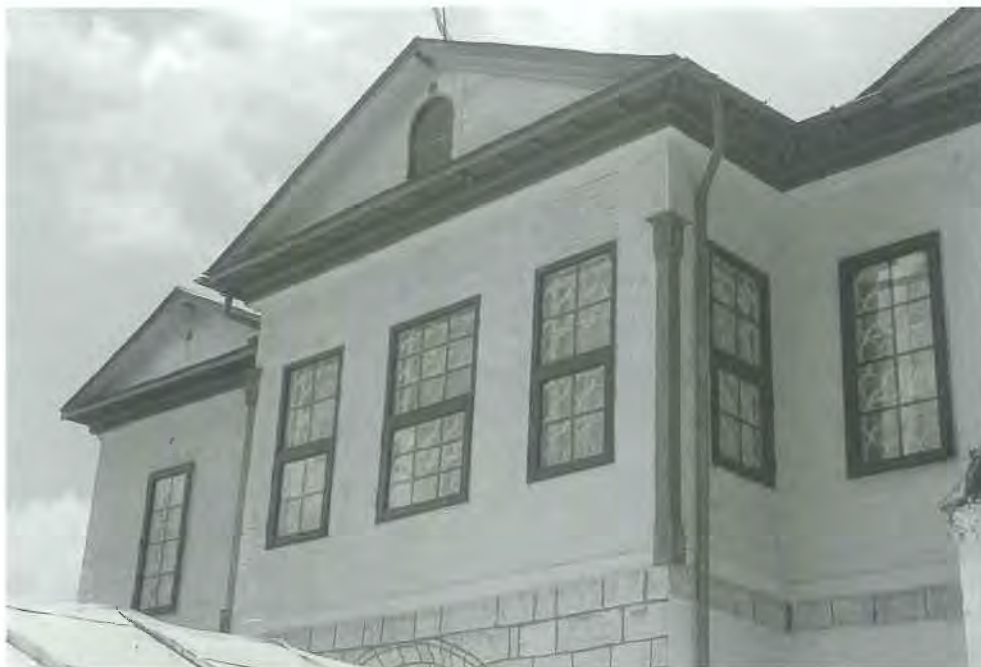
Εικ. 8. Τύπος Γ. Συμμετρική πρόσοψη με προεξοχή και αέτωμα στο αρχοντικό Τσίρλη στο Νυμφαίο.