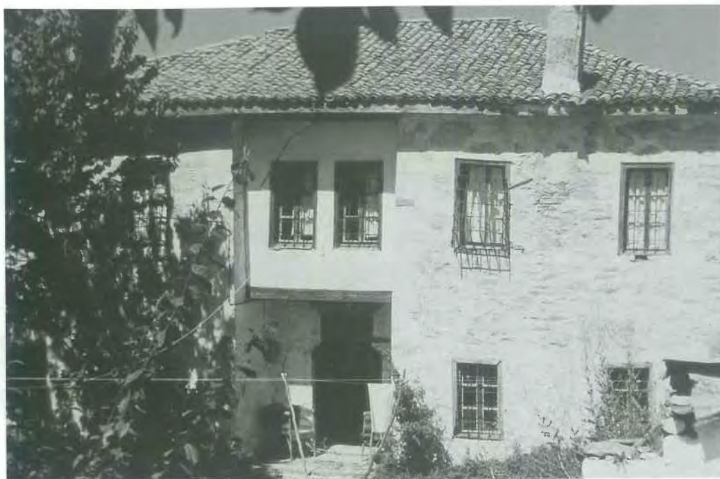
Εικ. 3. Τύπος Α. Σπίτι στη Βλάστη, όπου η εσοχή διαμορφώνεται σε κλειστό εξώστη (σαχνισί). Φωτογραφία του συγγραφέα (1989).