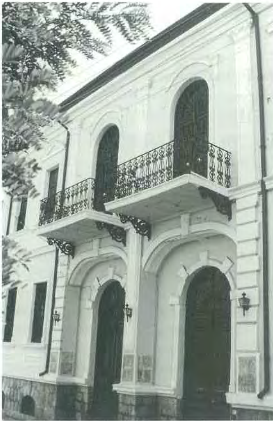
Εικ. 11. Τύπος ΣΤ. Νεοκλασικό σπίτι στη Φλώρινα. Φωτογραφία του συγγραφέα (1995).