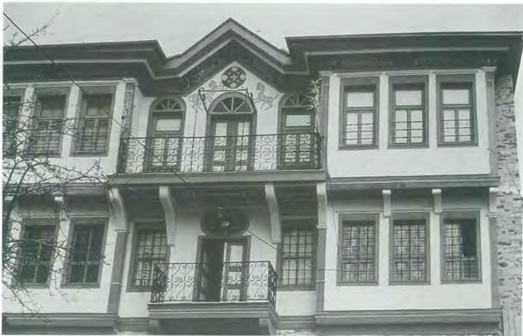
Εικ. 6. Τύπος Β. Σπίτι στο Κρούσοβο. Συμμετρική πρόσοψη με Ελληνοοττωική διακόσμηση. Φωτογραφία του συγγραφέα (1989).