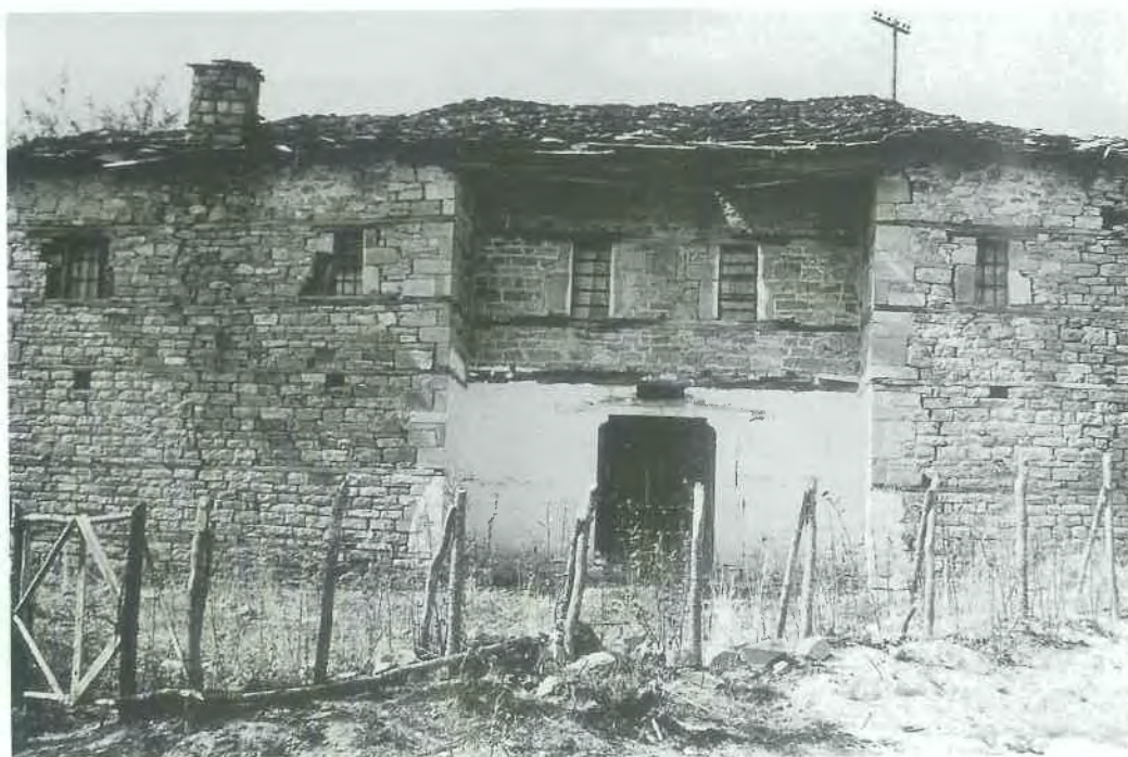
Εικ. 4. Τύπος Α. Σπίτι στη Φούρα. Φωτογραφία του συγγραφέα (1988).