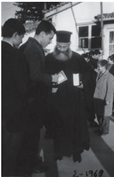
Παλ. Ἅγ. Ἀχίλλιος (Φεβρ. 1969).