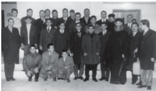
Ἅγιοι Σαράντα Μάρτυρες (1970).

προσευχή. Ἀργότερα, πάρα πολλοί νέοι καί νέες ἔτρεχαν νά τόν συναντήσουν στό παρεκκλήσι τῆς ἁγ. Παρασκευῆς, στό ὑπόγειο τοῦ Ἅγ. Χαραλάμπους, γιά νά καταθέσουν γραπτῶς τίς ἐρωτήσεις τους γιά θέματα ἐπίκαιρα ἀλλά καί γιά θέματα πού ἀφοροῦσαν τίς δικές τους νεανικές ἀναζητήσεις καί προβληματισμούς. Πλῆθος εἶναι οἱ ἀπαντήσεις σέ ἐρωτήσεις τῶν ἀκροατῶν του καί οἱ ὁμιλίες, πού ἔχει ἐκφωνήσει, καί κυκλοφοροῦν στό διαδίκτυο.