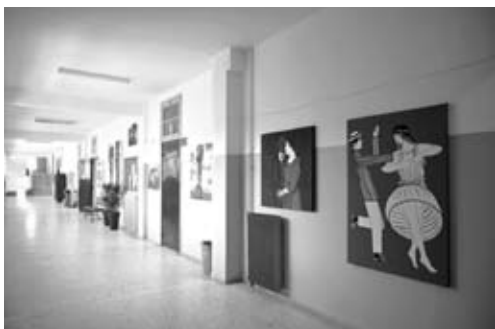
Διάδρομος 1ου όρόφου