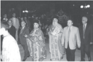
Περιορὰ Ἐπιταφίου τοῦ Μητροπολιτικοῦ Ναοῦ Τυρνάβου