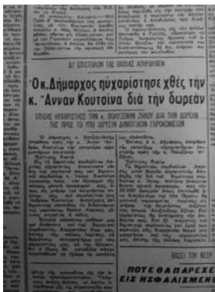
Άρθρο της εφημερίδας ΕΛΕΥΘΕΡΙΑ 4η Απριλίου 1961

Διαιρείται εις δύο αυτότελῃ γυμνάσια ἀπὸ τῆς λίξεως τοῦ τρέχ. σχολικοῦ ἔτους 1933-34 τὸ ἐν Λαρίσῃ γυμνάσιον τοῦ ἐκ τῆς διαιρέσεως ταύτης προερχομένου γυμνασίου ὀνομαζομένου 'θηλέων' ὑπὸ τὸν ὄρον τῆς μί ἀυξίσεως τοῦ ἤδη οργανικοῦ προσωπικοῦ των σχολείων τῆς Μ. Ἐκπαιδεύσεως, εἰμὶ κατὰ ἓνα γυμνασιάρχην καὶ ὑπὸ τὸν ὄρον ὄπως τὸ διὰ τὴν στέγασιν τοῦ γυμνασίου θηλέων οἰκημα μισθῶν ὁ Δήμος Λαρίσης ἰδίαις αὐτοῦ δαπάναις.