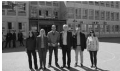
Οί συνεργαζόμενοι φορείς γιά τήν εγκατάσταση φωτοβολταϊκού συστήματος στο 4ο Γυμνάσιο Λάρισας.

Μία ολική αλλαγή της ενεργειακής κατάστασης του κτιρίου του 4ου Γυμνασίου πραγματοποιήθηκε τό 2016 μέ σκοπό τήν ενεργειακή αναβάθμισή του καί τήν εξοικονόμηση ενέργειας. Πέντε δημοτικά κτίρια τής Λάρισας (τό Δημορχείο, τό Δημοτικό Ώδειο, ό 11ος Παιδικός Σταθμός, τό 2ο καί 28ο Δημοτικό Σχολείο καί τό 4ο Γυμνάσιο) ήταν τά πρώτα πού επιλέχθηκαν γιά νά ένταχθούν στό πρόγραμμα του Ύπουργείου Περιβάλλοντος Ένέργειας καί Κλιματικής Άλλαγής «Έξοικονομώ». Στο 4ο Γυμνάσιο μεταξύ άλλων έγιναν: έφαρμογή θερμομόνωσης τής έξωτερικής τοιχοποιίας καί τής όροφής του κτιρίου, αντικατάσταση τών παλιών κουφωμάτων μέ νέα άλουμινίου μέ θερμοδιακοπή καί διπλούς ύαλοπίνακες, αντικατάσταση τών παλιών φωτιστικών. Τό έργο αυτό άλλαξε ριζικά τίς συνθήκες διαβίωσης τών μαθητών καί εκπαιδευτικών, καθώς βελτίωσε τήν ενεργειακή συμπεριφορά του κτιρίου καί μείωσε σημαντικά τήν έπίσια κατανάλωση σέ ήλεκτρική ενέργεια καί καύσιμα.