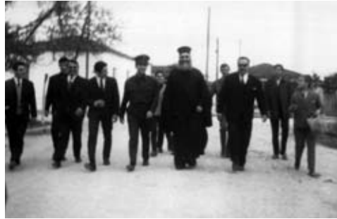
Πρός Προφίτη Ἠλία Τυρνάβου (1969).

κληρικός, στήν κατήχηση τοῦ λαοῦ τοῦ Θεοῦ. Ἀρχικά ἀκολούθησε τόν Μητροπολίτη Ἄρτης Ἰγνάτιο Τσίγκρη, ἀλλά σύντομα ἀποχώρησε γιά νά ἀκολουθήσει τόν Ἄρχιμ. Ἰάκωβο Σχίζα, πού ἐκλέχθηκε Μητροπολίτης Λαρίσης καί ἐνθρονίσθηκε στίς 18 Μαΐου 1960.