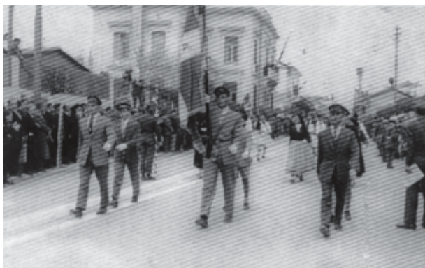
Παρέλαση του Α΄ Γυμνασίου (1957)

«Τα μαθητικά μου τά χρόνια δέν τ' αλλάζω μέ τίποτα. Θά ἔδωνα τά πάντα νά γινόμευα παιδί...», λέει ἡ μπαλάντα τοῦ Νίκου Καρβέλα (1988). Εἶναι γεγόνος ἀναμφισβήτητο, πού ὅσο δύσκολα καί νά ἦταν αὐτά, ὁμως ἦταν τά καλύτερα, τά πιά ξέγνοιαστα. Ἔχουν χαραχθεῖ βαθιά στή μνήμη μας καί ὅταν τ' ἀναπολοῦμε μᾶς γεμίζουν νοσταλγία καί τόσα συναισθήματα.