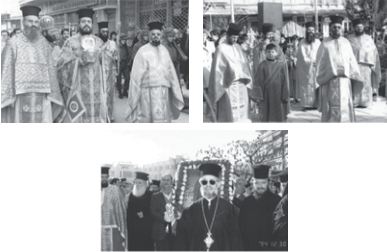
Στιγμιότυπα από τη λιτάνευση τῆς εικόνας καὶ τῆς Ἁγίας Κάρας τοῦ Ἁγίου Γεδεών στὸν Τύρναβο

ἀδελφὸ καὶ συλλειτουργὸ π. Ἀθανάσιο μὲ τὴν εὐχὴ Κύριος ὁ Θεὸς νὰ τὸν ἀναπαύει μετὰ τῶν δικαίων.