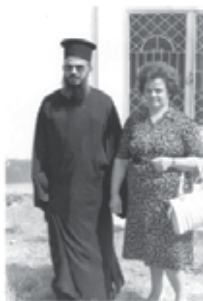
Με την πρεσβυτέρα του Άνθι, στον Ίερό Ναό τοῦ Κοινοτικοῦ Καλαμπάκας