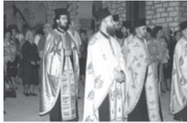
Λιτάνευση Ἱερῆς Εἰκόνας Γενεθλίου τῆς Θεοτόκου

εἶναι ἠθικὴ ὑποχρέωσις τοῦ κάθε ἀνθρώπου, μικροῦ ἢ μεγάλου, κληρικοῦ ἢ λαϊκοῦ, μαθητοῦ ἢ ἐκπαιδευτικοῦ, ἄρχοντα ἢ ἀρχομένου.