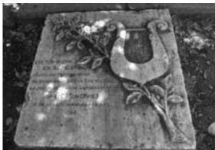
Ἐγχάρακτη ἀφιερωματική ἐπιγραφή

Στόν αὐλίου χῶρο τοῦ 4ου Γυμνασίου-Λυκείου Λάρισας, στή συμβολή τῶν ὁδῶν Ἡπειροῦ καί Ἀνθίμου Γαζῆ, στέκει ὁ μαρμαρινός ἀνδριάντας τοῦ Ρήγα Φεραίου, ἔργο τοῦ Μίμη Γεντέκου (1948). Πρόκειται γιά πρόπλασμα χωρίς βάση, ὕψους 2,85 μ. χωρίς τά βάθρα καί πλάτους 1,1 μ., πού δέν ἔγινε ποτέ γλυπτό ἔργο. Ὅπως ἀναφέρει ἡ ἐπιγραφή σπὴν πλάκα δίπλα του, ἦταν ἀφιέρωμα τῶν Θεσσαλῶν Δασκάλων: «ΕΙΣ ΤΟΝ ΡΗΓΑΝ ΕΚ ΒΕΛΕΣΤΙΝΟΥ ΨΑΛΤΗΝ