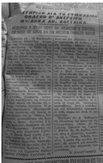
Άρθρο της εφημερίδας ΕΛΕΥΘΕΡΙΑ 1η Απριλίου 1961