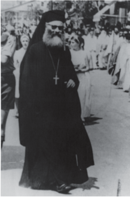
Λιτανεία Αγ. Αχιλλίου (1970).

Μέ όλους αυτούς τούς κατηχητές καί κατηχήτριες δέν στελέχωσε μόνο τίς ἐνορίες, ἀλλά καί τίς κατασκηνώσεις τῆς Ἱ. Μητροπόλεως, ὅπου ἡ χαρά, τό τραγούδι, τό παιχνίδι καί οἱ φωνές τῶν παιδιῶν γέμιζαν τίς πλαγιές τοῦ Κισσάβου μέ ἴχους πνευματικῆς καί ἀνοδικῆς ἐλευθερίας.