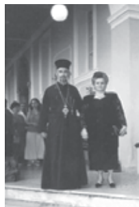
Με την πρεσβυτέρα του Άνθι, λίγο πρὶν τὴν ἀκολουθία τοῦ Γάμου τοῦ γιοῦ τους Χρίστου στὸ Αἶγιο

Τυρνάβου κυρὸ Ἰγνάτιο ὑπὸ τοῦ Σεβασμιωτάτου (πρῶτα ἐγκαίνα Ναοῦ). Διακρινόταν γιὰ τὴν καλλιφωνία του καὶ τὴν καλὴ γνώση τῆς Βυζαντινῆς Μουσικῆς. Ἐνδιαφερόταν, ἐπίσης, γιὰ τὴν προστασία τοῦ ποιμνίου του ἀπὸ τὴ λαίλαπα τῶν Αἰρέσεων καὶ γι' αὐτὸ διοργάνωσε ὑπαίθρια ἀντιαρετικὴ ἐκδήλωση στὴν κεντρικὴ πλατεία Τυρνάβου.