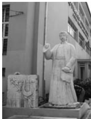
Ἡ τωρινή θέση τοῦ ἀγάλματος καί τῆς ἐπιγραφῆς

μόρφωσαν τό παλιό ἐπιβλητικό κτήριο πού κάθε γωνιά του θύμιζε τό μεγαλειό και τίν ἀρχοντιά τῶν πρώτων ἐτῶν τῆς ‘ζωῆς’ του, προσθέτοντάς του μία σύγχρονη πινελιά σάν μικροί Πικάσο.