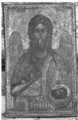
Εικ. 4. Ἅγιος Ἰωάννης Πρόδρομος, 1691, Ἱ. Ν. Ἀγίου Ἀθανασίου.