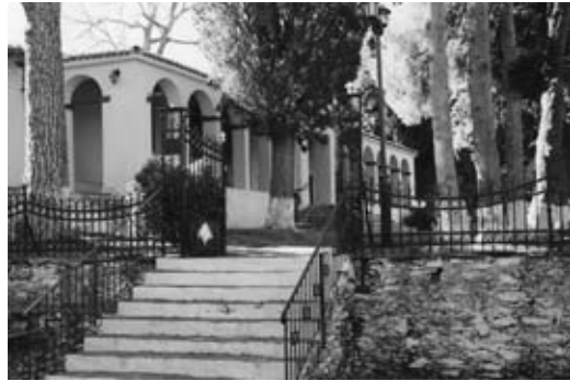
Ι. Ν. Αγίου Γεωργίου.

δέν υπήρχαν χρήματα. Από τό 1810-1825 ή όποια λειτουργία του γινόταν χάρις στήν οικειοθελή προσφορά τών δασκάλων του Γένους τής περιόδου εκείνης.