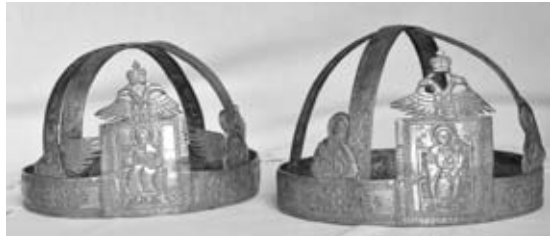
Εικ. 23. Ζεύγος Αργυρών Στεφάνων Γάμου, 1826, Γ. Ν. Αγίου Άθανασίου.

μέ περικόλειστο ξυλόγλυπτο πυρίνα καί ήμιπολύτιμους λίθους, τοῦ 1667 μέ ὑπογραφή τοῦ Ἰωάννη χρυσοχοῦ ἀπό τόν Τύρναβο (εἰκ. 19), ἀποτελεῖ μία ἀπό τίς παλαιότερες ἐπιγραφικές μαρτυρίες γιά τήν ὕπαρξη ἐργαστηρίου ἀργυροχρυσοχοῖας στόν Τύρναβο 43 . Στήν συλλογή ὑπάρχουν δύο ἀκόμη σταυροί ἀγιασμοῦ, ὁ ἕνας ἀσημένιος καί ὁ ἄλλος ἐπιχρυσωμένος, ἐκτελεσμένα σέ συρματερή τεχνική, πού ἀπό τά μορφολογικά καί τεχνοτροπικά τους χαρακτηριστικά χρονολογοῦνται στόν 18ο αἰώνα (εἰκ. 20). Ὑπάρχουν ἀκόμη τέσσερα δισκοπότηρα, τό ἕνα ρωσικό, ἐπίχρυσο, καί τά ὑπόλοιπα μᾶλλον κάποιου τοπικοῦ ἐπαρχιακοῦ ἐργαστηρίου, μέ ἐπιρροές τόσο ἀπό τήν ὀθωμανική ὅσο καί ἀπό τήν δυτική τέχνη. Στό ἕνα ἀπό αὐτά συναντοῦμε ἐπιγραφή στό πόδι,