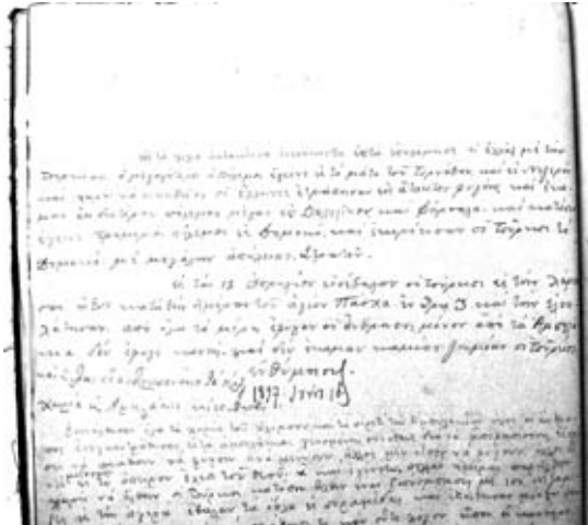
Εικ. 18. Ένθύμηση του 1897, Κώδικας Μηναιο Ιουνίου, 1896, Γ. Ν. Αγίου Άθανασίου.

Λειψία και, σπανιότερα, από τίν Βενετία. Κατά δεύτερον, γιατί τά παλαιύττα αυτά πού άντεξαν στόν χρόνο άποτελοῦσαν και ένα είδος ήμερολογίου, καθώς στίς άδειες σελίδες τους οί άνθρωποι σημείωναν σημαντικά γεγονότα για νά παραδοθῶν στους άπογόνους και νά μίν ξεχαστοῦν.