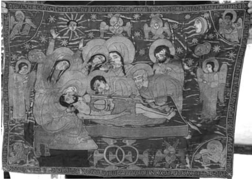
Εικ. 14. Χρυσοκέντητος Έπιτάφιος, 1704, Γ. Ν. Άγίας Παρασκευής.

Στόν ναό τῆς Άγίας Παρασκευῆς διατηροῦνται δύο χρυσοκέντητοι ἐπιτάφιοι πολὺ καλῆς ποιότητος. Ὁ παλαιότερος, ἀνώνυμου καλλιτέχνη, χρονολογεῖται μὲ ἐπιγραφή στὰ 1658 (εἰκ. 13). Διαθέτει πολὺ καλὴ ποιότητα σχεδίου, μὲ ἐκφραστικὲς μορφές καὶ λεπτὴ καὶ ἐπιτήδεια τεχνικὴ πού θυμίζει μετεωρίτικα παλαιότερα πρότυπά του, σπὴν σφαῖρα τῆς παράδοσης τοῦ φημισμένου βαρλααμίτικου ἐργαστηρίου 26 . Ὁ νεότερος ἐπιτάφιος τοῦ ἴδιου ναοῦ χρονολογεῖται στὰ 1704 (εἰκ. 14) καὶ φέρει ἐπιγραφή μὲ τὸ ὄνομα τοῦ ἀφιερωτῆ καὶ τῆς κεντήτριας. Ἡ ἐπιγραφή τίθεται σπὴν ἐξωτερικὴ περίμετρο τῆς σύνθεσης καὶ