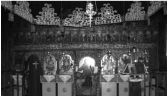
Εικ. 9. Ξυλόγλυπτο Τέμπλο, 1722, Γ. Ν. Άγιου Γεωργίου.