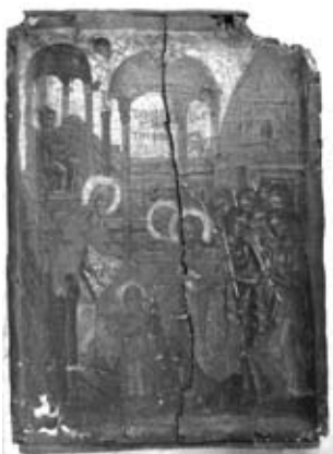
Εικ. 3. Τά Εισόδια τῆς Θεοτόκου, 17ος αἰώνας, Ἱ. Ν. Ἀγίου Ἀθανασίου.