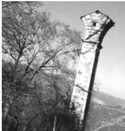
Μανιάρειος Σχολή. Κίονας ἀπό τό κατεστραμμένο κτίριο.