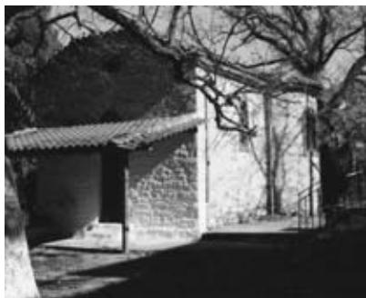
Ι. Ν. Αγίων Κηρύκου και Ιουλίτης.

Στήν είσοδο του χωριού και άριστερά μας υπάρχει ένας μικρός ναός των Αγίων Κηρύκου και Ιουλίτης. Έορτάζουν στίς 15 Ιουλίου. Προχωρώντας Β/Δυτικά του χωριού είναι ή έκκλησία του Άγιου Άθανασίου. Ο ιερός αυτός ναός κτίστηκε στά μέσα του 18ου αιώνα. Δίπλα του υπήρχε ένα μικρό έκκλησάκι προς τιμή της Παναγίας της Άμπελακιωτίσης. Καθώς προχωρούμε στον κεντρικό δρόμο και περνάμε τήν πλατεία, στήν άνωφέρεια, συναντάμε τήν Αγία Παρασκευή. Ο Ναός αυτός είναι κατά πολύ νεότερος. Κτίστηκε τό 1885 από τόν τελευταίο επίσκοπο Πλαταμώνος Άμβρόσιο Κασσάρα στήν θέση που ήταν παλιά το Έλληνομουσείο – τό όποιο έπαψε να λειτουργεί από τό 1825 επειδή