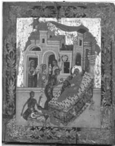
Εικ. 12. Ἡ Γέννησις τῆς Θεοτόκου, 19ος αἰώνας, Ἴ. Ν. Ἀγίου Ἀθανασίου.