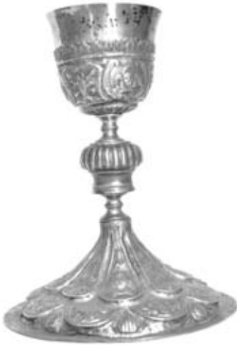
Εικ. 21. Αργυρό Δισκοπότηρο, 1788, Γ. Ν. Αγίου Άθανασίου.