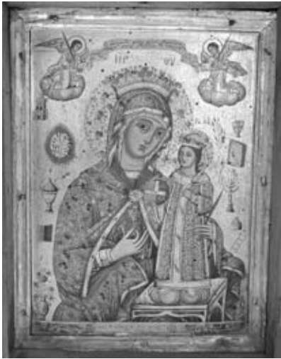
Εικ. 11. Θεοτόκος «Ρόδον τό Ἀμάραντον», 1808, Ἴ. Ν. Ἀγίου Ἀθανασίου.