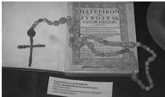
Κομποσκοίνια ἀπὸ τὸν ἡγούμενο Ἀντώνι τῆς Πετσέρσκα Λαύρα τοῦ Κιέβου (πέθανε τὸ 1669), Διατηρητέο τοῦ Ἐθνικοῦ, Ἱστορικοῦ καί Πολιτισμικοῦ τοῦ Πετσέρσκ-Κιέβου.

Ἡ ἔκδοσι τοῦ εὐχολόγιου τοῦ Mohyla προώθησε τὴν διάδοσι τοῦ κομποσκοινοῦ στὸ μοναστικὸ περιβάλλον, γιατί τώρα πιά δίνεται σέ κάθε ἄνθρωπο ὁ ὁποῖος εἰσέρχεται στὸ μονοπάτι τῆς σωτηρίας. Ἀναμφίβολα, ἡ χρῆσι τοῦ σπὴν τελετῆ τῆς κουρᾶς αὐξήσε τὴ σημασία τοῦ γιὰ τὴν μοναστηριακὴ ζωὴ, μετατρέποντάς το σέ ἓνα ἀπαραίτητο γνώρισμα ἐπενδεδυμένο μέ βαθύ ἱερό νόημα.