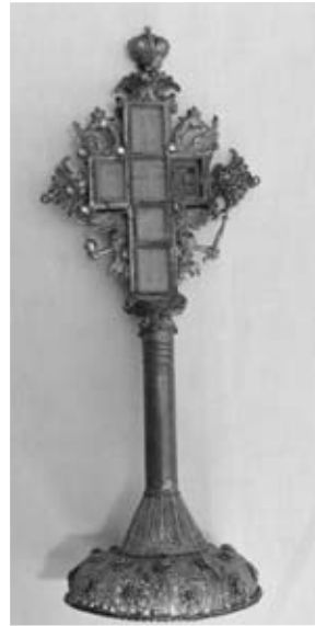
Ἐπίχρυσος Σταυρός Ἁγιασμοῦ, 18ος αἰώνας, Γ. Ν. Ἁγίου Ἀθανασίου.

ἐπίσκεψη τοῦ Ἑλλῆνα Πατριάρχου Ἱεροσολύμων Χρῦσανθου Νοταρᾶ, ὁ ὁποῖος κατεῖχε τὸ ἀξίωμα τοῦ Πατριάρχου ἀπὸ τὸ 1707 ὡς τὸ 1731 καὶ ὑπῆρξε λόγιος μὲ σπουδαῖο συγγραφικὸ ἔργο 37 . Ἄλλοτε συναντοῦμε ἐνθυμῖσεις γιὰ κάποια ἐπιδημία πού ἐνέσκηψε, ὅπως ἡ ἀσθένεια πού ἦρθε στὸ χωριὸ τὸ 1714 38 ἢ καὶ