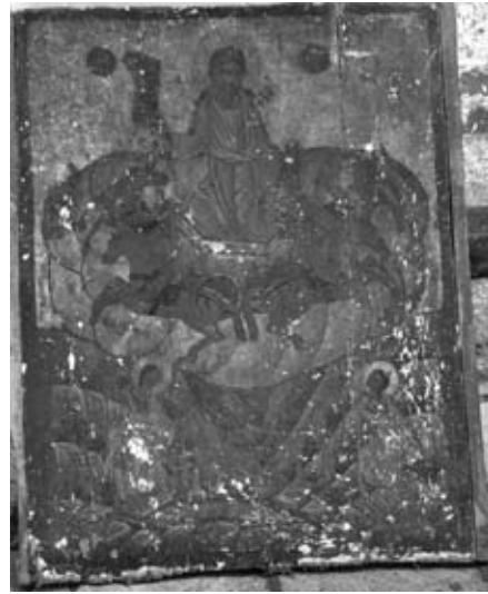
Εικ. 8. Η Ανάλυση του Προφήτη Ηλία, 18ος αιώνας, Γ. Ν. Άγίου Άθανασίου.

Ο 17ος αιώνας μᾶς ἀνταμείβει μὲ ἔργα ἰδιαίτερης ὁμορφιάς, τὰ ὅποια μᾶς ἀποκαλύπτουν ὅτι ἡ μικρὴ μας κωμόπολι ἔχει τὴν δυνατότητα νὰ συναλλάσσεται μὲ καλλιτεχνικὰ κέντρα ἀπὸ τὸ Ἅγιο Ὅρος καὶ τὴν βόρεια Ἑλλάδα. Μερικὲς ἀπὸ τίς πιὸ σπουδαίες εἰκόνες τοῦ 17ου αἰῶνα εἶναι ἡ ὁμορφη εἰκόνα τῶν Ἁγίων Τεσσαράκοντα μαρτύρων, τῶν Εἰσοδίων τῆς Θεοτόκου (εἰκ. 3), τῆς Σύναξης τῶν Ἀποστόλων, ἔργα τοῦ ἰδίου ἀγνώστου καλλιτέχνη. Ἀξιοσημείωτο εἶναι ἓνα ὁμορφο σύνολο τεσσάρων εἰκόνων μεγάλων διαστάσεων (Χριστὸς Παντοκράτορας, Παναγία Βρεφοκρατοῦσα, Προφήτης Ἡλίας, Ἰωάννης Πρόδρομος καὶ Βάπτισις τοῦ Χριστοῦ) μαζί μὲ τμήμα ἐπιστυλίου μὲ θέμα τὴν σύνθεσις τῆς Μεγάλης Δέσις, πιθανότατα ἀπὸ τὸ παλαιὸ τέμπλο τοῦ ναοῦ τῆς Ἁγίας Παρασκευῆς ἢ τοῦ Προφήτη Ἡλία (εἰκ. 4-6) 21 .