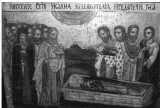
Θραύσμα εικόνας "Ο Άγιος Ιωάννης ο Βαπτιστής" "Ο Άγγελος της ερήμου", 17 c., Odrzechowa, σπή νότιο= ανατολική Πολωνία, The Rural Architecture Museum of Sanok (Poland)

αυτό τό δῶρο, ἡ πριγκίπισσα πιθανῶς νά ἐξέφραζε τήν εὐγνωμοσύνη της στόν Ἄρσενι καί πιθανῶς νά ζητοῦσε ὡς μνημόνευση τίς μελλοντικές του προσευχές.