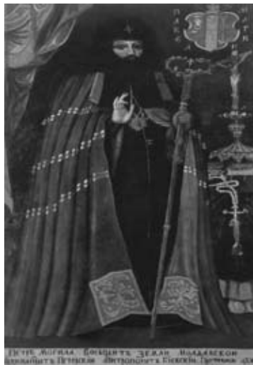
Πορτραῖτο τοῦ μητροπολίτη Κιέβου Πέτρο Μοχίλα, πρῶτο μισό τοῦ 18ου αἰώνα, στό: H. Bielikova, H. Chlenova (comp.), Ukrains'kyi portret XVI-XVIII stolit': kataloh-albom (Khmelnyns'kyi - Kyiv, 2006) , p. 170

Μετά τόν θάνατο ἑνός μοναχοῦ, τά ὑπάρχοντά του προσφέρονταν συχνά πρὸς πώληση (τέτοιες περιπτώσεις πιστοποιήθηκαν στίς ἀρχές τοῦ 18ου αἰώνα). Τό κομποσκοίνι τοῦ πεθαμένου μοναχοῦ μποροῦσε ἐπίσης νά πωληθεῖ, μερικές φορές σέ κάποιον κοσμικό 65 , καί ὁ ἀγοραστής συνέχιζε νά προσεύχεται μέ αὐτό. Αἰσθανόμενοι ὅτι τό τέλος τους εἶναι