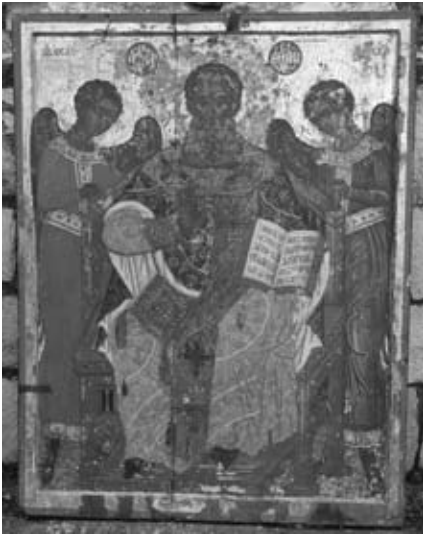
Εικ. 7. Άγιος Άθανάσιος ένθρονος, 18ος αιώνας, Γ. Ν. Άγίου Άθανασίου.