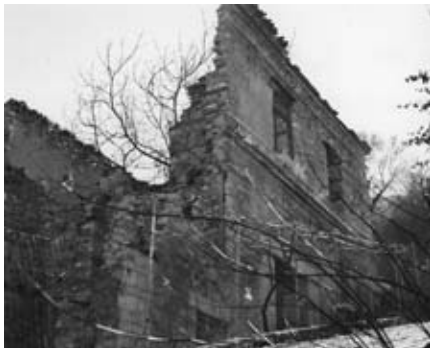
Μανιάρειος Σχολή, ἐρείπιο.