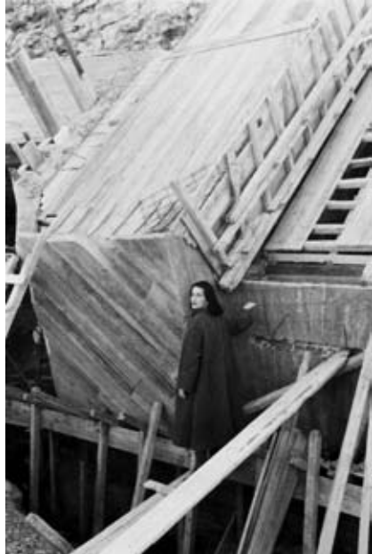
Νέλλα Γκόλαντα, Ἀποκατάσταση τοπίου στό Μί Ἐνεργό Λατομεῖο τῆς Αἰξωνῆς στή Γλυφάδα: Τό Γλυπτό Θεάτρο Αἰξωνῆς, φωτό 1985, ἀπό τό ἀρχεῖο τῆς Ν. Γκόλαντα.

Ναί, βασικά εἶναι αὐτό τό σκηνικό: χωριά πού βλέπουμε νύχτα στόν κάμπο καί δείχνουν νά τρεμοσβῆνουν τά φῶτα καθῶς τά κοιτάμε ἀπό μακριά. Σέ ὅ,τι ἀφορᾶ στά σχέδια στήν διαδρομή πρὸς τό ἀρχαῖο θέατρο, αὐτά εἶναι κατόψεις