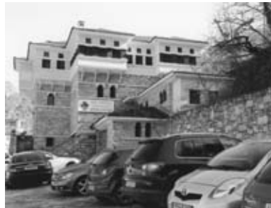
Εἴσοδος οικισμού σήμερα.

Τά Άμπελάκια είναι εκτεθειμένα στον βοριά ενώ προστατεύονται από τον νότο, τον χειμώνα κρύο –λίγο ήλιο– και τό καλοκαίρι δροσιά. Οί δρόμοι είναι πλακόστρωτοι – γκαλντερίμια.