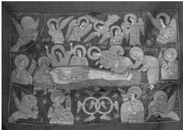
Εικ. 13. Χρυσοκέντητος Επιτάφιος, 1658, Ἴ. Ν. Ἀγίας Παρασκευῆς.