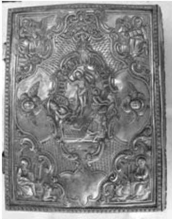
Εικ. 17. Αργυρή Έπένδυση Ευαγγελίου, 1900, Γ. Ν. Αγίου Άθανασίου.