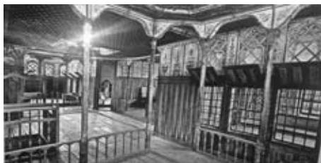
Οἰκία τοῦ Σβάρτς.

Στό κατώ, ἦταν τό θησαυροφυλάκιο. Στό κέντρο τοῦ σαλονιοῦ ὑπῆρχε ἡ αἴθουσα συνεδριάσεων σέ ἓνα ὑπερυψωμένο σχετικά βᾶθρο. Τό μεσαῖο πάτωμα προοριζόταν γιά τήν χειμερινή διαβίωση. Αἴθουσες μέ τζάκια μέ πλούσια διακόσμηση. Σκάλα πού ὀδηγεῖ στόν τελευταῖο ὄροφο, ὅπου καί ὁ ξενώνας. Αὐτός ὁ χῶρος χρησιμοποιοῦνταν ἀπό τήν οἰκογένεια ὡς θερινή διαμονή. Γι' αὐτό καί τά μεγάλα παράθυρα. Ἐδῶ πρέπει νά σημειώσουμε ὅτι τό 1803 στό σπίτι τοῦ Σβάρτς παίχθηκε τό ἔργο ἑνός Γερμανοῦ συγγραφέα, τοῦ Κουτσεμπό, πού εἶχε σάν θέμα: «φιλανθρωπία