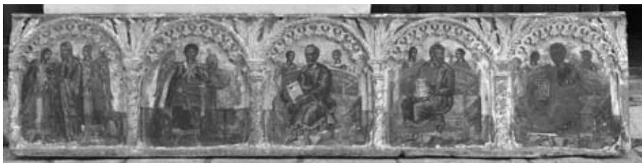
Εικ. 6. Τμήμα ἐπιστυλίου τέμπλου, 17ος αἰώνας, Ἱ. Ν. Ἀγίου Ἀθανασίου.

Θεοτόκου ἔνθρονης βρεφοκρατούσας. Στόν 16ο αἰώνα χρονολογοῦνται, ἐπίσης, κάποιες εἰκόνες μέ μορφές τῶν ἀποστόλων, οἱ ὁποῖες προέρχονται ἀπό ἐπιστύλιο κατεστραμμένου τέμπλου ξυλόγλυπτης-ξυλοκοπτικῆς τεχνικῆς, τοῦ ὁποῖου τὴν προέλευση, δυστυχῶς, δέν εἴμαστε σέ θέση νά γνωρίζουμε 20 .