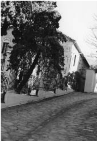
Ι. Ν. Αγίας Παρασκευής.