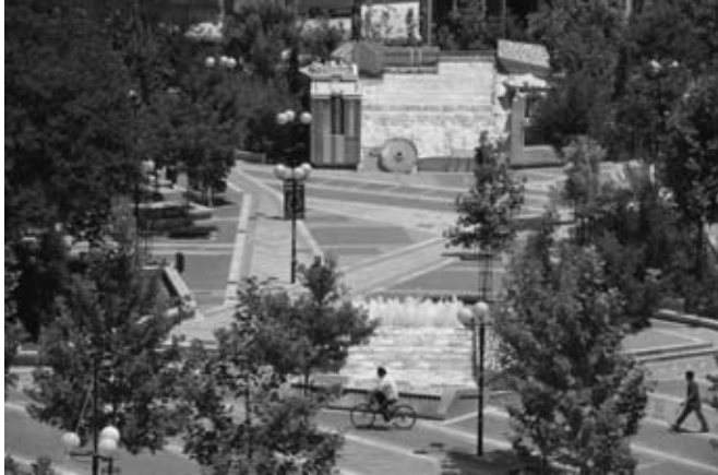
Άποψη του πρώτου μέρους του "Γλυπτού Ποταμού" στην Πλατεία Ταχυδρομείου.

είχαν στόχο νά ανατρέψουν τήν αποκοπή τῆς Ἀθήνας ἀπό τό βουνό τοῦ Ὑμηττοῦ, ὥστε οἱ ἐποχούμενοι, διασχίζοντας τήν Ἀττική ὁδὸ κατὰ μῆκος τοῦ Ὑμηττοῦ, νά ἀντιλαμβάνονται καί νά ὀργανώνουν τήν σχέση μεταξύ τοῦ φυσικοῦ καί ἀνθρωπογενοῦς τοπίου.