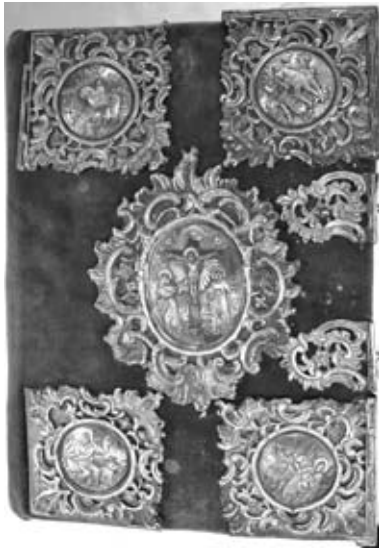
Εικ. 15. Αργυρεπίχρσο κάλυμμα Εὐαγγελίου, 1803, Γ. Ν Ἁγίου Ἀθανασίου.