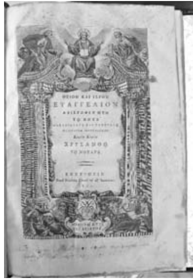
Εικ. 16. Ἀρχικό Φύλλο Παλαιτύπου Εὐαγγελίου, 1811, Γ. Ν Ἁγίου Ἀθανασίου.

ἀναφέρει ἀπόσπασμα ἀπό γνωστό τροπάριο τῆς Μ. Παρασκευῆς 27 καί, στό τέλος, τήν χρονολογία κατασκευῆς: «...ΕΠΙ ΕΤΟΥΣ ΑΨΔ, ΔΙΑ ΣΥΝΔΡΟΜΗΣ ΣΤΕΡΓΙΟ, ΕΡΓΟΝ ΠΑΪΣΙΑΣ ΜΟΝΑΧΗΣ ΕΚ ΠΟΛΕΩΣ ΤΟΥΡΝΑΒΟΥ».