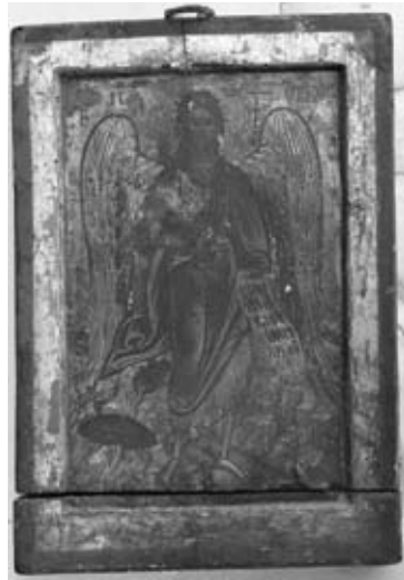
Εικ. 2. Ἅγιος Ἰωάννης Προδρόμος, 16ος αἰώνας, Ι. Ν. Ἁγίου Ἀθανασίου.

ναούς τοῦ Ἁγίου Ἀθανασίου 17 καί τῆς Ἁγίας Παρασκευῆς. Μερικά σπουδαῖα ἔργα πού ξεχωρίζουν θά παρουσιάσουμε συνοπτικά παρακάτω 18 .