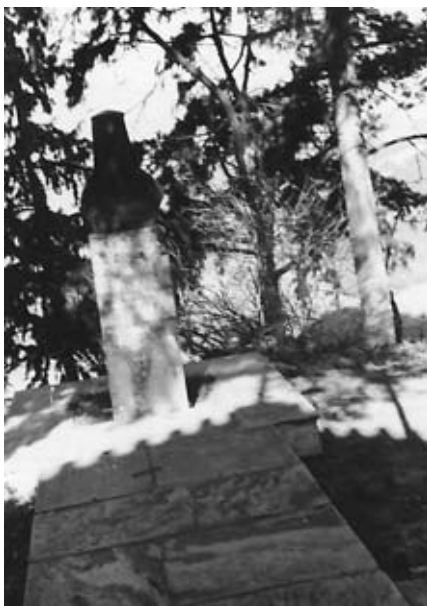
Ἡ προτομὴ τοῦ Ρωγῶν Ἰωσήφ

Καταγόταν ἀπὸ τὰ Ἀμπελάκια. Ὁ πατέρας του ἔγινε ἱερέας –ὁ Παπακωνσταντῆς– στὴν Τσαριτσάνη. Πῆρε μέρος σὲ ὅλες τὶς μάχες τοῦ Μεσολογγίου, καὶ στὴν πρώτη πολιορκία τὸ 1822 καὶ στὴν δεύτερη τὸ 1826. Τὸ 1823 κήδευσε τὸν Μάρκο Μπότσαρη καὶ τὸ 1824 τὸν Λόρδο Μπάυρον. Στὴν ἔξοδο τοῦ Μεσολογγίου συνελήφθη ἀπὸ τοὺς Τούρκους καὶ κρεμάσθηκε σὲ ἓναν πύργο, σφραγίζοντας μὲ τὸ μαρτυρικό τέλος του τὸ: «Ὁ ποιμὴν ὁ καλὸς τὴν ψυχὴν αὐτοῦ τίθησι ὑπὲρ τῶν προβάτων». Προτομὴ τοῦ Ρωγῶν Ἰωσήφ βρίσκεται στὴν εἴσοδο τοῦ ναοῦ τοῦ Ἁγίου Γεωργίου Ἀμπελακίων, γιὰ νὰ θυμίζει στοὺς αἰῶνες τὴν μορφὴ καὶ τὸ μαρτύριό του.