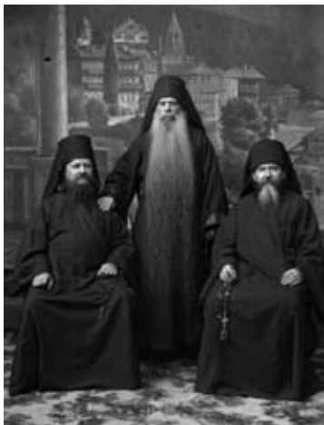
Ὁ Ρῶσος Τερομόναχος (μέ τί μακριά γενειάδα) μέ δύο ἄλλους μοναχούς. Φωτογραφία τῶν ἀρχῶν τοῦ 20οῦ αἰ. ἀπό τί Μονί τοῦ Ἁγίου Παντελεήμονος στόν Ἄθω, στό Α. Lidov (comp.), Gora Afon. Obrazy Sviatoi Zemli: katalog vystavki iz sobraniia Afonskogo fotoarkhiva, Moskva, 8-28 noiabria 2011 (Moskva, 2011).