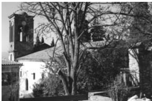
Ι. Ν. Αγίου Άθανασίου.