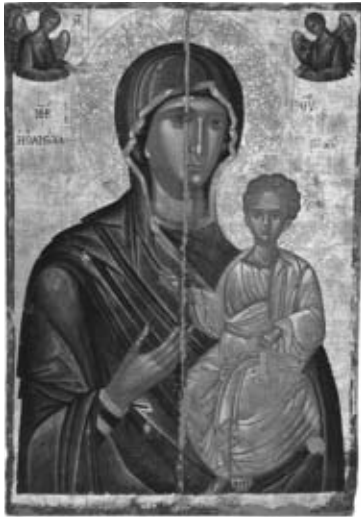
Εικ. 1. Θεοτόκος Ὁδηγήτρια, τέλη 16ου –ἀρχές 17ου αἰώνα, Ι. Ν. Ἁγίου Ἀθανασίου.