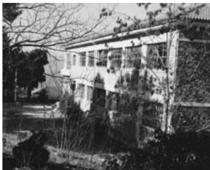
Ἡ Μανιάρειος Σχολή σήμερα.

Τό νέο κτίσμα ὑπάρχει μέχρι σήμερα. Λειτουργεῖ κατά καιρούς καί ὡς γυμνάσιο καί λύκειο. Σήμερα λειτουργεῖ μόνο ὡς νηπιαγωγεῖο καί δημοτικό. Μέ τήν ισχνή πλέον χρηματοδότηση τοῦ ιδρύματος οἱ μαθητές διδάσκονται δωρεάν μουσική καί ξένες γλῶσσες.