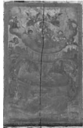
Εικ. 10. Θεοτόκος Ζωοδόχος Πηγή, 1798, Γ. Ν. Άγιου Αθανασίου

ἄν καί ἀνυπόγραφες, εἶναι οἱ εἰκόνες τῆς Ζωοδόχου Πηγῆς τοῦ 1798 (εἰκ. 10) καί τοῦ Ἀρχαγγέλου Μιχαὴλ ὀλόσωμου. Ἀγνώστου καλλιτέχνη, πιθανότατα ἀπό τὴν περιοχὴ τῆς Ἀγιάς 24 , εἶναι ἡ εἰκόνα τῆς Θεοτόκου στὸν τύπο «Ρόδον τὸ Ἀμάραντο» τοῦ 1808 (εἰκ. 11) 25 . Παράλληλα, οἱ παραγγελίες σέ καλά ἐργαστήρια τοῦ Ἁγίου Ὁρους ἐξακολουθοῦν μέ τίς εἰκόνες τῆς Γέννησης τῆς Θεοτόκου (εἰκ. 12), τῶν ἔνθρονων Ἁγίου Κυρίλλου καί Ἀθανασίου καί τὴν Πεντηκοστή νά ξεχωρίζουν ἀνάμεσα σέ ἄλλες.