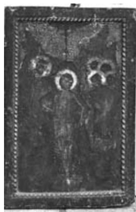
Εικ. 5. Ἡ Βάπτισις, 17ος αἰώνας, Ἱ. Ν. Ἀγίου Ἀθανασίου.