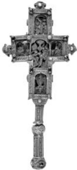
Εικ. 19. Ἀργυρεπίχρυσος Σταυρός Εὐλογίας. Ἔργαστηρίου Τυρνάβου, 1667, Γ. Ν. Ἁγίου Ἀθανασίου.