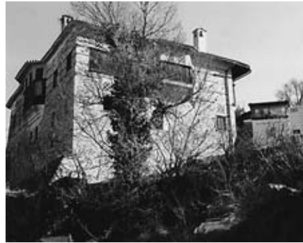
Οικία του Σβάρτς από διάφορες όψεις.