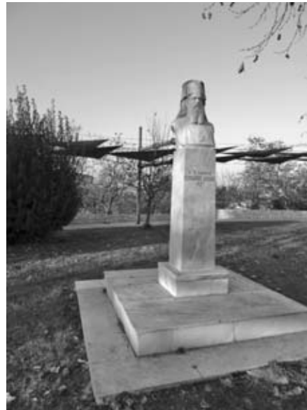
Ἡ ἐπιβλητική προτομή, ὅπως εἶναι σήμερα.