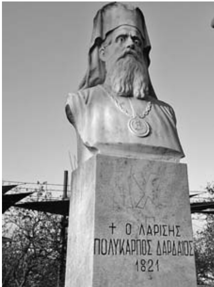
Ἡ προτομή τοῦ Πολυκάρπου στό Φρούριο, μέ ἐμφανῆ τὰ σημάδια ἀπὸ τὴν πτώση τῆς τῆς δεκαετίας τοῦ 1990.