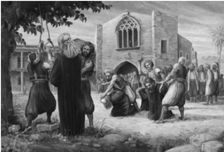
Ὁ ἀπαγχονισμός τοῦ Ἀρχιεπισκόπου Κυπριανοῦ καί ἡ σφαγί τῶν Μητροπολιτῶν

πολίτες, Πάφου Χρύσανθος, Κιτίου Μελέτιος καί Κυρηνείας Λαυρέντιος. Ἀνάμεσα σ' αὐτούς ἦταν καί ἓνας βοσκός! Σ' αὐτόν εἶχαν βάλει στό στόμα του λόγια γιά ἐπαναστατικές ἐνέργειες τῶν Ἑλλήνων τῆς Κύπρου, οἱ ὁποῖες δῆθεν ἐκπορεύονταν ἀπό τούς Ἱεράρχες. Στό τέλος θά τόν ἀπαγχονίσουν καί αὐτόν γιά νά τοῦ κλείσουν γιά πάντα το στόμα... Ἦταν ἡ πρώτη κατάθεση φόρου αἵματος τῆς Κύπρου στόν Ἐθνικό ξεσηκωμό, μετά τή θυσία τοῦ συντρόφου τοῦ Ρίγα Φεραίου, Ἰωάννη Καρατζᾶ ἀπό τή Λευκωσία.