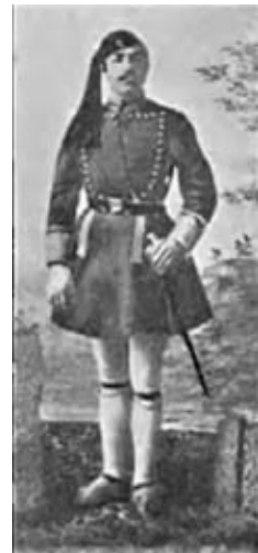
Ευζωνας (φρουρός) (δημοσιευμένο σε αυτό τό κείμενο από τόν Σίνκο)

Έξιστοι γραφικοί με τούς πελαργούς ήταν και οι στρατιώτες στην αγορά, ντυμένοι με τον άλβανικό 5 τρό-πο, δηλαδή με λευκές φουστανέλες που έβγαναν κάτω από ένα σκούρο μπλέ πανωφόρι δεμένο στην μέση και