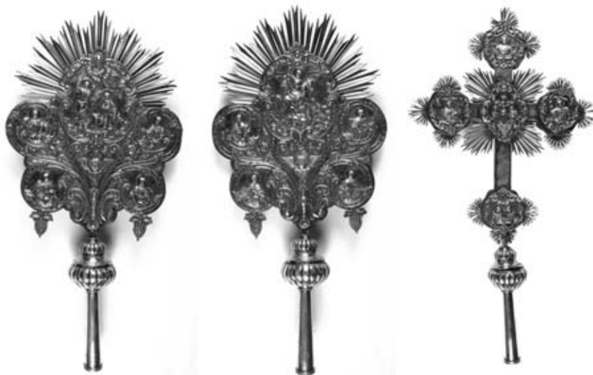
Εικ. 6 α, β, γ. Ζεύγος άργυρών έξαπτέρυγων και σταυρός, Στέφανα. Έπιγραφή: «ΚΑΙΣΑΡΕΙΑ ΕΠΑΡΧΙΑΣΙΝΤΑ ΣΤΕΦΑΝΑ ΚΙΟΒΟΥΝΟΥΝ ΑΖΙΖΙ ΠΑΝΑΓΙΑ ΗΤΖΙΝ ΤΖΟΥΜΛΕ ΧΡΙΣΤΙΑΝ-ΛΑΡΗΝ ΑΦΙΕΡΩΜΑΣΙ 1875». (Αφιέρωμα του 1875, όλων των χριστιανών για την άγια Παναγία του χωριού Στέφανα της επαρχίας Καισαρείας).

φέρουσα παραλλαγή στή σύνθεση τών μορφών, ανάμεσα στις όποιες παρίσταται και στρατιώτης.