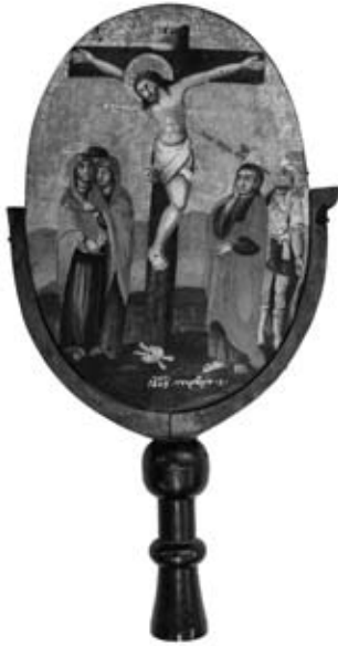
Εικ. 1. Ξύλινο λάβαρο λιτανείας, 1849, Ποτάμια, Έπιγραφή: «Δέσπη του δούλου του Θεού Σάββα Χατζηνικολῆ, εις βοήθεια αὐτοῦ, Τερέκιοι κόμπ Δεκεμβρίου γ΄».