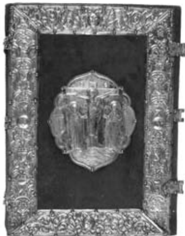
Εἰκ. 3. Ἀργυρεπίχρσο κάλυμμα Εὐαγγελίου, 18ος αἰ., Τζαλέλα.

Ἀπὸ τὴ Τζαλέλα προέρχεται ἀνάγλυφον στάχωση εὐαγγελίου τοῦ 18ου αἰῶνα (εἰκ. 3) καθὼς καὶ δυσκοπότερον τῆς ἴδιας ἐποχῆς, μετὰ χαρακτηριστικὴν διακόσμωσιν αὐτῆς τῆς περιόδου.