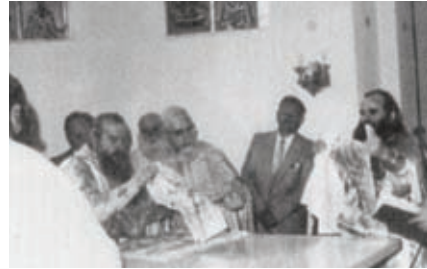
Ἀπὸ τὰ ἐγκαίνια τοῦ Ἱεροῦ Ναοῦ Ἁγίου Ἀθανασίου Λαρίσης.

νίας γὰ τὴν Ἱερὰ Μητρόπολη Λαρίσης. Τὴν 31-8-1956 τοποθετήθηκε Ἐφημέριος στὸν Ἱερὸ Ναὸ τῶν Παμ. Ταξιαρχῶν Λαρίσης, στὸν ὁποῖο ὑπηρέτησε μέχρι τὴν 10-8-1967, ἀπ' ὅπου ἔλαβε Ἀπολυτήριο Γράμμα γὰ τὴν Ἱερὰ Μητρόπολη Ἐδέσσης. Ἐκεῖ διορίζεται ἐφημέριος τοῦ Μητροπολιτικοῦ Ἱεροῦ Ναοῦ Ἁγίας Σκέπης Ἐδέσσης καὶ ὑπηρέτησε στὴν Ἑνορία αὐτὴ μέχρι τὴν 30-12-1984, ἐπὶ Ἀρχιερατίας τοῦ τότε Μητροπολίτου Ἐδέσσης, Πέλλης καὶ Ἀλμωπίας καὶ νῦν Ἁγίου Καλλινίκου, ὁ ὁποῖος κατετάγη εἰς τὸ Ἁγιολόγο τῆς Ἀξιοτάτης Ὁρθοδόξου Ἐκκλησίας μὲ τὴν ὑπ' ἀριθμ. 345/24-2-2020 Πατριαρχικὴν καὶ Συνοδικὴν Πράξιν τῆς Ἁγίας τοῦ Χριστοῦ Μεγάλης Ἐκκλησίας. Ἐκ τῶν τιμῶν χειρῶν τοῦ Ἁγίου αὐτοῦ Ἀρχιερέως, χειροθετήθηκε Οἰκονόμος τὴν 10-1-1968, πρωτοπρεσβύτερος τὴν 5-12-1976 καὶ πνευματικὸς τὴν 29-8-1967.