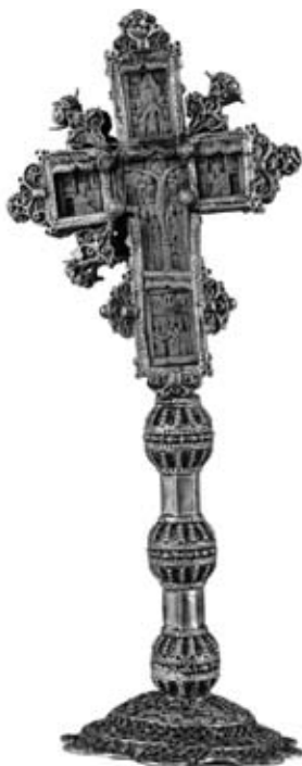
Εικ. 7. Σταυρός Άγιασμοῦ, 18ος αἰώνας, ιδιωτική συλλογή, ἀπό τὴν περιοχὴ τῆς Σμύρνης.

Στὴν ἔκθεση παρουσιάζονται, τέλος, καὶ ιδιωτικά κειμήλια, μεταξύ τῶν ὁποίων δύο εἰκόνες τῆς Παναγίας ἀπὸ τὸ Ὅμορφοχώρι, ἀλλὰ καὶ ἀντικείμενα ἀπὸ ἄλλες περιοχές, ὅπως ἀξιόλογος ξυλόγλυπτος σταυρός ἀγιασμοῦ τοῦ 18ου αἰώνα (εἰκ. 7) ποῦ διασώθηκε ἀπὸ τὴν καταστροφὴ τῆς Σμύρνης, καθὼς καὶ εἰκόνα τοῦ Εὐαγγελισμοῦ τῆς Θεοτόκου, προσφυγικὸ κειμήλιο ἀπὸ τῆ νῆσο Μαμαραῖ τῆς Προποντίδας.