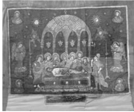
Εικ. 5. Χρυσοκέντητος ἐπιτάφιος, 1799, Ἐπιγραφή: «ΚΑΙΣΑΡΙΑΝΤΑ ΣΤΕΦΑΝΑ ΚΙΟΥΝΤΕ ΠΑΝΑΓΙΑ ΚΛΗΣΑΙΣΙ ΗΝΤΙ ΣΑΝΤΑΛΤΖΗΛΑΡΙΝ ΠΑΚΣΙΣΗ 1799». (Στὴν ἐκκλησία τῆς Παναγίας στό χωριό Στέφανα τῆς Καισαρείας ἦταν προσφορά τῶν Βαρκάρηδων στά 1799). Ὑπογραφή: «ΠΟΝΗΜΑ ΦΙΛΟΧΡΙΣΤΟΥ ΙΕΡΟΔΙΑΚΟΝΟΥ ΧΙΟΥ».

Ἀπό τή Σαζάλτζα ἐκτίθενται δύο ἀσημένιοι δίσκοι τοῦ 1860, ὁ ἓνας μέ παράσταση τῶν Ἁγίων Θεοδώρων ἀπό τόν ὁμώνυμο ναό τῆς Καππαδοκικῆς κοινότητας καί ὁ ἄλλος μέ τὴν Ἁγία Τριάδα (εἰκ. 4), τόν ὁμώνυμο ναό πού ὑπῆρχε στό σχολεῖο τοῦ χωριοῦ. Τό δισκοπότηρο τοῦ 1907, ἀφιέρωμα τῆς σημαντικῆς οἰκογένειας Πιαλόγλου ἀπό τὴν Ἄμισό τοῦ Πόντου ἔχει πλούσια διακόσμηση, μέ χρυστολογικὲς σκηνές στή βάση καί τοὺς εὐαγγελιστὲς στό ποτήριο.