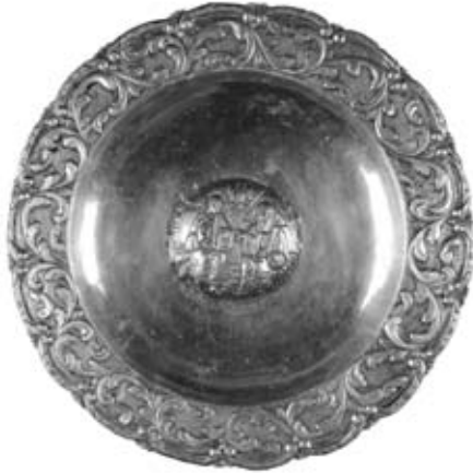
Εικ. 4. Αργυρός Δίσκος Ἄρτου μέ παράσταση τῆς Ἁγίας Τριάδας, Σαζάλτζα, Ἐπιγραφή: «ΑΝΑΣΤΑΣΙΟΣ ΜΙΧΑΗΛ 1860».