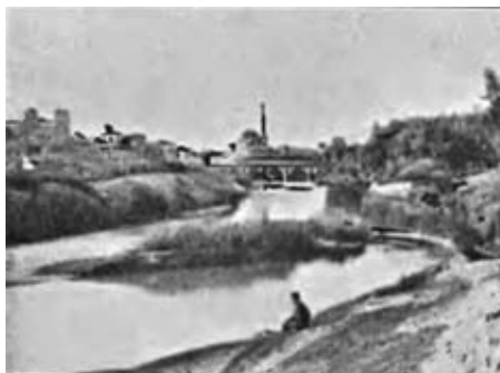
Λάρισα. Αριστερά η Μητρόπολη, δεξιά το τζαμί του Χασάν Μπέη (δημοσιευμένο σε αυτό τό κείμενο από τόν Σίνικο).