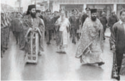
Λιτανεία στην Έδεσσα. Διακρίνεται ο τότε Μητροπολίτης Έδέσσης καὶ νῦν Ἅγιος Καλλίνικος.