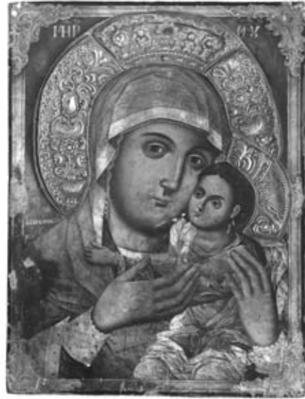
Εικ. 2. Παναγία Γλυκοφιλοῦσα, 1831, Ποτάμια.

γιά πρώτη φορά ἡ παρουσίαση ἐκκλησιαστικῶν κειμηλίων τῶν προσφύγων στή Θεσσαλία, ὅπου ἐγκαταστάθηκε σημαντικός προσφυγικός πληθυσμός μετά τήν ἀνταλλαγῆ τῶν πληθυσμῶν.