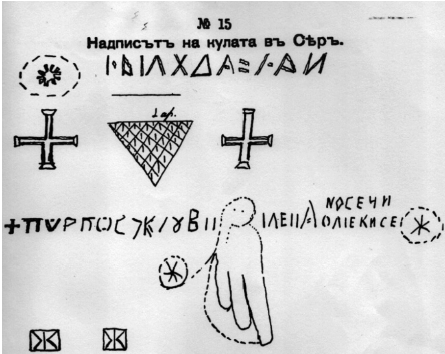
Επιγραφή στον πύργο των Σερρών (Όπως την παρουσίασε ο Γκεόργκι Στρέζοφ στον πίνακα Ν ο 15 στην εργασία του «Два санджака от Източна Македония».