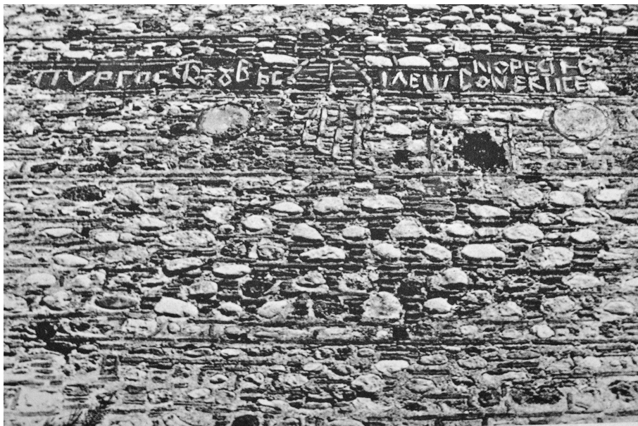
168. Η επιγραφή στη βόρεια πλευρά του μεγάλου πύργου της Ακρόπολης Σερρών, που διακόπτεται από σχεδιάσμα περικεφαλαίας (οικόσημο του Ντουσιάν): «Πύργος Στεφάνου βασιλέως, ον ἐκτίσεν Ορέστης».