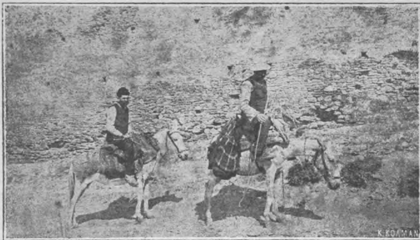
....Καὶ τὸ βράδυ, ὅταν γυρίζουν ἀπὸ τὸ παζάρι, κατὶ βοίσκεται στὸν τουρβᾶ γιὰ νὰ φιλέψουν στὰ μικρά τους.

λου Γκοτζολίκα, ὅστις μᾶς προσέφερε τὸ γεῦμα.