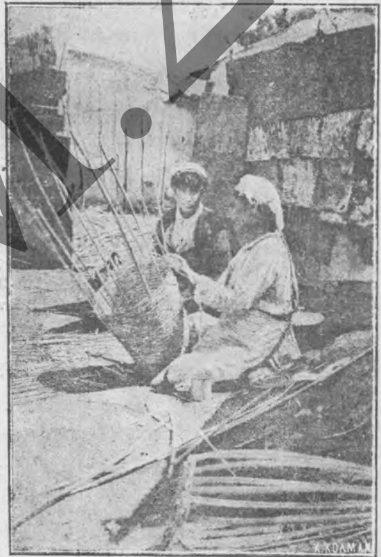
Ός και της κυμέλες για τα μελισσια της κάνουν μόνες τους....

Άναχωροϋντες εκ Μπόστάνης μετά πορείαν μιās και ήμισείας ώρας δια μέσου πικνοτάτου δάσους εκ πεύκων, δρυών και κέδρων, φθάνομεν εις τό γραφικώτατον χωριόν Δράτσιον.