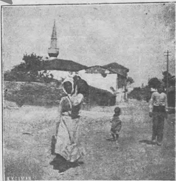
Ἡ προσφυγοπούλα γυρίζοντας ἀπὸ τὴ βρύσι, μετὰ τὴν στάμνα, νοσταλγεῖ τὴ βρύσι τοῦ χωριοῦ ποῦ ἄφησε στὴ μαζουρή τῆς πατρίδα.