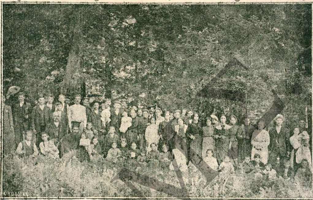
Ἐνα ἐξοχικὸ γλέντι κάτω ἀπὸ τὰ ἔλατα τ' Ἀῶ-Γάλνης