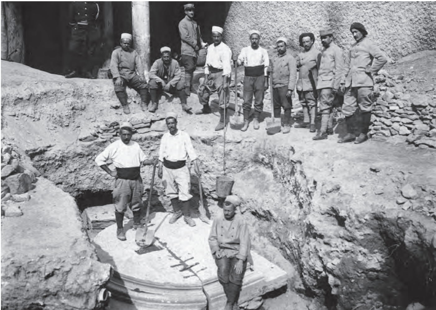
Fig. 6. The uncovering of the ambon’s base, close to the southern entrance of the courtyard, of which a column of the canopy is discerned.