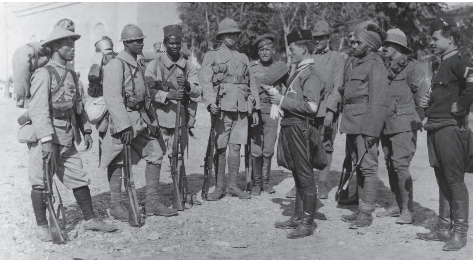
Members of the multinational Allied Army on the Salonika Front.