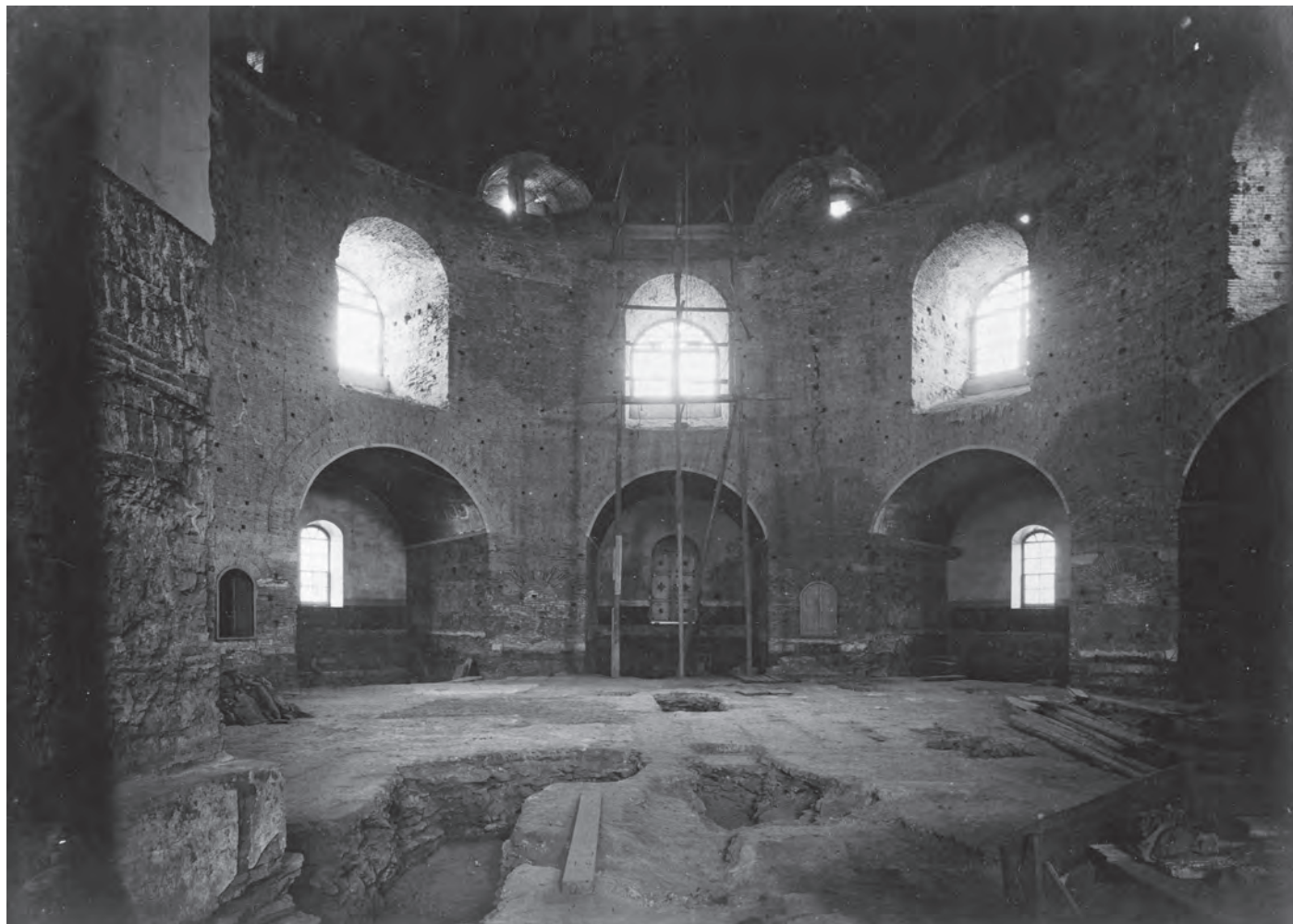
Fig. 5. The excavation trench between the eastern niches and the circular core of the Rotunda, which was given the form of a subterranean chamber after the excavation.