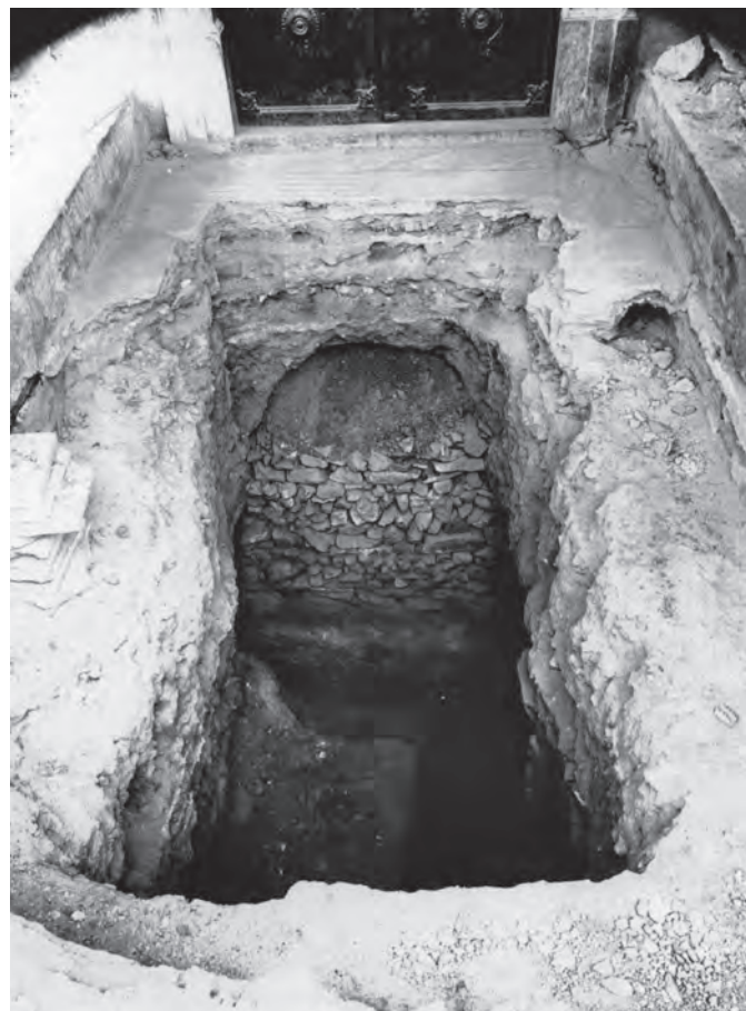
Εικ. 4. Διερευνητική τομή στη νότια είσοδο της Ροτόντας, όπου εντοπίστηκε μικρό τμήμα χαμηλού τοίχου.