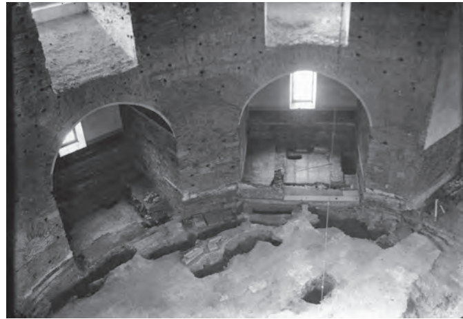
Εικ. 3. Πολυάριθμες διερευνητικές τομές στις κόγχες και πλησίον των πεσσών της Ροτόντας.