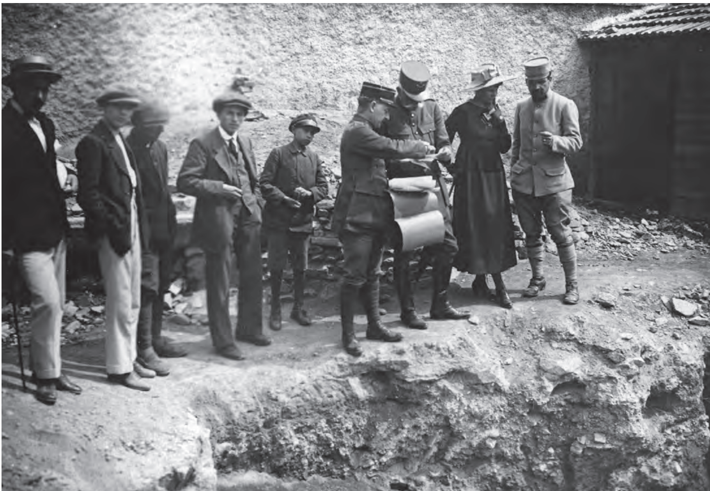
Fig. 1. Excavations of the French Armée at the courtyard of the Rotunda.