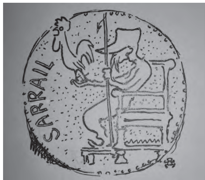
Εικ. 7. Ο στρατηγός Σαράιν ως Δίας. Πρωτότυπο σχέδιο (μαύρο μελάνι σε χαρτί) του Γερμανού καλλιτέχνη Άρπαντ Σμιντχάμμερ. Δημοσιεύτηκε στο γερμανικό περιοδικό Jugend (1916, τόμος 21, τεύχος 30, σελ. 624), με το οποίο ο Άρπαντ Σμιντχάμμερ είχε τακτική συνεργασία. © Συλλογή Διονύση Στεργιούλα.

The second question of the excavational research, as indicated by the location of the excavational trenches close to the pillars which were formed between the niches, was the existence of a “crypt,” i.e. a subterranean chamber or a descending stairwell towards it, similar to the spiral stairs at the interior of the two pillars on both sides of the southern niche. However, no evidence for the existence of a crypt at the Rotunda was found. Should there have been, Hébrard would have identified with certainty the Ro-