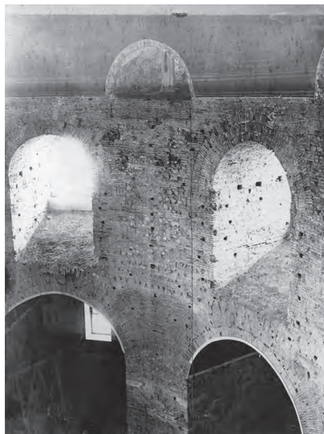
Fig. 2. Interior view of the Rotunda. After the removal of the plaster the raised sills of the lunettes became visible.

Εικ. 2. Εσωτερική άποψη της Ροτόντας. Μετά την καθαίρεση των επιχρισμάτων ήταν ευδιάκριτη η υπερύψωση των ποδιών των φωτιστικών θυρίδων.