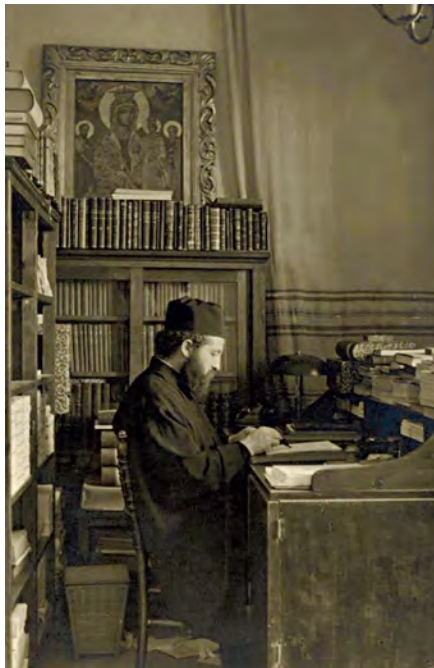
Ὁ ἐπίσκοπος Διονύσιος στὸ γραφεῖο τῆς οἰκίας του στὴν ὁδὸ Ψαρῶν 40 στὴν Ἀθήνα (περ. 1950).

Ἔρμος, φτωχὸς κι' ἀποδιωγμένος/ ἀπὸ γονιούς, ἀπὸ δικούς