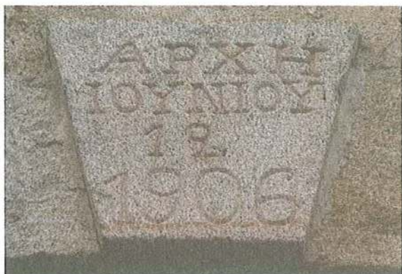
Εικ. 18 Μετόχι Μ. Ξηροποτάμου στη Σάρτη. Κτητορική επιγραφή κεντρικού κτιρίου