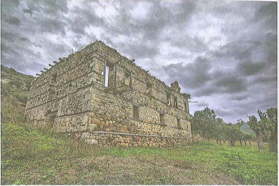
Εικ. 6 Οίκημα οικονόμου μετοχίου Μ. Διονυσίου στη Συκιά