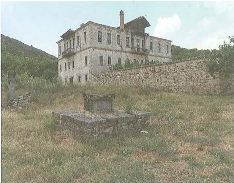
Εικ. 2 Μετοχιακό συγκρότημα Μ. Ξηροποτάμου στη Σάρτη