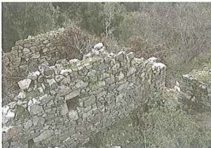
Εικ. 9 Ερειπιώνας μετοχιακών κτιρίων Μ. Δοχειαρίου στα όρια Σάρτης - Συκιάς