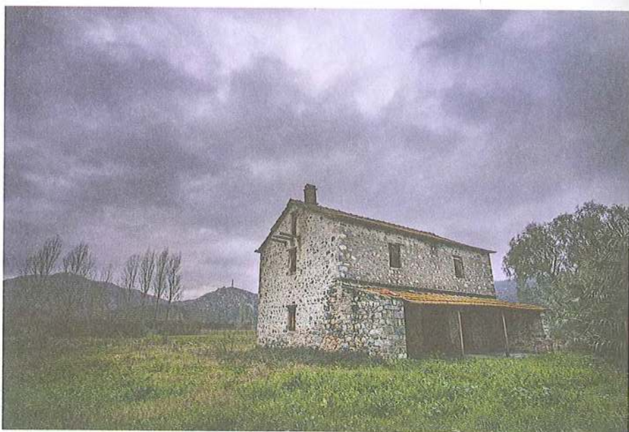
Εικ. 4 Οίκημα οικονόμου μετοχίου Μ. Αγίου Παντελεήμονος στη Συκιά