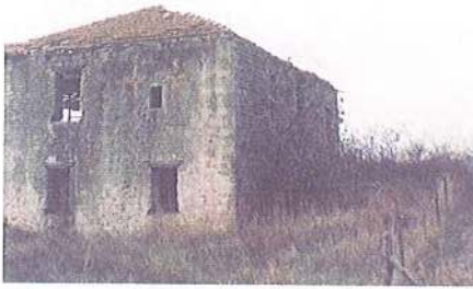
Εικ. 15 Μετόχι Μ. Μεγ. Λαύρας στη Συκιά. Παρεκκλήσι στο οίκημα του οικονόμου (σήμερα δεν υφίσταται – φωτ. 1980)