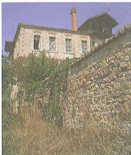
Εικ. 19 Μετόχι Μ. Ξηροποτάμου στη Σάρτη. Περιτείχιμα και ΝΑ πλευρά κεντρικού κτιρίου