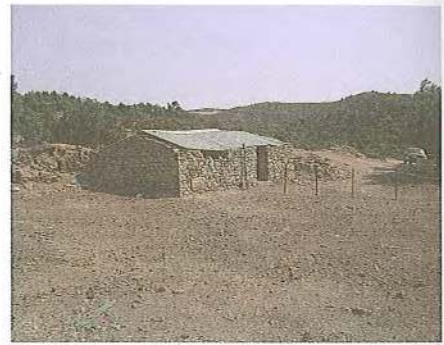
Εικ. 8 Καλύβα μετοχίου Μ. Ζωγράφου στον Προφήτη Ηλία Συκιάς