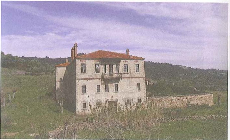
Εικ. 17 Μετόχι Μ. Ζηροποτάμου στη Σάρτη. Νότια πλευρά κεντρικού κτιρίου