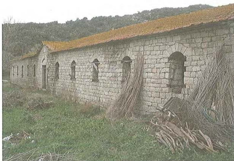
Εικ. 12 Μεταξώνας μετοχίου Μ. Διονυσίου στο Καλαμίτσι (1914)