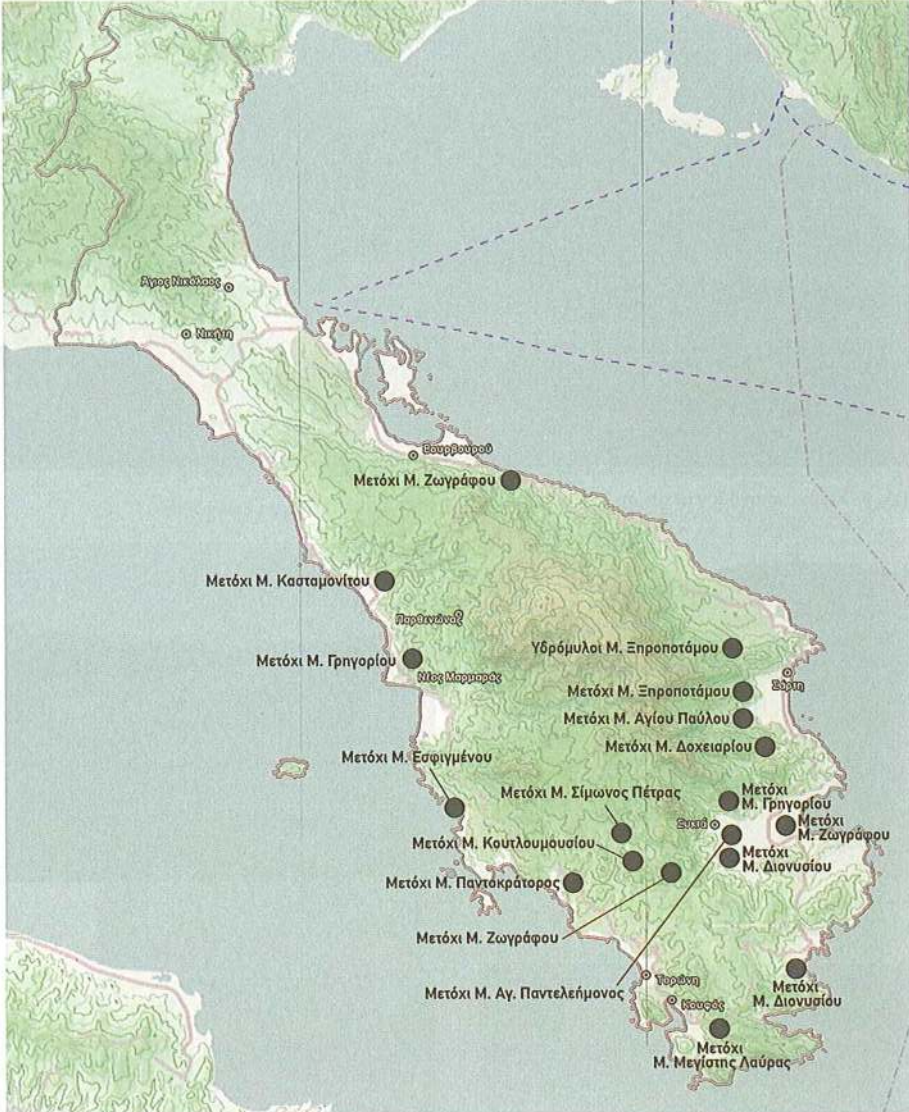
Εικ. 5 Χάρτης της Σιθωνίας Χαλκιδικής με τις θέσεις των υφιστάμενων μετοχικών κτιρίων 19ου – αρχές 20ού αι.