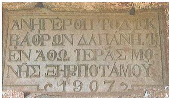
Εικ. 21 Μετόχι Μ. Ξηροποτάμου στη Σάρτη. Κτητορική επιγραφή κεντρικού κτιρίου