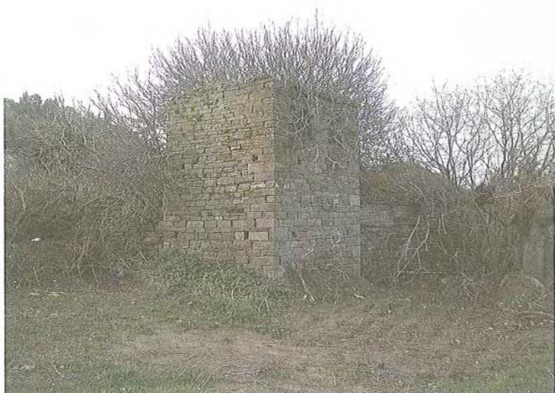
Εικ. 11 Μετοχιακό συγκρότημα Μ. Κασταμονίτου στον Τριπόταμο