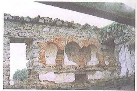
Εικ. 16 Παρεκκλήσι στο μετόχι Μ. Διονυσίου στη Συκιά (φωτ. 1990)