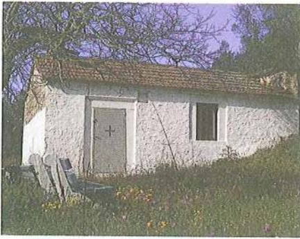
Εικ. 13 Μετοχιακός ναός Ζωοδόχου Πηγής Μ. Αγίου Παύλου στη Σάρτη (1852)