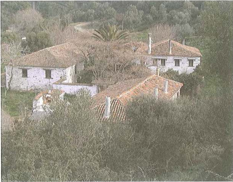
Εικ. 1 Μετοχιακό συγκρότημα Μ. Παντοκράτορος στο Αζάπικο