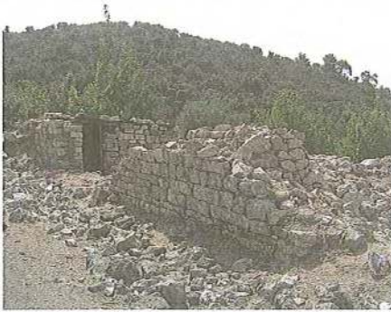
Εικ. 7 Ερειπιώνας μετοχιακών κτιρίων Μ. Κουτλουμουσίου στη Συκιά