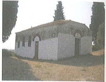
Εικ. 14 Μετοχιακός ναός Αγίου Γεωργίου Μ. Ζηροποτάμου στη Σάρτη (1867)