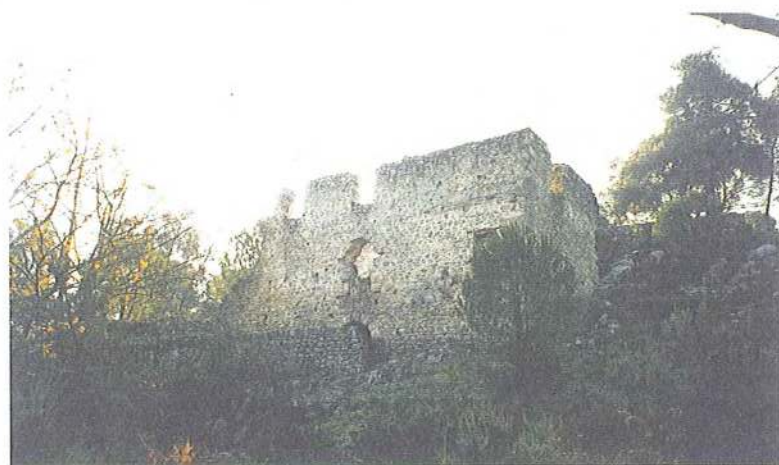
Εικ. 25 Μετόχι Μ. Εηροποτάμου στο Πλατανίτσι, Υδρόμυλοι