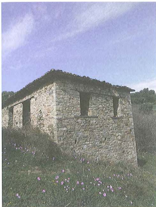
Εικ. 24 Μετόχι Μ. Εηροποτάμου στη Σάρτη, Βαγεναρείο (1896)