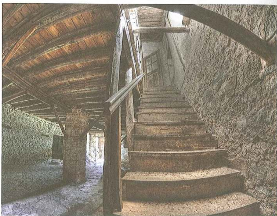
Εικ. 23 Μετόχι Μ. Εηροποτάμου στη Σάρτη. Κλιμακοστάσιο υπογείου κεντρικού κτιρίου