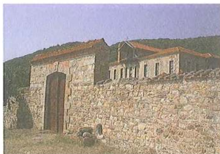
Εικ. 20 Μετόχι Μ. Ξηροποτάμου στη Σάρτη. Ανατολική είσοδος συγκροτήματος