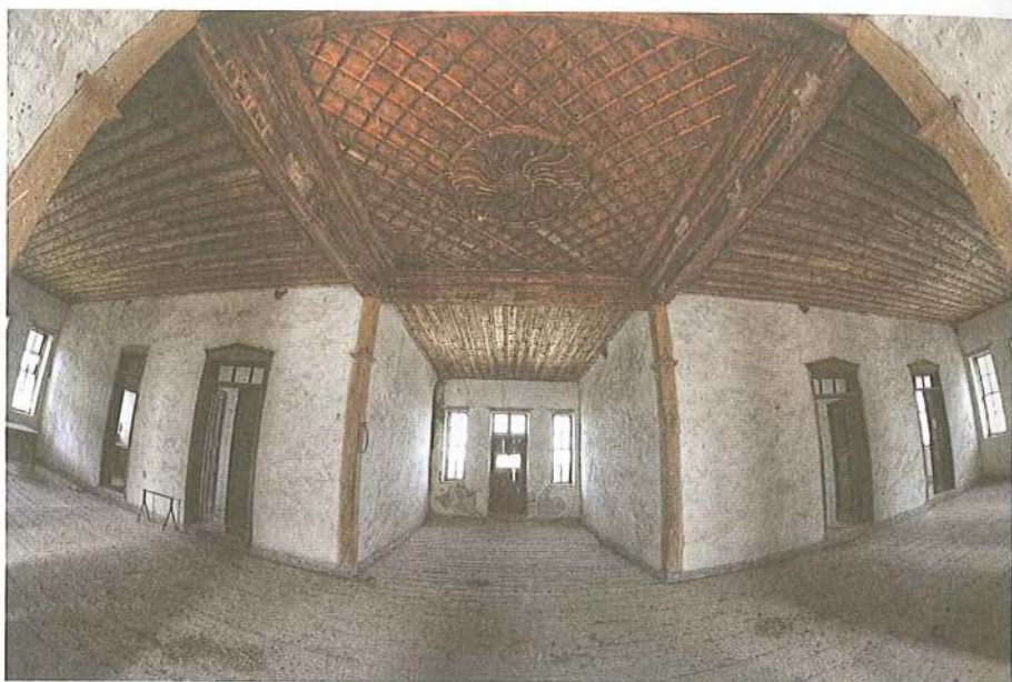
Εικ. 22 Μετόχι Μ. Εηροποτάμου στη Σάρτη. Ταβάνι 1ου ορόφου κεντρικού κτιρίου