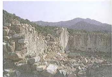
Εικ. 10 Ερειπιώνας μετοχιακών κτιρίων Μ. Σίμωνος Πέτρας στη Συκιά