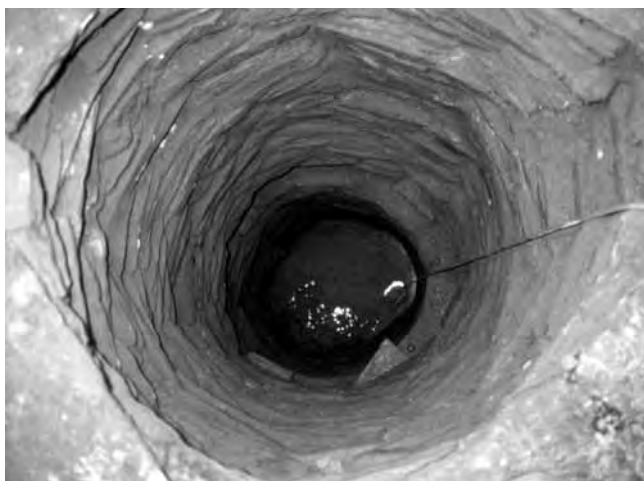
Εικ. 6. Τὸ ἐσωτερικὸ τοῦ πηγαδιοῦ τῆς εικ. 5.

Ἡ ἀνασκαφικὴ διερεύνησή του 29 πιστοποίησε ὅτι τὸ πηγάδι ἔπαυσε νὰ χρησιμοποιεῖται γιὰ ὕδρευση καὶ μετατράπηκε σὲ ἀποθήκη, τουλάχιστον ἀπὸ τὸν 16ον αἰῶνα 30 . Τὸ περιεχόμενον τοῦ ἀποθήτη διαταράχθηκε τουλάχιστον μία φορά, ὅταν ἔγιναν ἔρευνες, ἴσως γιὰ ἀνεύρεση θησαυροῦ, πιθανῶς κατὰ τὰ τέλη τοῦ 18ου αἰῶνος 31 . Αὐτὸς εἶναι ὁ λόγος τῆς ἐλλείψεως δεδομένων στρωματογραφίας καὶ τῶν ἀντιστοιχῶν χρονολογικῶν συμπερασμάτων.