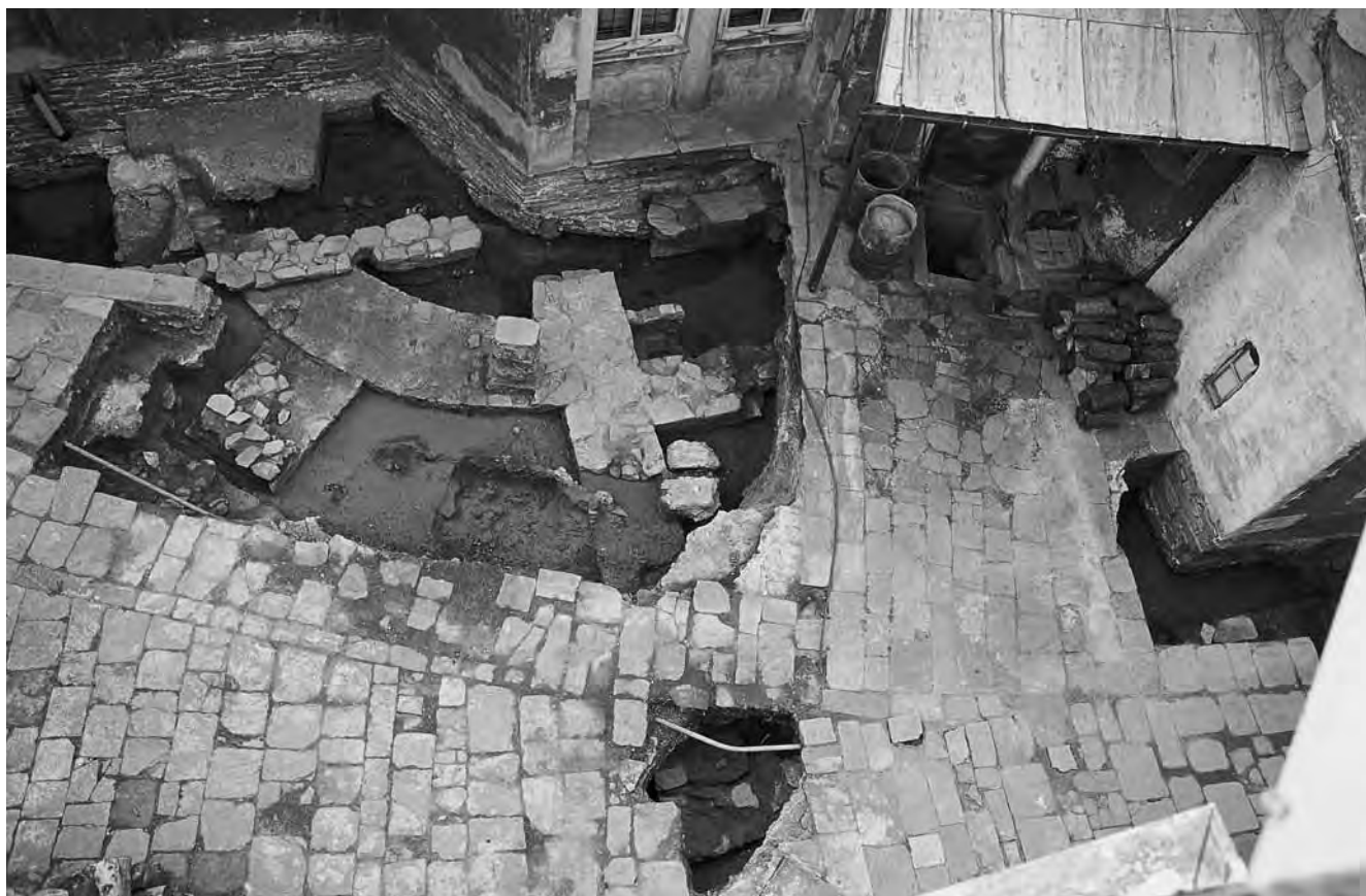
Εικ. 1. Το αποκαλυφθέν τμήμα της βασιλικής στην βόρεια πλευρά του Καθολικού της Μονής Βατοπεδίου.

λούθησε μία βαθύτερη δοκιμαστική τομή, περίξ του βορείου χορού, για να μελετήσουμε την στρωματογραφία του υπεδάφους 22 . Έτσι έντοπίσθηκε τὸ βορειοανατολικὸ τεταρτημόριο μιᾶς παλαιοχριστιανικῆς βασιλικῆς (εἰκ. 1), πάνω στοῦ ἀφανῆς νότιο μισὸ τῆς ὁποίας κτίσθηκε τὸ ὑπάρχον Καθολικὸ (εἰκ. 2). Ἐπί πλέον, πάνω στοῦ βορειοδυτικὸ τεταρτημόριό της οἰκοδομήθηκε τὸ παρεκκλήσιο τοῦ Ἁγίου Δημητρίου.