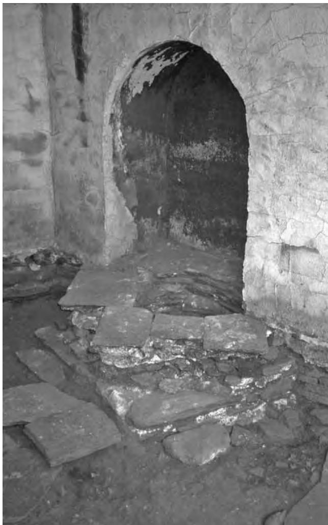
Εικ. 5. Τὸ στόμιο τοῦ πηγαδιοῦ ὑπὸ τὸν δυτικὸ τῶχο τοῦ νοτίου χοροῦ τοῦ Καθολικοῦ τῆς Μονῆς Βατοπεδίου.