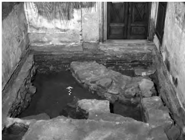
Εἰκ. 4. Τὸ ἀποκαλυφθὲν τμήμα τοῦ κτίσματος ὑπὸ τὸ δάπεδο τοῦ βορείου τομέως τοῦ νάρθηκος τοῦ παρεκκλησίου τοῦ Ἁγίου Νικολάου τῆς Μονῆς Βατοπεδίου.

Ἐπὶ ἔτι καὶ ἄλλη μία κατασκευὴ, παλαιότερη τοῦ Καθολικοῦ, ἡ ὁποία πιθανῶς νὰ ἀνήκει στὸ συγκρότημα τῆς βασιλικῆς. Πρόκειται γιὰ τὸ πηγάδι τὸ ὁποῖο βρίσκεται στὰ θεμέλια τοῦ δυτικοῦ τοῖχου τοῦ τρίπλευρου νοτίου χοροῦ τοῦ Καθολικοῦ (εἰκ. 2 καὶ 5). Κατὰ τὴν οἰκοδόμησιν τοῦ Καθολικοῦ λήφθηκε μέριμνα νὰ μὴν παρακλυθῆ ἡ λειτουργία τοῦ πηγαδιοῦ, τὸ